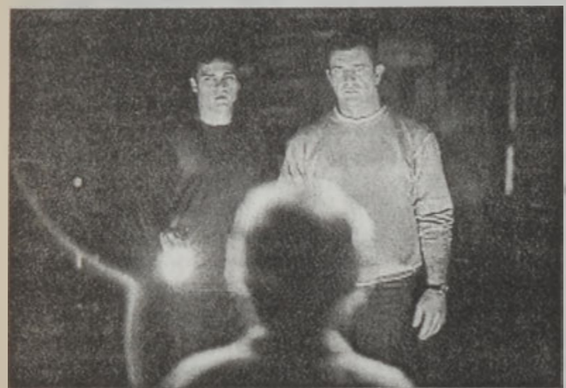
Միլ Կիպուրն (աջին) «Սայնզ» ժապաւենին մէջ

Ան միաժամանակ «Իլլաժ»-ի թէ՛ կատակերգութեան մը ցարդ ամէնէն մեծ բացումը շաբաթուան եւ թէ՛ Յուլիս ամսուան մէջ ցուցադրութեան սկսող որեւէ ժապաւենի ամէնէն մեծ բացումը շաբաթուան եկամուտը: Իսկ համեմատաբար նուազ դրամագլուխով ճամբայ ելած «Մայլիլ Ֆէր Կրիթ Ռե-տիկ»-ը որ նոյնպէս յառաջիկայ շաբաթ պիտի սկսի ցուցադրուի Լիբանանի մէջ, արդէն արժանացած է բոլորին նախահին: «Մ. Նահանգներու թիւ մէկ կատակերգութիւնը» բացատրութեամբ ծանուցուող այս ժապաւենը հանդիսացած է բոլոր ժապաւեններու ամերիկեան յաւազոյն տարա ժապաւեններու ցանկին մէջ ամէնէն աւելի մնացած ժապաւենը: