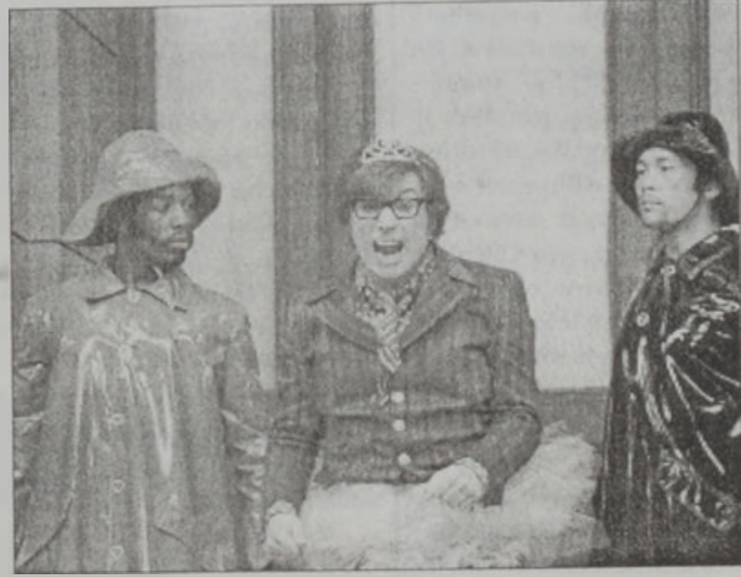
«Օսթին Փաուլըրը ին Կոլտմենպըր»

Լած մը կ'անդրադառնայ Հոլիվուտի սթիլտիոններուն կողմէ ամէն շաբաթ հնարուող «գրեւորներուն»: Յօգուածագիրին համաձայն, Հոլիվուտի մէջ իւրաքանչիւր շաբաթավերջի հետ կու գայ