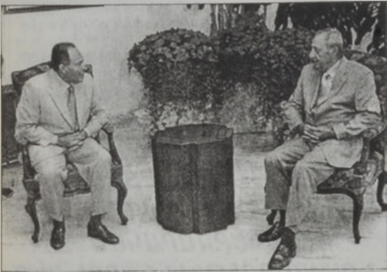
Նախագահ զոր. Իմիլ Լահուտ երկ կապակահան պալատին մէջ ընդունեց խորհրդարանի նախագահ Նեպիչ Պերրիին, որուն հետ քննարկեց տեղական եւ շրջանային իրադարձութիւնները:

Հանդիպումին ետք, Պերրի յայտնեց, որ նախագահ Լահուտի փոխանցած է Աւստրիա կատարած իր պաշտօնական այցելութեան արդիւնքները: Փոխադարձաբար նախագահ Լահուտ Պերրիի պարզեց եմէն եւ Օման կատարած իր պաշտօնական այցելութիւններուն արդիւնքները: