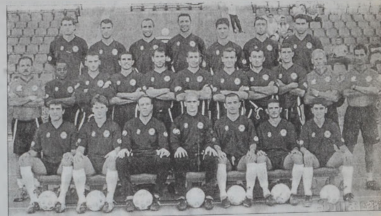
Հայաստանի ֆուտպոլի ազգային խումբին վերջին լուսանկարը

Եւրօ - 2004ի պտու մի մրցումներուն, Հոկտեմբեր 16ին Արեւիքի մէջ տեղի պիտի ունենայ Յունաստան - Հայաստան մրցումը, որ ֆուտպոլի աշխարհին մէջ պիտի ըլլայ պատմական հանդիպում մը, որովհետեւ անիկա պաշտօնական առաջին հանդիպումն է երկու երկրներուն միջեւ: