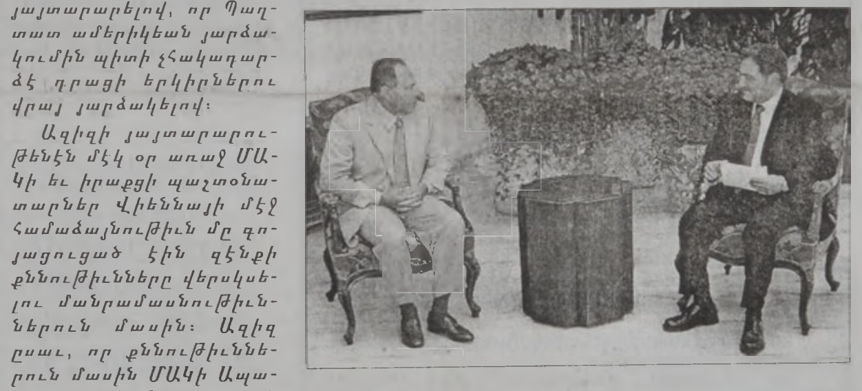
Նախագահ զօր. Էմիլ Լահուտ երէկ Պաղտատի պալատին մէջ ընդունեց երիտասարդութեան եւ մարմնակրթութեան նախարար Սեպուհ Յովնանեանը, որ շնորհակալութիւն յայտնեց նախագահին՝ «Աղբալեան - Հ.Մ.Լ.Մ.» մարզամշակութային համալիրին բացման հանդիսութեան հովանաւորութեան համար:

Հանդիպումին քննարկուեցան նաեւ Տրպայայի մէջ նախարարութեան նախաձեռնութեամբ կառուցուող մարզական համալիրին մանրամասնութիւնները: Համալիրը պիտի կոչուի նախագահ Լահուտի անունով, իսկ համալիրին հիմնարկէք պիտի կատարուի երեք շաբաթ ետք: Նախարար Յովնանեան նախագահ Լահուտի փոխանցեց նաեւ, թէ Ֆրանսախոս երկիրներու վեհաժողովին ետք պիտի այցելէ իրաք, ուր իր մարզին յատուկ համաձայնադրներ պիտի կնքէ համապատասխան մարմիններու հետ: