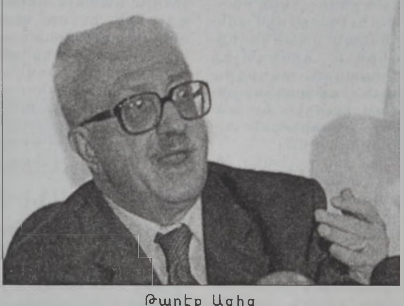
Թարէք Ազիզ Ֆրանսայի, Ռուսիոյ եւ շարժուան վերջաւորութեան: Ուաշինգթոն մինչ թիւնը: Նախագիծը Ապահովութեան Խորհուրդին պիտի ներկայացուի այս Ծարք՝ էջ 10

Իրաք երէկ դատապարտեց գէնքի քննութիւններուն առնչուող ՄԱԿի խիստ բանաձեւի մը ամերիկեան առաջարկը, մինչ ամբողջ աշխարհը «չունչը բռնած» կը հետեւի իրադարձութիւններուն, որոնք կրնան պատերազմով մը եզրափակուի: Իրաքի փոխ վարչապետ Թարէք Ազիզ Թուրքիոյ մէջ յայտարարեց, որ Պաղտատ կը մերժէ ու անընդունելի կը նկատէ ՄԱԿի որեւէ նոր որոշում, որ կ'առնչուի գէնքի քննութիւններուն: Ազիզ աւելցուց, որ իրաք պիտի հակադարձ ամերիկեան որեւէ յարձակումի, որուն թիրախը իրաքեան հողերը պիտի ըլլան: Ազիզ շեշտեց, որ պատերազմի պարագային, իրաք վնասներ պիտի կրէ, սակայն անոր աւարտին, թշնամին հասած պիտի չըլլայ իր նպատակին: Իրաքի պաշտօնատարր փորձեց նաեւ փարատել Թուրքիոյ մտավախութիւնները, յայտարարելով, որ Պաղտատ ամերիկեան յարձակումին պիտի չհակադարձէ զբացի երկիրներու վրայ յարձակելով: