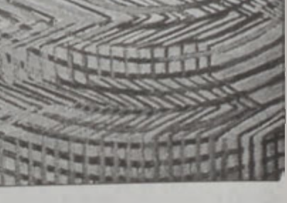
«Ժամանակ», գործ՝ Բնարիկ Վարդանեանի

Ծարժումնակ են եւ արտաքին միջավայրի մանրամասները, միջավայր, ուր նկարչուհին տեղադրել է հորատողներին, դրանով ընդգծելով շրջանաձեւ «թռչող» կենտրոնախոյս ուժերի հոսքը: Այս համադրումն հիմնուում ընկած է ուսողական հաշուարկը, որ քաղաքային է ամէն տեսակ պատահականութիւն, աշխատանքը դարձրել համոզիչ: Բնորդին մանրազնին հետազօտները, նախօրոք կատարած հաշիւաւոր ճեպանկարներն ու էսքիզները հնարաւորութիւն են տուել կենտրոնական մտքին խանդարող ամէն ինչ դուրս նետել եւ հասնել վերջնական տարբերակին: Վերջնական տարբերակը ուժեղ է, իսկ են իսկ շնորհիւ երկարատեւ ու քրտնալան փնտաւումների գաղտնի առկայութեան, փնտաւումներ, որ արտայայտչութեան հասնելու համար կրակոտ պայթա-