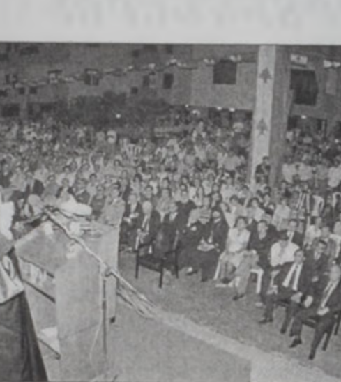
Վեճափառ հայրապետը իր խօսքի պահուն