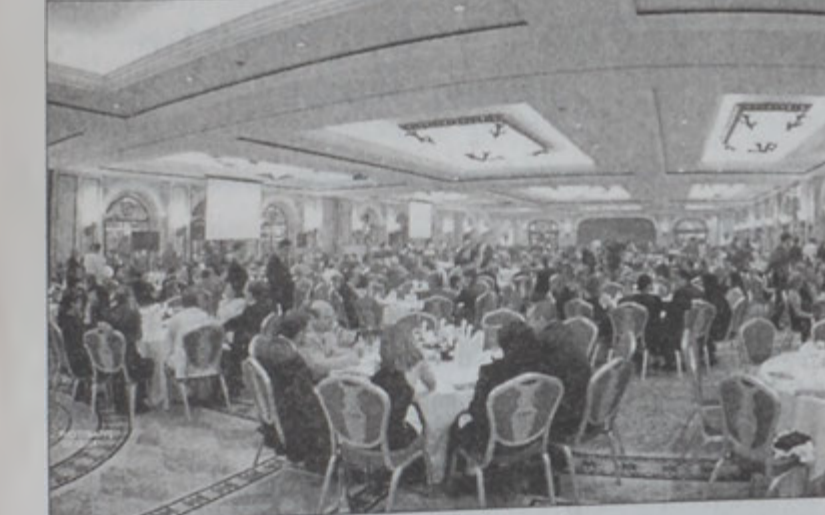
Ներկայեցնելու մաս մը

Սյապէս պատգամեցին: Առանձին չձգենք պանոնք, տէ՛ր կանգնինք ու պիտի կանգնինք անոնց»: