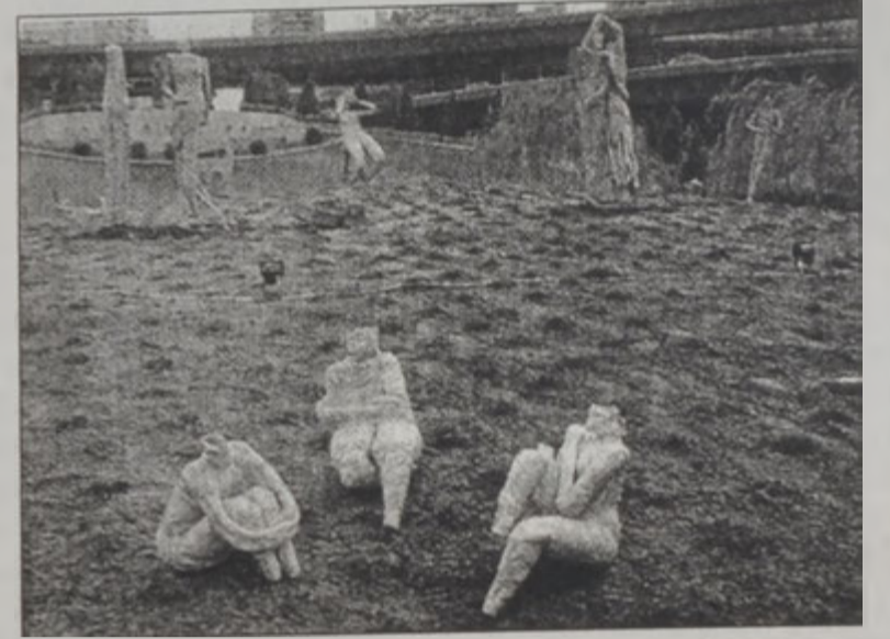
Շրպան խալի Շրպանի անուան պարտեզին մեջ ցուցադրուող բանդակները:

Արդեն շարքի մը ի վեր Պէրոյի Շրպանի խալի Շրպանի անուան կրող հանրային պարտեզը կը հիւրընկալէ հետաքրքրական երեւոյթով, սովորական մարդու հասակով, սակայն յաճախ անզուրիք քանդակներ, որոնք ինչ անորոշ լիբանանցի կերպարներու գիտնական Միքայիլ Հոնիչին է: