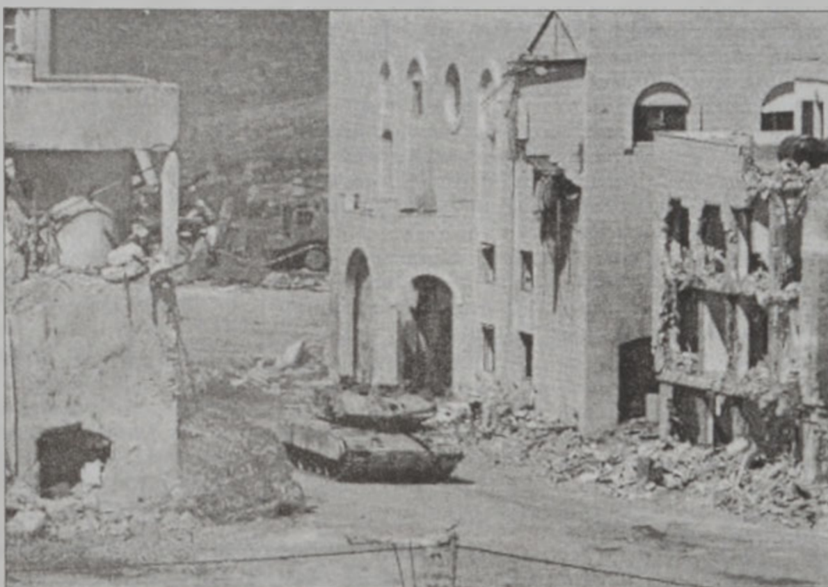
Արաֆաթի կեղծոճատեղի՝ քարուքար

Ետեւ Երաֆաթի նստավայրին պաշարուածէն չորս օր ետք, իսրայէլացի ու պաղեստինցի պաշտօնատարներ երէկ առաջին անգամ ըլլալով հանդիպում մը ունեցան, որուն ընթացքին սակայն չլսողեցան լուծել չորսօրեայ տագնապը: