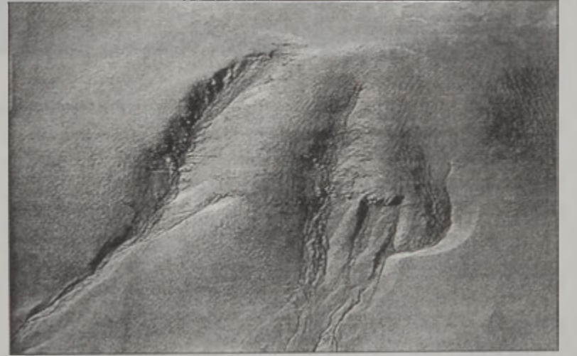
2000ին «Մարս Կլոպըր Սըրվէյըր»ի կողմէ յայտնաբերուած այս հեղեղատները կը յիշեցնեն երկրագունդի հեղեղները:

ՆԱՍԱի գլխաւոր նպատակն է միջոցը գտնել, որ մարդիկ մնալու կերպով Հրատի վրայ ապրին ու աշխատեն: Հրատը միշտ ալ գլխաւոր թեկնածուն եղած է, մոլորակային առաջին այցելութեան մը համար, հսկանակ անոր որ կարգ մը գիտնականներու կարծիքով, մարդիկ ղրկելը ամէնէն անգործանակն ձեռնէ անոր մասին տեղեկութիւններ քաղելու: