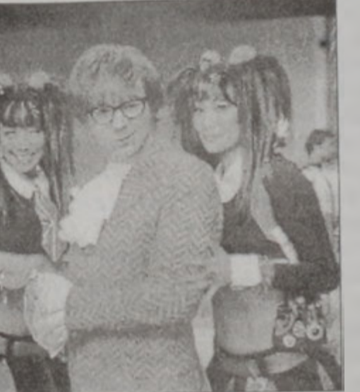
«Օսթին Փաուլըզ ին Կոլտմենայր» ժապաւեցն

Շարժապատկերի լիբանանեան սրահներուն մէջ «Մայնորիթի ռիփորթ»-ի ծանուցած ժամանակ մին կողքին, այս շաբաթ կը սկսի ցուցադրութիւնը երկու այլ ժապաւեցններու, որոնք շատ հաւանաբար մնան սփիլպրոկեան նոր գլուխ գործոցին շուքին մէջ: