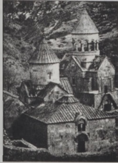
Նորավանք, կառուցուած՝ 13րդ դարում

Էլ միածինը նաեւ աշխարհի մասնէն հին մայր եկեղեցիին եւ դպրիկաներին վայրն է: