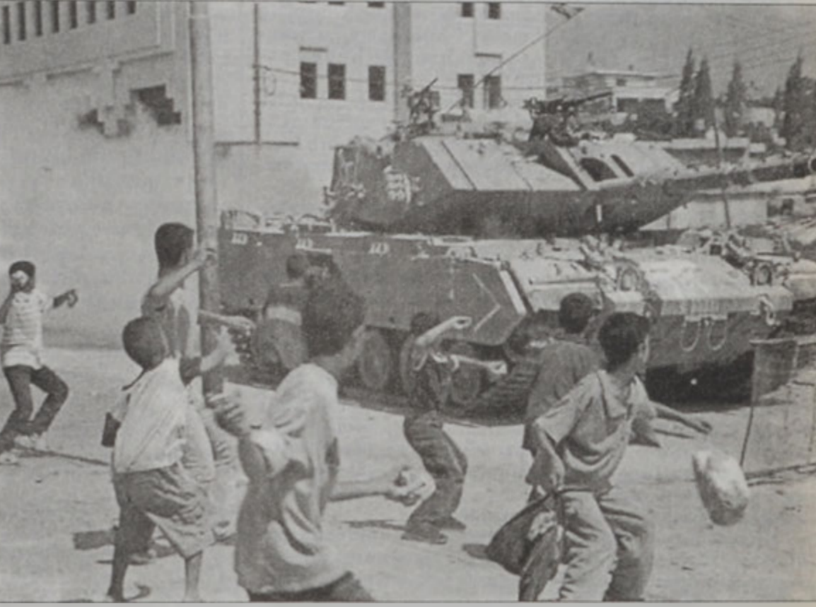
Պաղեստինցի պատահներ կը քարկոծեն իսրայէլեան հրասայլ մը Ռամալլայի մէջ

Թէլ Աւիւի մէջ երէկ անձնասպանական գործողութիւն մը առնուազն 5 զոհ եւ շուրջ 40 վիրաւոր խլեց: Օթոպիւսի մը մէջ պատահած պայթուումը կը յաջորդէր հիւսիսային իսրայէլի մէջ Չորեքշաբթի օրուան անձնասպանական գործողութեան, որուն պատճառով իսրայէլացի ոստիկան մը սպաննուած էր: Անիկա Օզոստոս 4 էն ի վեր նման առաջին գործողութիւնն էր: