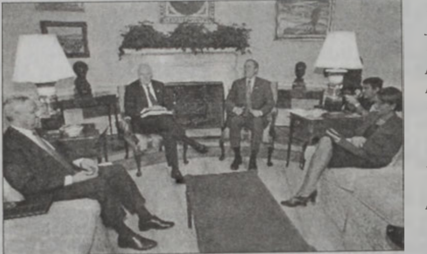
Պուշ կը խորհրդակցի Չէյնցիի, Փաուլիի եւ Ռայսի հետ

Ֆրանսայի արտաքին գործոց նախարար Տոմինիք տը Վիլիէմ երէկ շեշտած է, որ ՄԱԿի Ապահովութեան Խորհրդի միջոցով կ'արեւմտեան իրաւունքները չեն փոխուած: