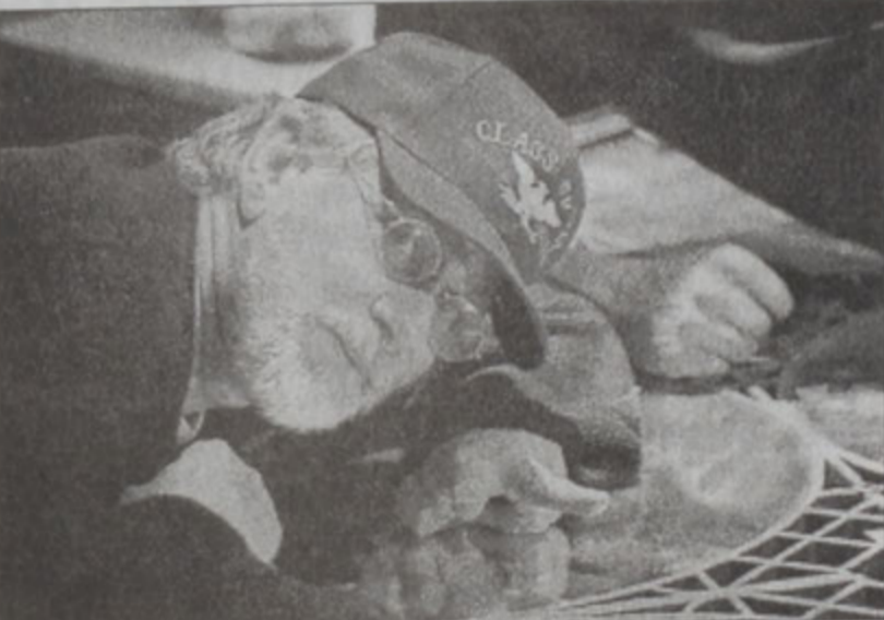
Սփիլպրոկ՝ «Մայնորիթի ռիփորթ»-ի նկարահանումին աշխատանքներուն ընթացքին

աշխատանքին: Սփիլպրոկ կ'ուզէ անպայման օր մը բեմադրել երաժշտախառն ժապաւեցն մը, «եթէ նոյնիսկ ամբողջ աշխարհը վրաս ծիծաղի»: Քաջաբերական է տեսնել, թէ ինչպէս նոր համալսարանաւարտ մը այսքան ինքնավստահութիւն ունի: