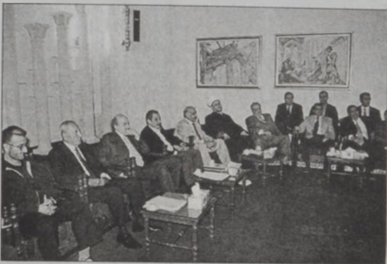
Խորհրդարանի նախագահին մօտ

Լիբանանեան կուսակցութիւններու եւ պաղեստինեան կապակերպութիւններու «դիմադրութեան, ինքիֆատայիւն եւ գաղթականներու տունդարձին հետ պօրակցութեան» չորրորդ խորհրդակցական հանդիպումը կայացաւ երէկ, Այնէլ Թիւնէի մէջ. խորհրդարանի նախագահ Նեպիհ Պըրրիի մօտ: