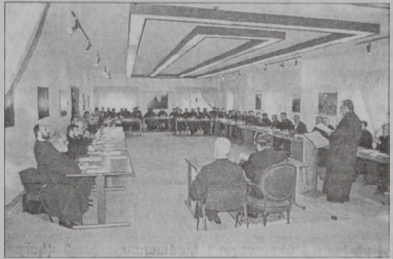
Համագումարէն պահ մը

Յաջորդ օր, առաւօտուն Պրեֆաթայի Ա. Աստուա-