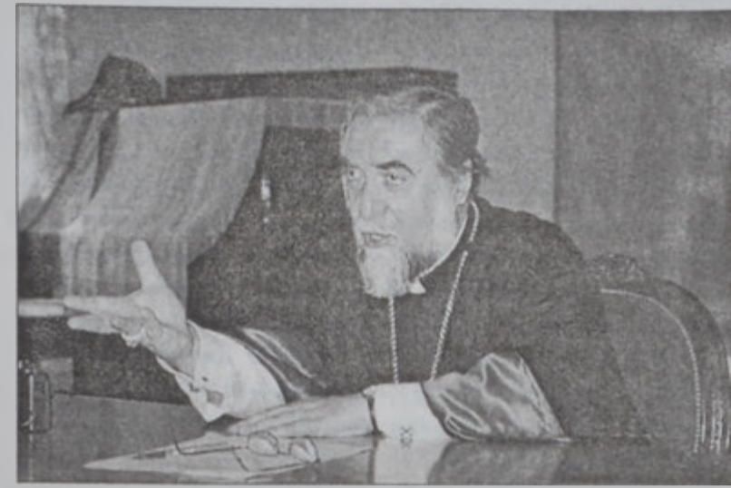
Վեհափառը՝ խօսքի պահուց

Չորեքշաբթի 18 Սեպտեմբեր 2002ին Պրեֆաթայի վանքին մէջ բացուեց կատարուեցաւ քահանայից միջ-թեմական առաջին համագումարին, նախագահութեամբ Արամ Ա. կաթողիկոսի: