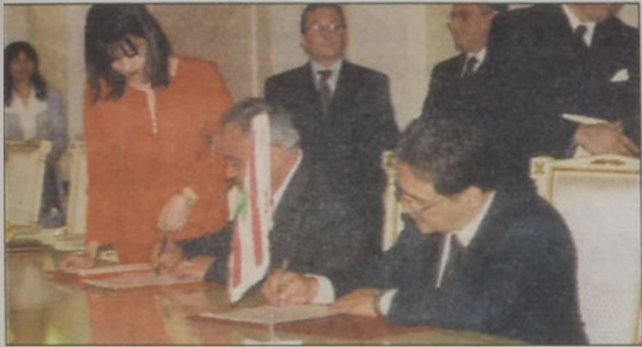
Նախարարներ Սեպուհ Յովնանեան եւ Ռոյալնո Շառոյեան կը ստորագրեն միջ-պետական գործակցութեան համաձայնագիր

2000 Փետրուար - Հայաստանի նախագահ Ռոպէրթ Քոչարեանի եւ օրեայ պաշտօնական այցելութիւնը Լիբանան: