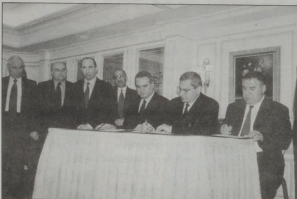
15 Փետրուար 2002. Հայաստան-Լիբանան առեւտրական գործակցութեան համաձայնագրի ստորագրութիւն: Ներու իրագործման հեռանկարով»: