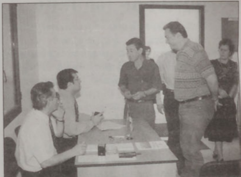
30 Մայիս 1999. Լիբանանի հայաստանցիները դեսպանատան մէջ կը մասնակցին խորհրդարանական ընտրութիւններու

Վերջապէս, տեղին է հաստատել, որ Հայաստանի եւ Լիբանանի միջեւ բազմակողմանի յարաբերութիւններու ամրապնդման եւ զարգացման մէջ մեծ է դերը լիբանանահայութեան, որ կարող է եւ պէ՛տք է հանդիսանայ բարեկամ երկու երկիրները իրարու կապող հաստատուն եւ յուսալի կամուրջ: