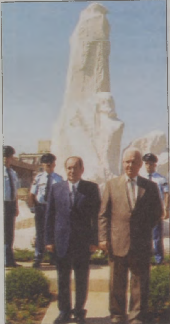
Երեւանի եւ Պուրճ Համուտի քաղաքապետները լիբանանահայ նահատակներու Յուշակոթողին առջեւ

1998 ՀՈԿՏԵՄԲԵՐ - Լիբանանի մէջ Հայաստանի դեսպանատան նոր շէնքի բացումը եւ Հայաստանի նախագահի արտաքին քաղաքականութեան հարցերու խորհրդական Արամ Սարգսեանի այցելութիւնը Լիբանան, ուր ան հանդիպումներ ունեցաւ Լիբանանի նախագահին, խորհրդարանի նախագահին եւ վարչա-