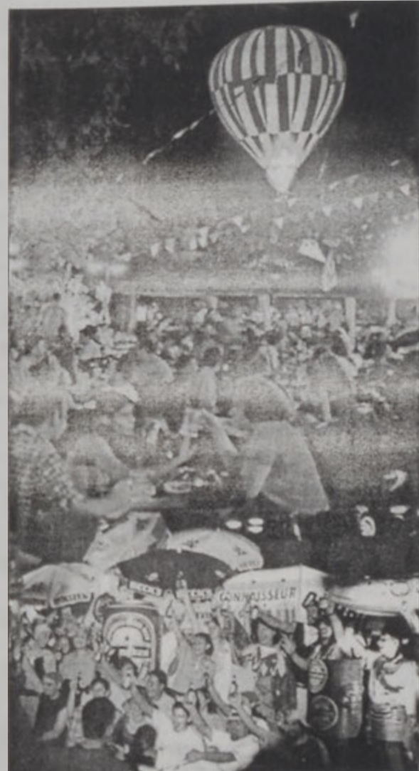
Գարեջուրի փառատօնին որմազը

Գարեջուրի սիրահարները ասկէ ետք պէտք չունին այս գովազտող խմիչքին հայր- ենիքը նկատու- րդ Գերմա- նիա երթա- լու' մասնակցե- լու համար գա- ր է ջ ո ը ի ի ն ո ի ի ռ ո յ ա ժ փառատօներու եւ երեկոնե- ռու: Սեպտեմ- բեր 6-15 Լիբ- անի մէջ տեղի պիտի ունենայ գ ա ռ է ջ ո ը ի փառատօն մը, որ անկասկած պիտի ուրա- խացնէ այս խմիչքին բոլոր սիրահարնե- րը: «Շթումֆ» հաստատու- թեան կողմէ յաջորդաբար տ ա ս ն մ է կ ե- ռ ը ղ տարին ըլլալով կապ- մակերպուող այս փառատօնին հիմնական նպա- տակն է «Գաւաթ մը գարեջուրի ջուրը կրնաս հանդիպիլ ամէնէն լաւ մար- դոց» կարգախօսին ջուրը հաւաքել Լի- բանի մէջ գարե- ջուր «պաշտող»ները եւ անոնց պարգեւել հաճելի ու հե- տաքրքրական երե- կոյ մը: