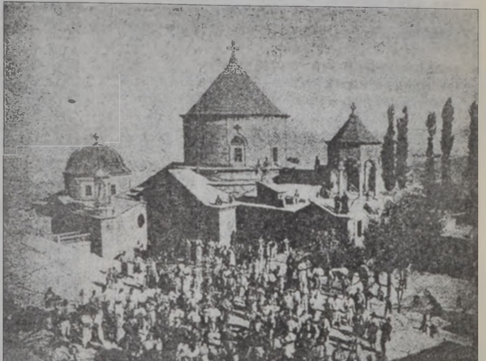
Թոմարգայի Ս. Աստուածածին վանքին Ս. Խաչ տաճարը, որուն շրջափակին մէջ խմբուած են ուխտաւորներ: