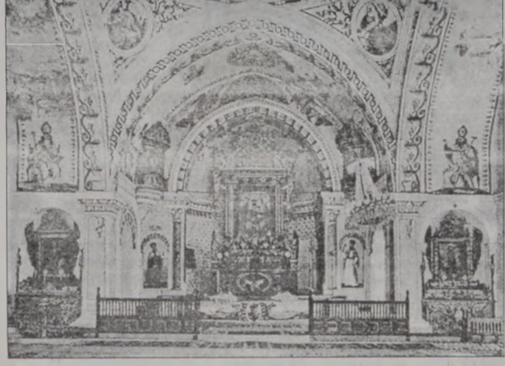
Թոմարգայի Ս. Աստուածածին վանքին Ս. Խաչ տաճարին խաչկալը եւ ներքին տեսքը. գործ՝ Միմոն խալֆա Խորասանեանի:

թիւնը կ'ըսէ, որ անոնք քանի մը եղբայրներ էին, իրենց ընտանիքներով, որոնք Պարսկաստանի խորերէն ճամբայ ելլելով եւ ամիսներ տեւող ճամբորդութենէ մը ետք հասան Փոքր Ասիոյ կեդրոնական լեռները. անոնց մէկ մասը Կեսարիոյ մէջ տեղաւորուեցաւ, իսկ մնացեալները ուղղուեցան աւելի հարաւ եւ Թոմարգայի մէջ բնակութիւն հաստատեցին: