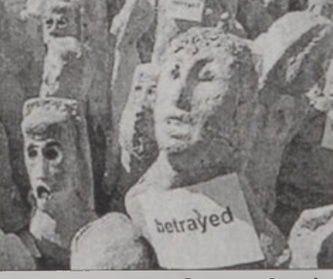
Վեհաժողովի պաշտպան բազմաթիւ խմբակներու համաձայն, վեհաժողովը իրենց դաւաճանած է:

Վեհաժողովին ընթացքին բանավեճեր տեղի ունեցած են «վերանորոգելի» բառին իմաստին շուրջ: Կարգ մը երկիրներ պահանջած են, որ կորիզային ուժանիւթը եւ ջրէլեկտրական շահաբեր ծրագիրներ այդ նիւթին մաս կազմեն: