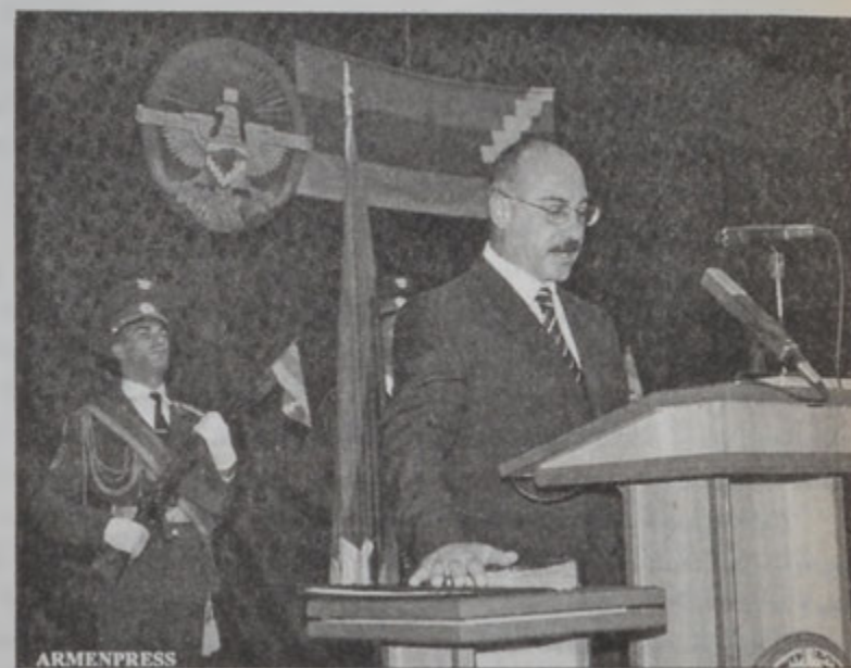
Նախագահ Արկաղի Ղուկասեան կ'երգուի

Երգուելով Արցախի պետական դրօշի, գինանշանի, 12րդ դարու Ալեքսարանի մը ու Լեռնային Ղարաբաղի անկախութեան հռչակագրի իրականացման համար՝ նախագահ Ղուկասեան ըսաւ. «Ստանձնելով Լեռնային Ղարաբաղի Հանրապետութեան նախագահի պաշտօնը, կ'երգնում» ըլլալ