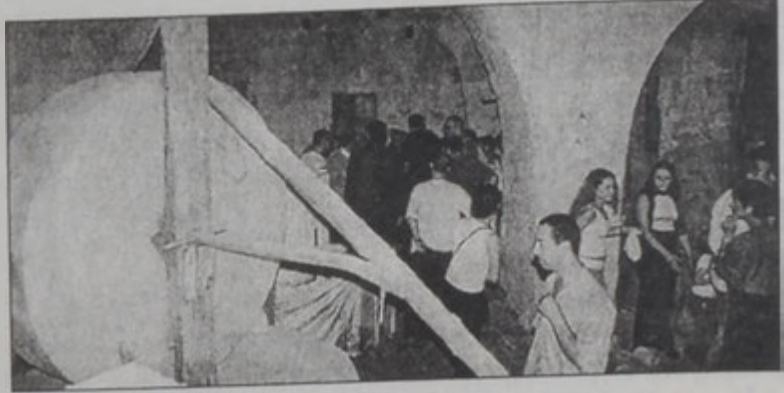
Փառատօնն անկիւն մը

Իր տեսակին մէջ իւրայատուկ փառատօն մըն է Շուէյք-ֆարի քաղաքապետութեան կողմէ կազմակերպուած «Սուք Աթիք 2002» փառատօնը, որուն բացումը տեղի ունեցաւ անցեալ շաբաթվա շրջին: Իր անուանումին հարապատ մնալով, այս փառատօնը տեղի կ'ունենայ գիւղին աւելի քան հազար տարուան հնութիւն ունեցող շուկային մէկ մասին մէջ: