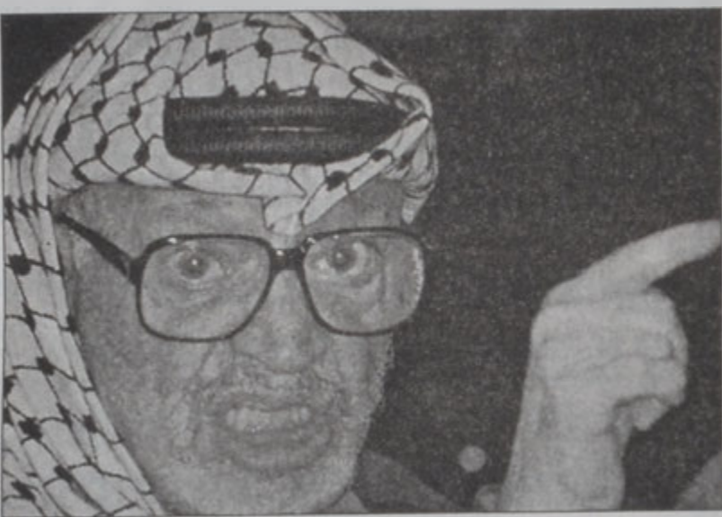
Արաֆատ իր խօսքի պահուն

Պաղեստինեան իշխանութեան նախագահ Եսաթ Արաֆատ ըսաւ, որ Իսրայէլի հետ տակաւին կարելի է խաղաղութիւն հաստատել, հակառակ երկու տարիէ ի վեր շարունակուող խռովութիւններուն ու արհմատակցութեան: Արաֆատ վերստին դատապարտեց այն գործողութիւնները, որոնք պաղեստինցի եւ իսրայէլացի քաղաքային գոհեր կը խլեն: