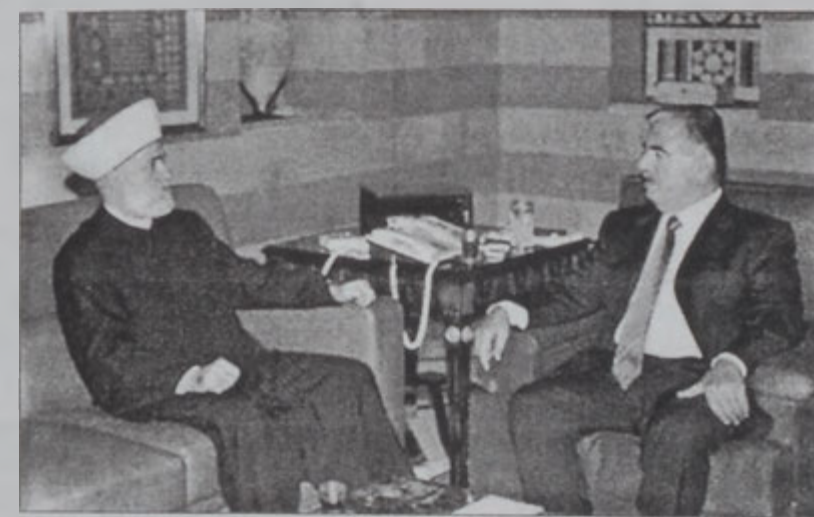
Հարիրի եւ միւլթի Զապպանի

Վարչապետ Ռաֆիք Հարիրի երկ ընդունեց հանրապետության միւլթի շէյխ Մոհամէտ Ռաշիտ Զապպանին, որ հանդիպումէն ետք յայտարարեց, թէ վարչապետին տուած իր այցելութեան նպատակն էր շնորհակալութիւն եւ երախտագիտութիւն յայտնել կառավարութեան՝ «Մոհամէտ Ամին Միութիւն» լուծելու որոշումին համար: «Այսպիսով, Մոհամէտ Ամին մկիթի կառուցման աշխատանքները աւելի արագ պիտի ընթանան եւ մեր նպատակն ալ այդ է», ըսաւ Զապպանի: