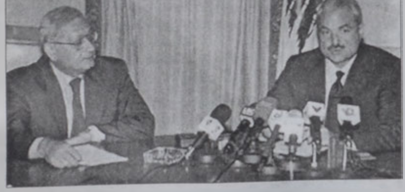
Էլիաս Մըր՝ մամլոյ ասուլիսի պահուց

Ներքին գործոց եւ քաղաքապետութեանց հարցերու նախարար Էլիաս Մըր երէկ մամլոյ ասուլիսի մը ընթացքին յայտարարեց, որ սկսած է խորհրդարանական ընտրութեանց եւ վարչական ապակեզրոնանցումի նոր օրէնքներ մշակելու աշխատանքը: Ան յոյս յայտնեց, որ այս օրէնքը արգիական ըլլայ եւ անոր հիման վրայ ընտրուի լիբանանեան խորհրդարան մը, որ աննախընթացօրէն զերծ ըլլայ համայնքային կաշկանդումներէ եւ ընտրուած ըլլայ ազգային տուեալներով: Մըր ըսաւ, որ այս օրէնքի մշակման համար ազգա-