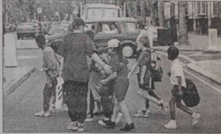
Երթեւեկի աղմուկը մնայուն անուշադրութեան աղբիւր

Բանուկ ճամբու մը մօտ՝ ապրիլ կրնայ երեխայի մը դպրոցական աշխատանքին վնասել, կ'ըսեն աստորիացի հետագոտողներ: