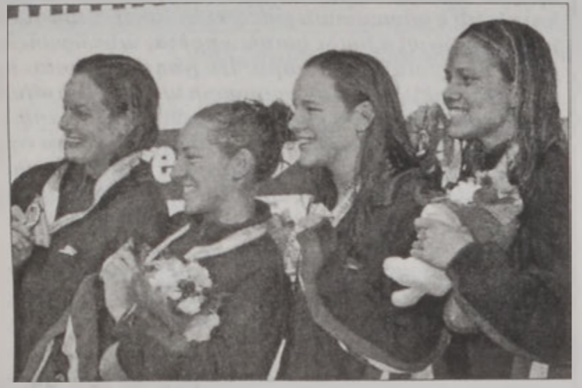
4 x 200 մետրի ոսկի մետալին տիրացած Մ. Նահանգներու խումբը

Ճափոնի Եորքհամա քաղաքին մէջ տեղի ունեցող համախաղաղական լողաշարի ախոյեանութեան հինգերորդ օրուան մրցումներուն, երէկ աստրալիացի Իան Թորփ շահեցաւ իր հինգերորդ ոսկի մետալը, երբ տղոց 100 մետր ապատ լողի մրցումներուն արձանագրեց 48՝ 84 արդիւնք մը: Արժաք մետալին տիրացաւ անոր ազգակից Էշլի Բալիս, որ արձանագրեց 49՝ 26 արդիւնք մը, իսկ պրոնկ մետալին ամերիկացի Նէյթ Տաչիսկ (49՝ 47):