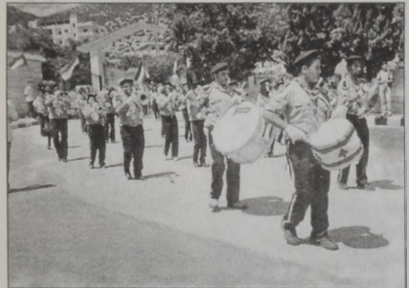
Նորդուժեամբ ժողովուրդը քալեց մինչեւ նորակառուց համալիր:

Կիրակի, 18 Օգոստոսի առաւօտեան, Քեսապի Ս. Աստուածածնի եկեղեցւոյ մէջ սկսաւ Ս. պատարագը: Քեսապի ամբողջ հայութիւնը համախմբուած է եկեղեցւոյ շրջափակը: Պատարագի աւարտին, Հ.Մ.Ը.Մ.Ի Այնճարի զոյգ շեփորախումբերու առաջ-