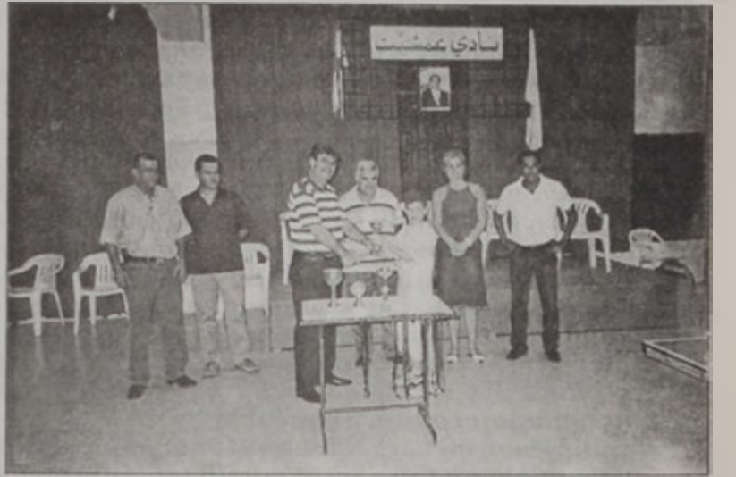
Աւստրալիացի բաժակը կը ստանայ Ամշիթ ակումբի Գալապոս Անտրէ Լահուտէ

Ամշիթի մէջ տեղի ունեցող փինկ փոնկի մրցաշարքին, 91-92ի ծնունդ դասակարգի մրցումներուն, Հ.Մ.Ը.Մ. անգամ մը եւս փաստեց, որ կը մնայ Լիբանանի լաւագոյններէն, նոյնիսկ կրտսերներու պարագային: Տիտղոսի տիրացաւ Հ.Մ.Ը.Մ.ի մարզիկ Աւստրալիացիները, որ իր կատարած երեք մրցումներուն ալ արձանագրեց երեք յաղթանակ, առանց նոյնիսկ սէթ մը զիջելով իր մրցակիցներուն: