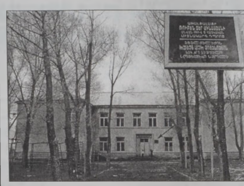
Ախալքալաքի «Ռուբէն Տէր Միգասեան» վարժարանը