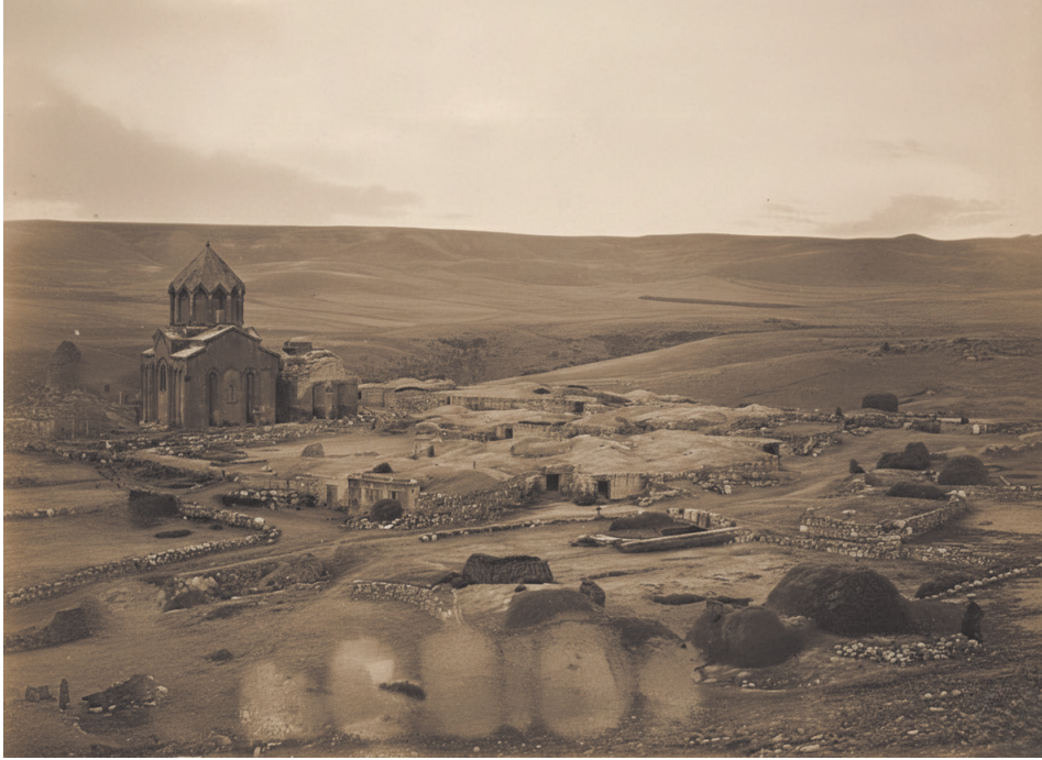
Նկ. 1. Մարմաշեն եկեղեցին և համանուն գյուղատեղին ժԹ: դարավերջից Ի. դարասկիզբ: