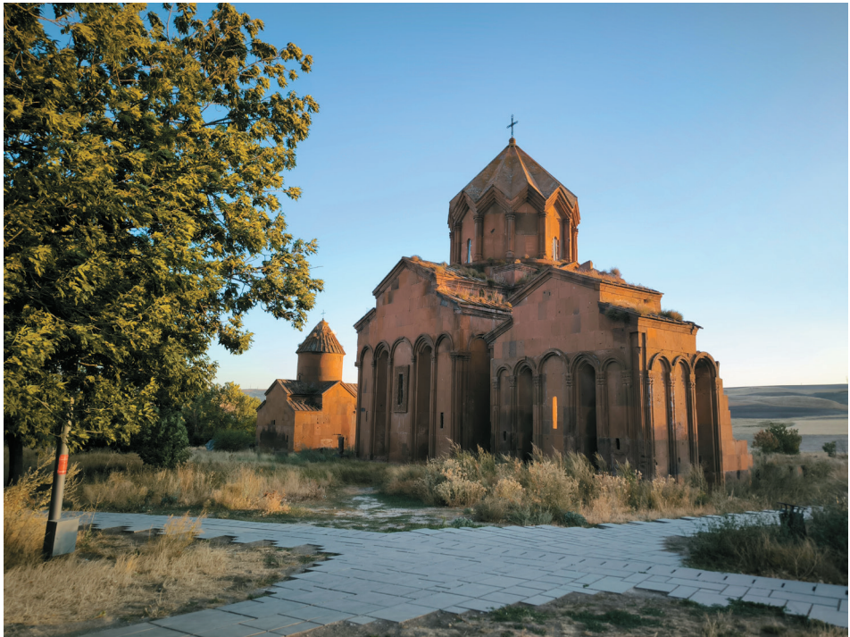
Նկ. 3. Մարմաշեն վանական համալիրը, 2023 եւ 2025 թթ. :