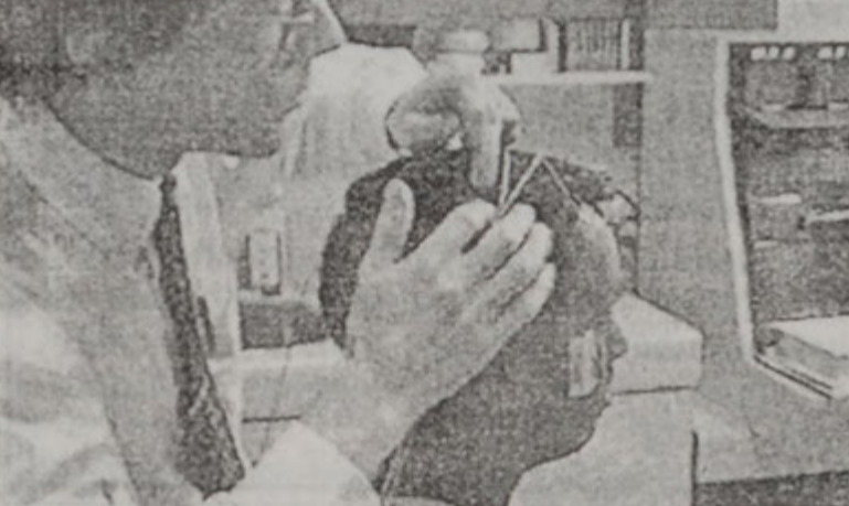
Գիտնականները կը փորձեն անցնել համալսարանի կողմից կազմակերպվող «Մարմարի» կոնգրեսին:

Սաքսոնիական ճիզը ինչպես գործընթացները, այնպես էլ կոնգրեսի արդյունքները: