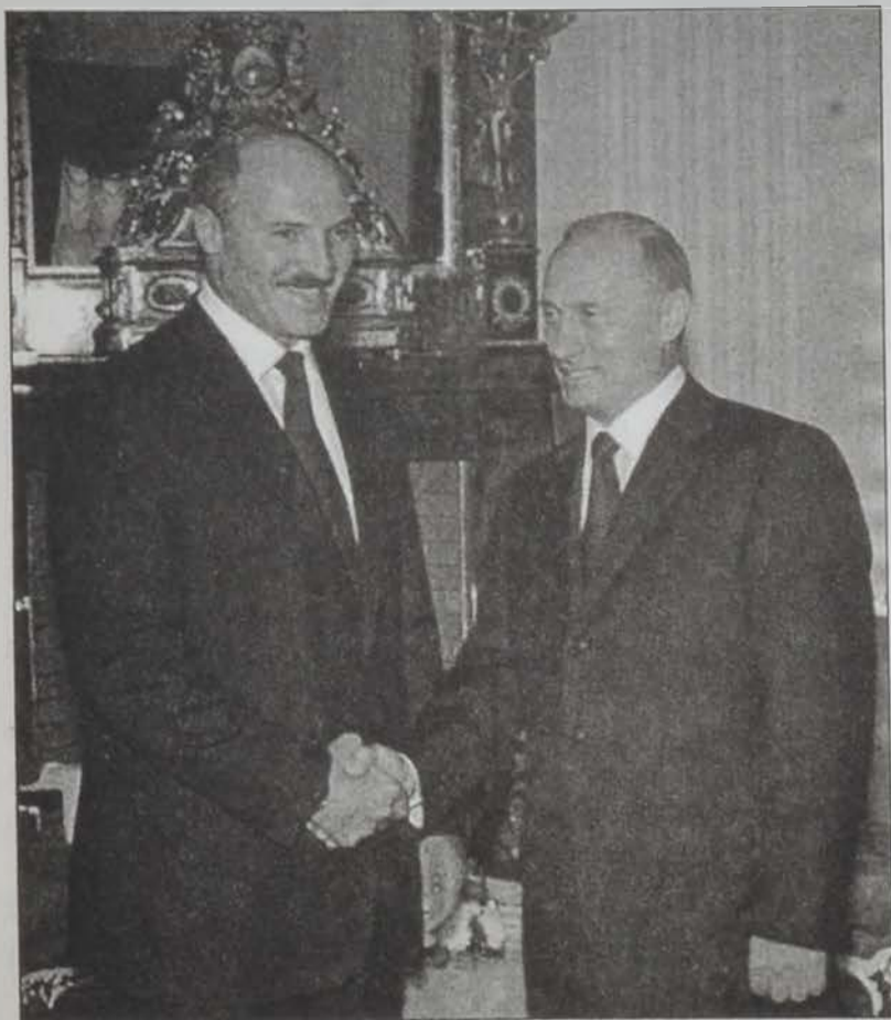
Լուրջաչենցո եւ Փուրթին

Ռուսիոյ նախագահ Վլադիմիր Փուրթին անսպասելիորէն շեշտը դրած է Պիելոուսիոյ հետ միութեան մասին, յայտնելով, որ պատրաստ է հանրաքուէ մը կայացնելու՝ մէկ պետութեան կազմելու գծով, ապա մէկ նախագահի մը համար ընտրութիւններ կատարելու: