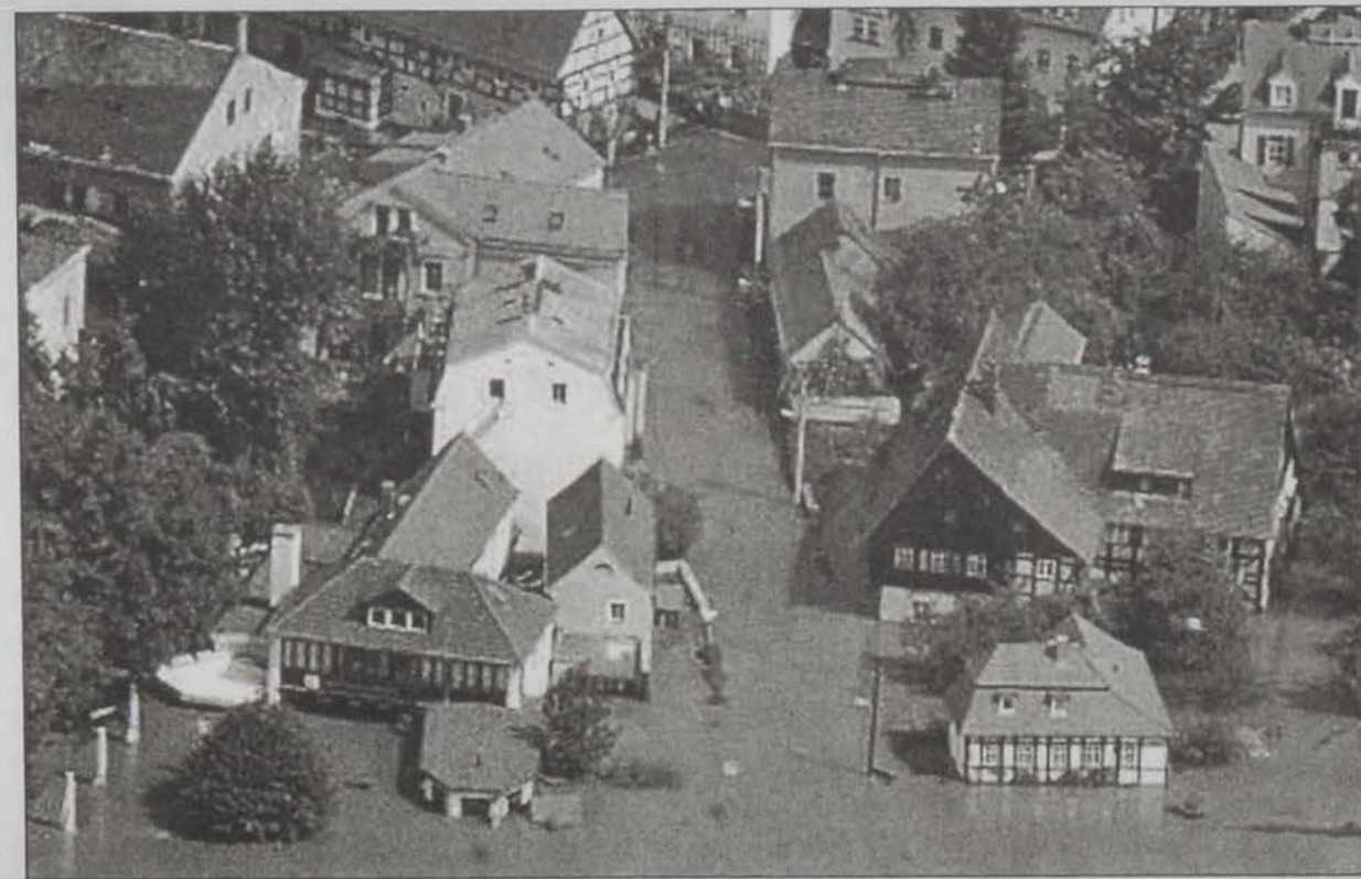
Տրեստըն՝ ջուրերու մէջ «կը լողայ»

Գերմանիոյ Ճյուրանսը եւ մշակութաբան ինչ գոհարը նկատուող Տրեստըն քաղաքը երէկ «կը պատրաստուէր» 150 տարուան իր ամենէն ծանրակշիռ ողողումներուն, մինչ Փրակայէն քաջուղ ջուրերը կը յայտնաբերէին 2-եւ իւրոյ պատմական մայրաքաղաքին արդէն իսկ հասած հսկայական վնասները: