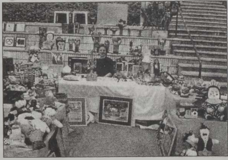
Յուցահանդէսէն անկիւն մը

Վեց տարիէ ի վեր ամէն ամառ կը կազմակերպուի «Փլէն ար տը Ֆաքրա Քլայա» չորսօրեակը, որուն ընթացքին տօնախմբութեան մթնոլորտի մէջ կը ցուցադրուին ձեռարուեստի եւ ձեռարուեստ արուեստի լիբանանեան վերջին նորութիւնները: Այս ցուցահանդէսը տարուէ տարի տեղ կու տայ նոր եւ իրաւաստուկ աշխատանքներու, ինչպէս նաեւ կը քաջալերէ երիտասարդ արուեստագէտները: