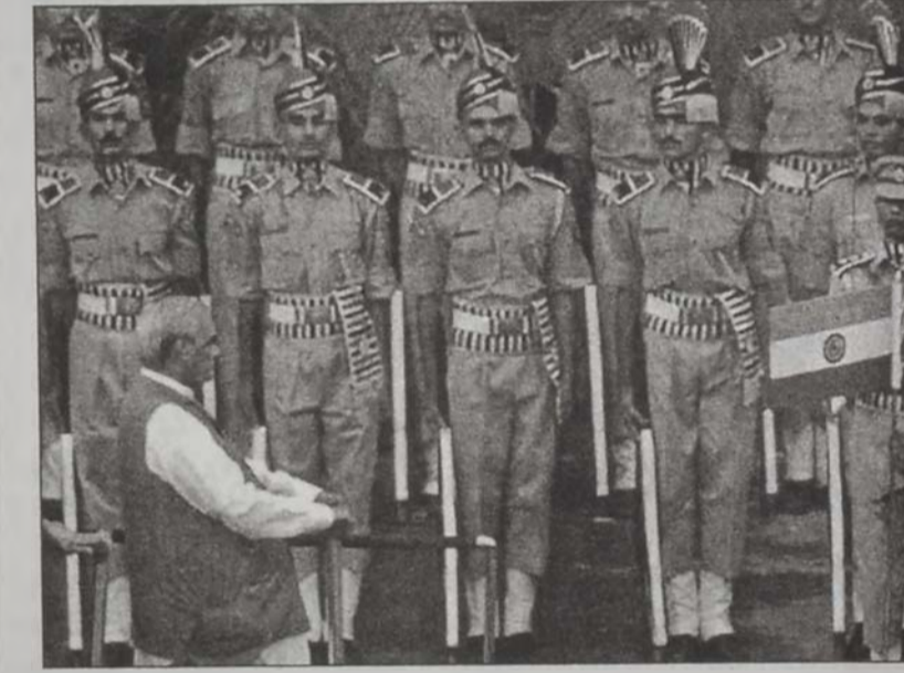
Վաճփայի՝ Գաթաբազակալ պահակազուգի հսկողութեամբ կը կատարէ իր յայտարարութիւնը

ՆԻԻ ՏԵԼԻ, 15 (ՌՈՅԹԸՐԸ).- Հնդկաստանի վարչապետ Սթալ Պեհարի Վաճփայի, Փաքիստանի դէմ չափապանց խիստ ոճով մը, չինգաթթի օր Իսլամապուր ամբաստանած է Քաշմիրի մէջ «սահմանէն անդին ահաբեկչութեան» յանցանքով: