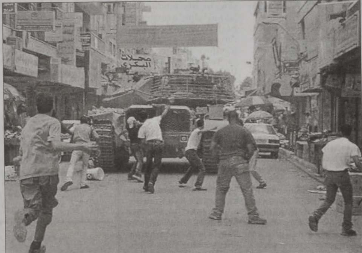
Պաղեստինցի երիտասարդներ կը քարկոծեն իսրայէլեան հրասայլ մը, որ Այսրյորդանացի փողոցներէն կ'անցնէր

Պաղեստինեան իշխանութիւնը ելեւմտական մարտի մէջ բարեկարգումներու ծրագիր մը յայտարարեց երէկ: Ելեւմուտքի նախարար Սալամ Ֆայէատ ըսաւ, որ ընկերութիւնը մը յառաջացուած է միատեղ համախմբելու եւ հսկելու պաղեստինեան իշխանութեան բոլոր հաշիւներուն: Փտածութեան դէմ որդեգրուած այս քայլը կրնայ որոշ գոհացում մը տալ Ուաշինկթընի, որ արմատական բարեկարգումներ պահանջած է պաղեստինեան իշխանութենէն: