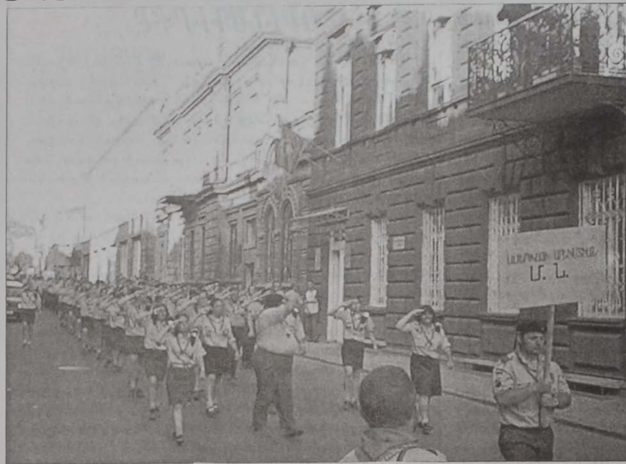
Լարուած էին՝ տողանցքին ներկայ գտնուելու եւ դիտելու Հ.Մ.Ը.Մ.ականներու կշռութաւոր տողանցքը:

Յետմիջօրէին Հ.Մ.Ը.Մ.ի 550 սկաւտները հանդիսարարու տպաւորիչ կերպով տողանցեցին Երեւանի փողոցներուն մէջ՝ մշակոյթի նախարարութեան շէնքէն մինչեւ հանրապետութեան հրապարակ, ուր հնչեցուցին «Մեր Հայրենիք», «Յառաջ Նահատակ» եւ «Ով Հայ Արի» քայլերգները: Տողանցքը տեղի ունեցաւ մեծ շուրջով, հապարաւոր քաղաքացիներ հա-