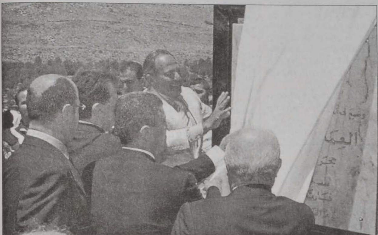
Նախագահը կը կատարէ ջրամբարի հիմնարկէքը

Հանրապետութեան նախագահ Կօր. Էմիլ Լահուտ Շաքաթ օր հիմնարկէքը կատարեց Շապրուհի ջրամբարին, որուն կառուցման ծրագիրի գործադրութիւնը Քեարուան կը սպասէ 45 տարիէ ի վեր: