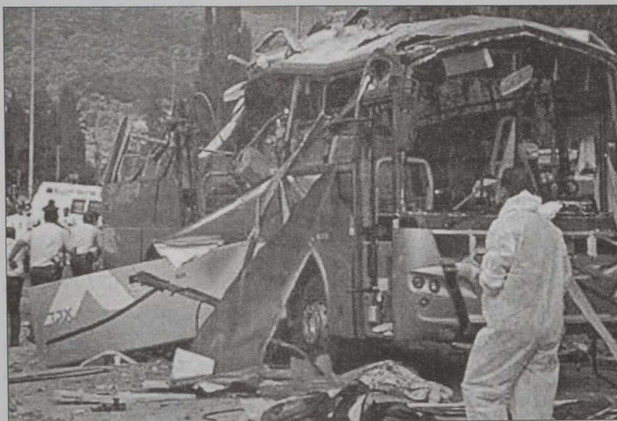
Պայթած օթոպիւսին «մնացորդաց»ը

Անձնասպանական գործողութիւնը կատարուեցաւ Քալքիլի մէջ: Օթոպիւսը լեցուն էր իսրայէլացի քաղաքայիններով եւ պինդորներով, որոնք արձակուրդէն կը վերադառնային Կօրանց: Գործողութենէն