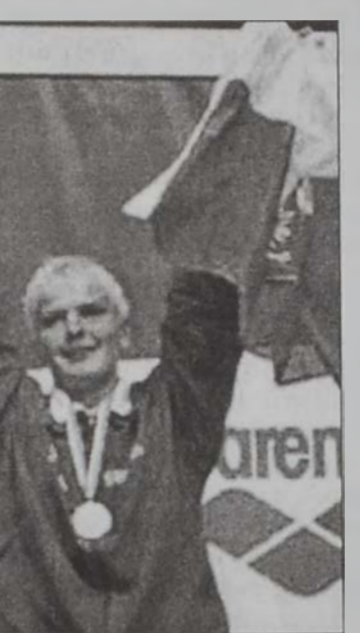
Օթիլիա ժեռը ժեռը

3.- Նիքոլայ Ռոստո-շէ (Ֆրանսա) 4՝ 19՝՝ 19