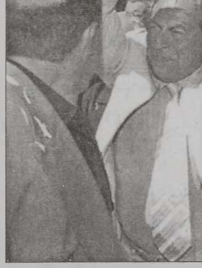
Նախագահը կ'ողջունէ Աշքուի ժողովուրդը, որ ջերմօրէն կը դիմաորէ զինք

Շապրուհի ջրամբարը մէկ հանգրուանն է րուն մէջ»: