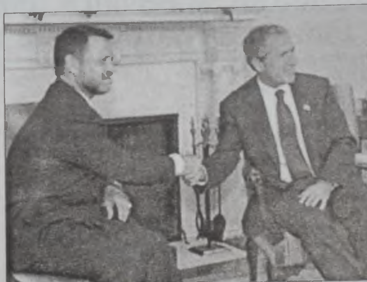
Պուշ եւ Ապտալա Սպիտակ Տան մէջ

Միացեալ Նահանգներու նախագահ Չորժ Պուշ երէկ յայտնեց, թէ «զայրացած է» ամերիկացի 5 ուսանողներուն սպանութեան համար. անոնք զոհ գացած էին Երուսաղէմի Երրայական համալսարանի պայթուածին, նախնացեալ օր, որ խլած էր եթեր զոհ եւ շուրջ 100 վիրաւոր: Այսուհետեւ կ'ընդհատուի Պուշի կողմէն Արեւելքի խաղաղութեան գործընթացը փոխել: Պուշ այս յայտարարութիւնը կատարեց երէկ Սպիտակ Տան մէջ, նախքան Յորդանանի Ապտալա թագաւորին հետ իր տեսակցութիւնը: Անոնք քննարկեցին միջինարեւելեան թղթածրարին կապուած հարցեր: