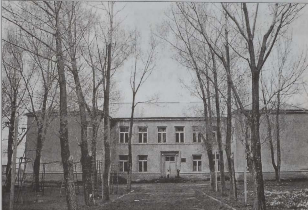
Ախալքալաքի Ռուբէն Տէր Սիմաեանի անուան թիւ 5 հայկական միջնակարգ դպրոցը

զային շահերին վնասելու: Սակայն, ցաւօք, պէտք է շեշտել, որ այսօրուան պետական քաղաքական կամ մեծապետական կամ մեծապետական գործունէութեան հարկերը ներքին շահերին վնասելու նպատակով չեն ձեռնարկուել: Երկրի վարչատարածքային կառուցուածքը սահմանադրորէն յստակեցուած է: Պետութեան տարածքը նախագահի հրամանագրով բաժանուած է շրջաններով, սահմանուել է նախագահի լիազօրների համակարգը, ինչը եւս երկրի սահմանադրութեամբ ամրագրուած է: Եւսակառուած է տեղական ինքնակառավարման եւրոպական համաձայնագրի սկզբունքներին, քանի որ այդ լի-