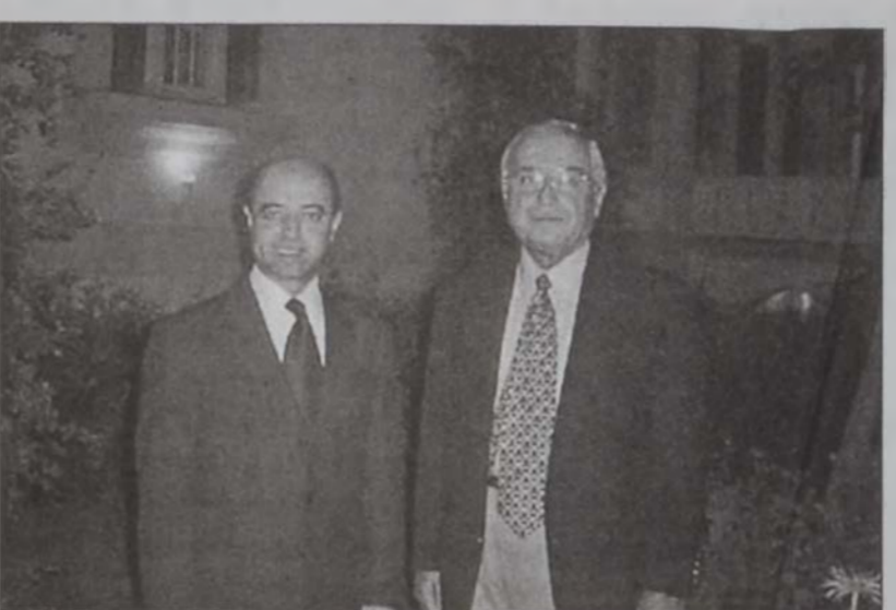
Համալսարանի Գախիկն եւ Գոր Գախազարեան

Հայկազեան Համալսարանի Շրջանաւարտից Միութեան կազմակերպութեամբ՝ երէկ, Երեքշաբթի, 30 Յուլիսի երեկոյեան ժամը 7:30ին, Հայկազեան Համալսարանի «Մուկար» պարտէզին մէջ, տեղի ունեցաւ ընդունելութիւն մը՝ առիտ երախտագիրութիւն համալսարանի նախկին տնօրէն վեր. Ժան Նանճեանի եւ իրրեւ բարի գալուստ նորանշանակ տնօրէն վեր. Փօլ Հայտոսթեանի: