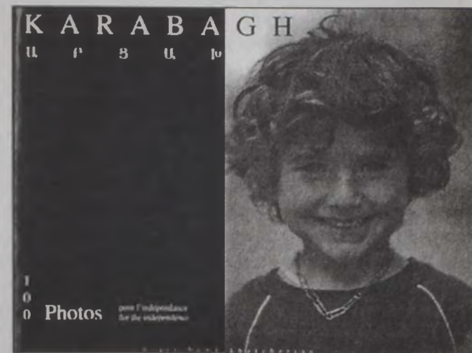
«Արցախ. 100 լուսանկարներ» (լուսանկարչական գիրքը Պէյրութի մէջ կը վաճառուի Լամազազայինի գրախանութիւնում) «Շաղաղան» կեդրոն:

Բնութեան հզոր տեսարաններ գեղանկարչական խորհրդանշական պատասխաններու տպաւորութիւնը կ'առնեն: «Պատերազմի եւ