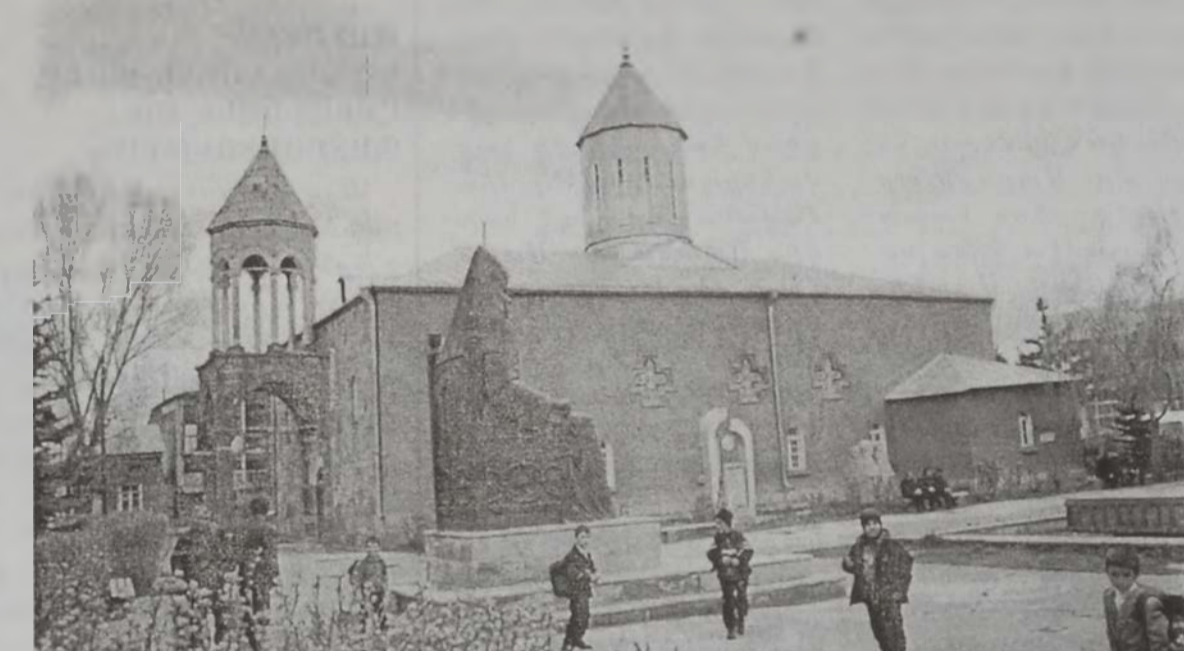
Ախալքալաքի Ս. Խաչ եկեղեցին

Առաւօտեան խումբը թարմացած է ու պատրաստ՝ դէպի Թմկաբերդ արշաւի: Երգ ու աղօթք, պար ու ցնծում: Ախալքալաքի երիտասարդաց Միութեան անդամները, անհատ ուխտաւորներ միացած են, ու կարաւան ճամբար կ'ելլէ Ախալցխայի ուղղութեամբ: Ժամանակ մը յետոյ՝ հաճելի անակնկալ մը: Հեքիաթի բերդի նման բերդ