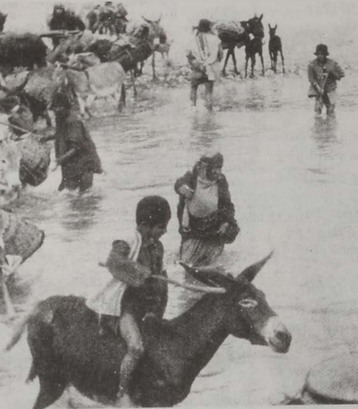
Չարմաշալ գարնան ձիւնհալից: Լեռներէն հոսող սառն ջուրերը կտրելով պախթիարներ արօտավայրեր կը բարձրանան

Չարմաշալի հայկական գիւղերուն վրայ ցե- ղախումբերուն յարձակումները սաստկացան, երբ աֆղաններ 1722ին Պարսկաստան ներխու- ժելով դրակեցին Սպահանը եւ աւերածութեան ու անիշխանութեան մատնեցին երկիրը: Ստեղծուած կացութեան օգտուելով՝ աւագա- կախութեամբ աւելի սանձարձակ թալանի ու աւարառութեան ձեռնարկեցին հայկական գիւղերուն ղէմ: Այդ օրերուն եւս Հարախան-