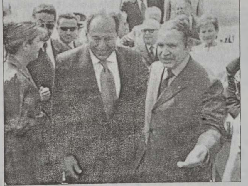
Պուրաֆիլիքա կը դիմաւորէ Կոր. Լահուտը

Նախագահ Կոր. Էմիլ Լահուտ երէկ Ալճերիոյ նախագահ Ապտէլ Ապիպ Պուրաֆիլիքայի հրաւերին ընդառաջելով երկօրեայ պաշտօնական այցելութեան մը համար մեկնեցաւ Ալճի։ Այս այցելութեան ընթացքին պիտի ստորագրուին երկու համաձայնագիրներ. առաջինը կը վերաբերի երկու երկիրներու արտաքին գործոց նախարարութիւններուն միջեւ գործակցութեան, խորհրդակցութեան եւ համակարգումին, իսկ երկրորդը՝ լիբանանեւալճերիական միացեալ յանձնախումբին կազմութեան։ Նախագահ Լահուտ իր այցելութեան ընթացքին պաշտօնակիցին պիտի ներկայացնէ արդիւնքները այն հարցերու վերաբերեալ, զորոնք վերաբան Լիվանի նստաշրջանի նախագահի հանգամանքով ունեցած է արաբական եւ միջազգային կողմերու հետ։ Նախագահ Լահուտի ընկերակցող պատկերակցութեան մաս կը կազմեն տիկին Սուրէի Լահուտ, փոխ վարչապետ Իսամ Ֆարէս, արտաքին գործոց նախարար Մահմուտ Համուտ, Ալճերիոյ մէջ Լիբանանի դեսպան Ահմէտ Ապտալլա, մամլոյ եւ