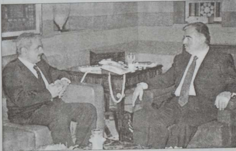
Վարչապետ Հարիրի կ'ընդունի Գալաթար Սըրը

Վարչապետ Հարիրի երէկ ընդունեց հին տասներեք անդամ վատուիրակութիւնը, գլխաւորութեամբ ժողով Ռաֆիք Հարիրիի, որ հանդիպումէն ետք յայտնեց, որ ներկայացուցած են իրենց պահանջներուն մասին յուշագիր մը, որովհետեւ ինչպէս պիտի ապրի կայուն առեւտրային եւ անշարժ գոյքին հասոյթէն: