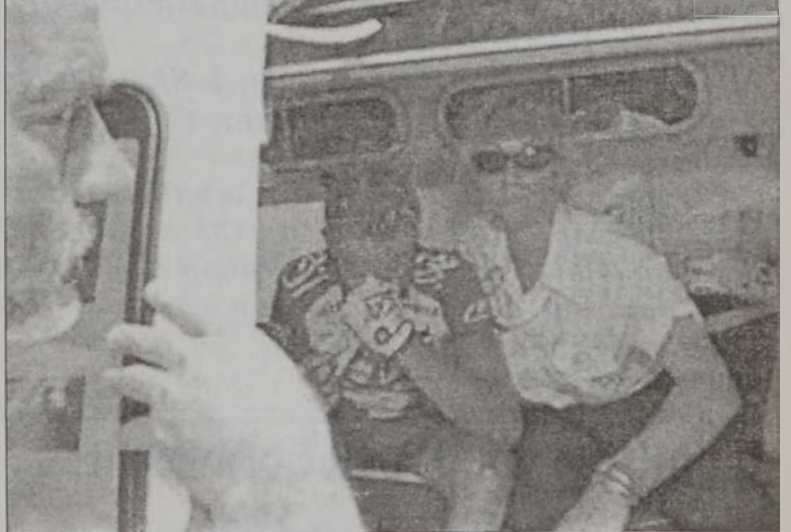
Բրիսթօ Մորո, որ բժշկական յատուկ վէճի մը մէջ, կու լայ, շրջավայրը կիսատ ձգելուն համար