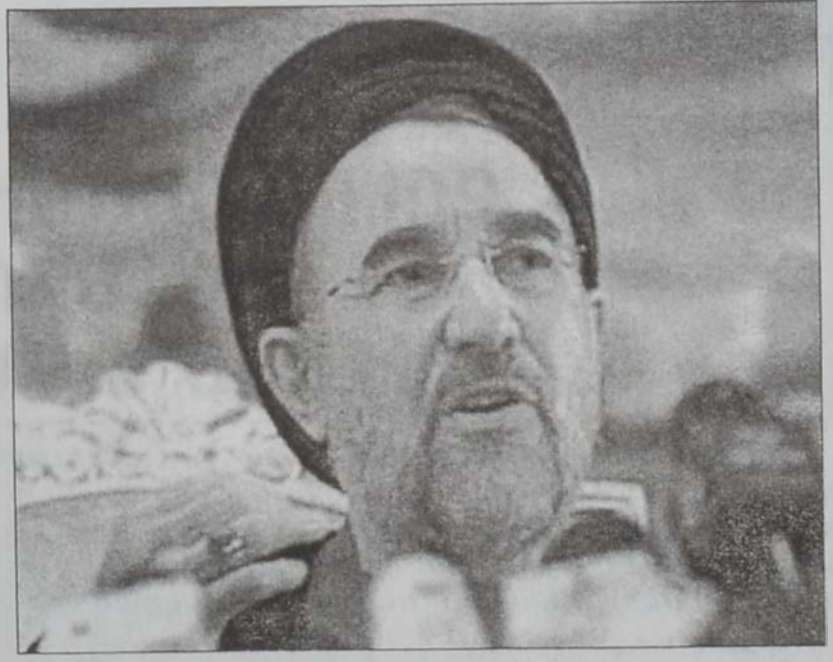
Խաթեմի դասախօսութեան ընթացքին

Իրանի նախագահ Մոհամէտ Խաթեմի Միացեալ Նահանգները կ'ըսէ, որ իր անձնական ճանապարհորդութեան ընթացքին Խաթեմի կողմէ արգելափակումներու միջամտիս ըլլալէ, եւ ըսաւ, որ նման վերաբերում պատերազմի մը հաւանականութիւնը կը բարձրացնէ: