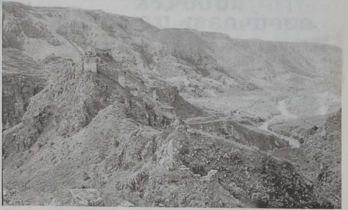
Թմկաբերդը այսօր: Կիրճին մէջ կը հոսի Կուր գետը:

Ընթրիքի աւարտին խօսք առի, ողջունեցի Բարգէն հայր սուրբն ու հոգեւոր հայրերը, ներկայ ուխտաւորները եւ պատմեցի, թէ ինչպէս 1700ամեակի ուխտագնացութեանց ծրագիրի մէջ անկատար մնացած յայտագիրը մըն էր, որ այս ուխտագնացութեամբ կ'իրագործուէր: Եւ պատմեցի, թէ