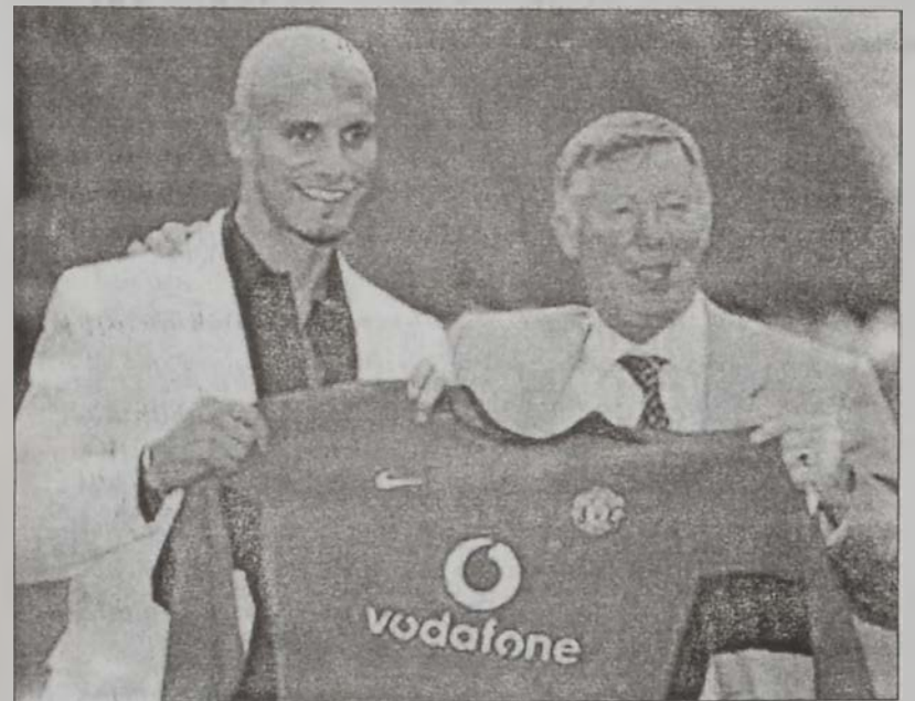
Ռիօ Ֆերտինանտ իր Գոր մարզիչի՝ Ալեքս Ֆերկլըստըի հետ

Շարքաակիրներն, Լիծէն Մանչեսթըր Եունայթըտի փոխանցումը անգլիացի յետսպահի Ռիօ Ֆերտինանտ ոչ միայն դարձաւ Բրիտանիոյ ֆուտբոլի պատմութեան մէջ ամենէն սուղ մարզիչը, այլ՝ աշխարհի ամենէն սուղ յետսպահի: