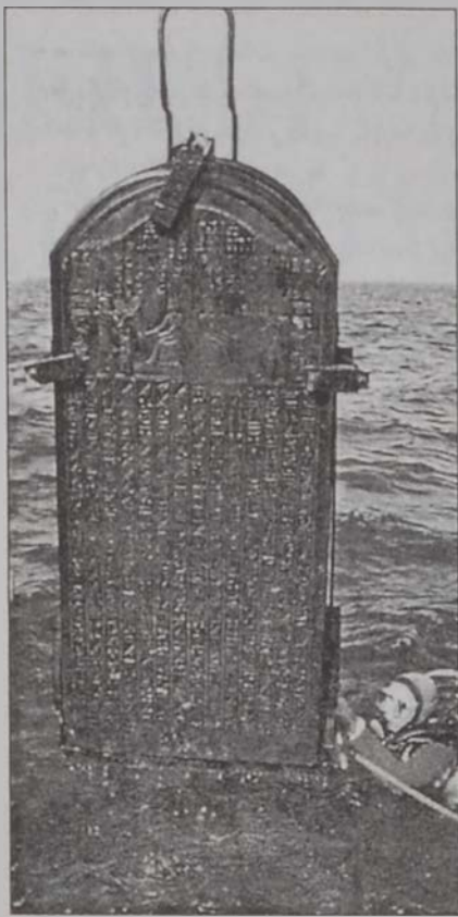
Մղոնաքարի մը յայտնաբերումը հաստատեց ֆրանսացի հնայնագիտական Կոտիոյ այն կասկածը, թէ յայտնաբերած էր հնադարեան Եգիպտոսի Սիւզըն Հենրիքսը:

Կոտիո 1980ական տարիներուն կը հետազոտէր խորտակուած նաւեր, որոնց շարքին էր չինական նաւ մը եւ սպանական Սան Տիեկո ցուկանաւը, որոնք ընկղ-