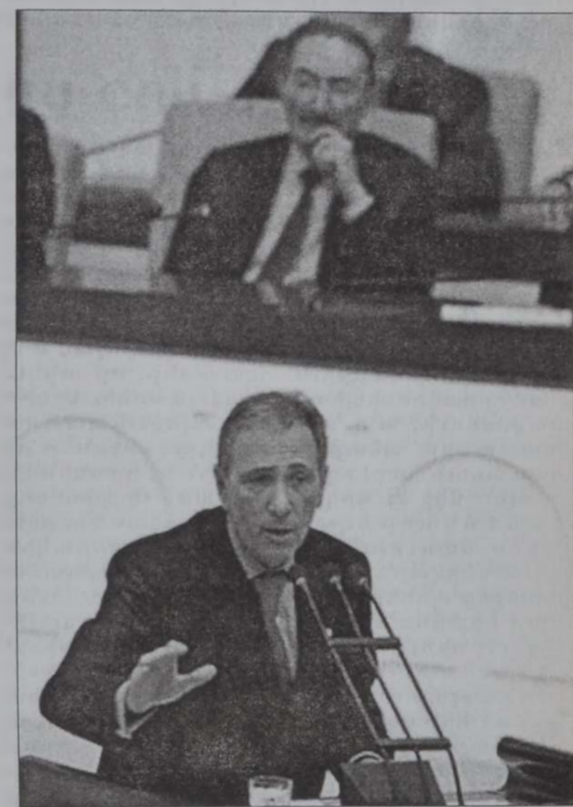
Ճէմ իր խօսքին պահուց խորհրդարանին մէջ, մինչ՝ Եճեթ կ'ունկնդրէ

Տերվիշ առաջօտեան տեսակցութիւն մը ունեցած է Դրամական Մի-