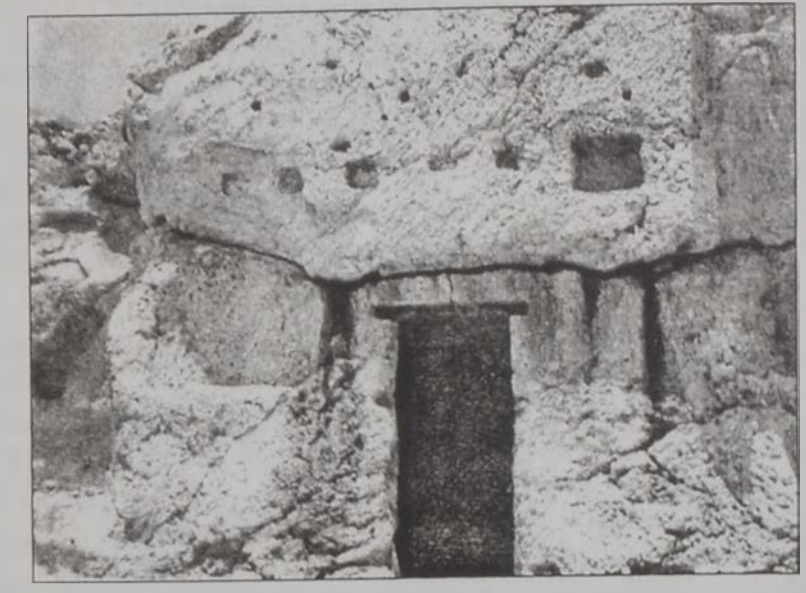
ԸՆՖԷՆ հարուստ է ժայռափոր նման բնակարաններով

Լիբանանեան ծովափերին վրայ ծուարած է թրիփոյիէն միայն 15 քիլոմէթր հարաւ գտնուող իւրայատուկ գիւղ մըն է Ընֆէն, որ իրեն յատուկ դիմագիծ տուող բազմաթիւ յատկանիշներու կողքին կրնայ հարուստնալ իբրեւ Միջերկրականի արեւելեան ափին գտնուող միակ գիւղը, որուն բազմաթիւ հին կառոյցները փորձած են իր ժայռոտ բլուրներուն մէջ: Ժայռափոր եւ մաշած բերդ մը, եօթը փոքրիկ հնամենի եկեղեցիներ եւ նեղ միջանցքներ Ընֆէն կը վերածեն իբրեւ նախնայն այն գիւղերէն մէկուն, որ տարբեր աշխարհներու տարօրինակ համադրութեամբ կը ներկայանայ այցելուին: