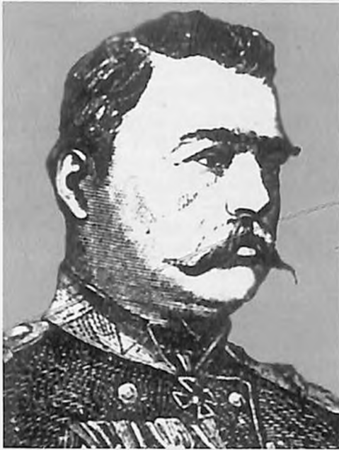
Կովկասյան ճակատի Երևանյան ջոկատի հրամանատար գեներալ-լեյտենանտ Արզաս Տեր-Ղուկասովը: