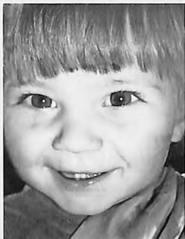
Արսեն Սամսոնի Տեր-Պողոսյանի՝ ԱՐՍԵՆ Բ-ի բողբ՝ երեքամյա ԱՐՍԵՆ Գ-ն