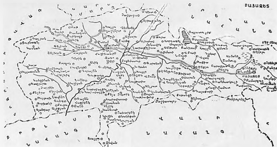
Բայազեղի գավառի քարտեզը: