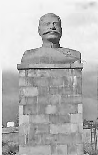
Խենքի կիսանդրին Արագյուղում

1840-1884 թվականներին Արագյուղի այս եկեղեցում քահանայություն է արել Տեր Հովհաննեսի որդի Տեր Պողոսը՝ Պողոսյանների գերդաստանի անվանադիրը: