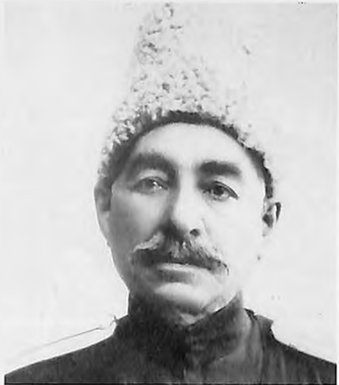
Սամսոն Տեր-Պողոսյանը՝ ՍԱՄՍՈՆ Ա-Ն՝ Խենթը