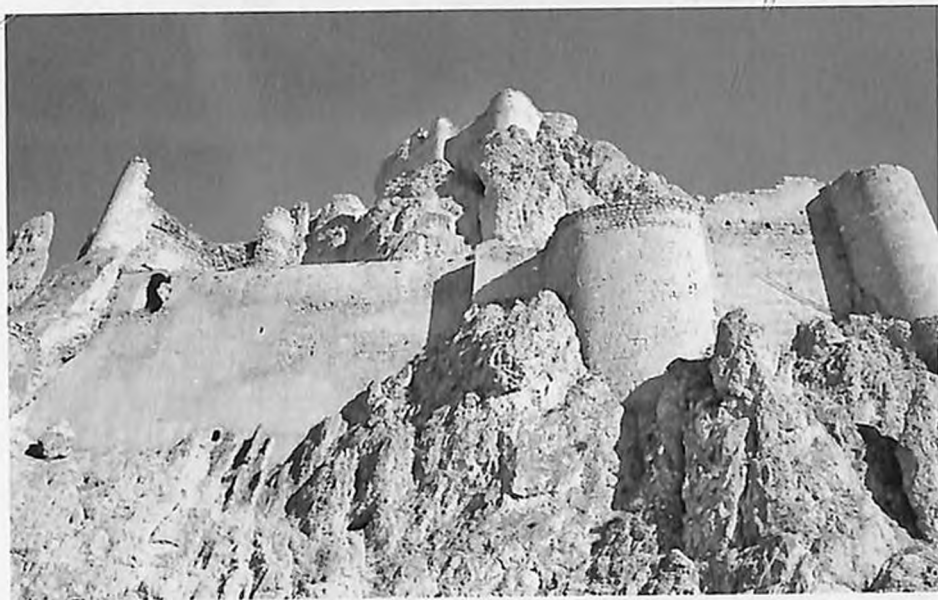
Բայազեղի պարսպապատը, որից իջել է Սամսոնը՝ իսկնրը: