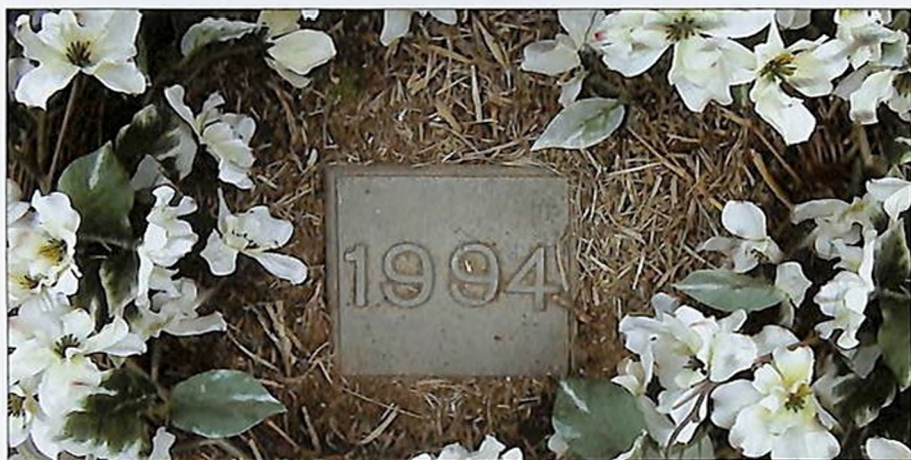
Ավրորայի վերջին հանգրվանը Լոս Անջելեսի «County cemetary» գերեզմանատանը. թվակիր մետաղյա ցուցանակը դրված է 1994 թվականի մահացած 2200 անհայր և անգերեզման աճյունների ամփոփման վայրում