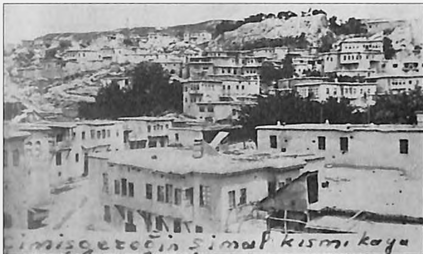
Չմշկածագ գյուղի Ագրակ և Շիփոր թաղերը (Արևմտյան Հայաստան)