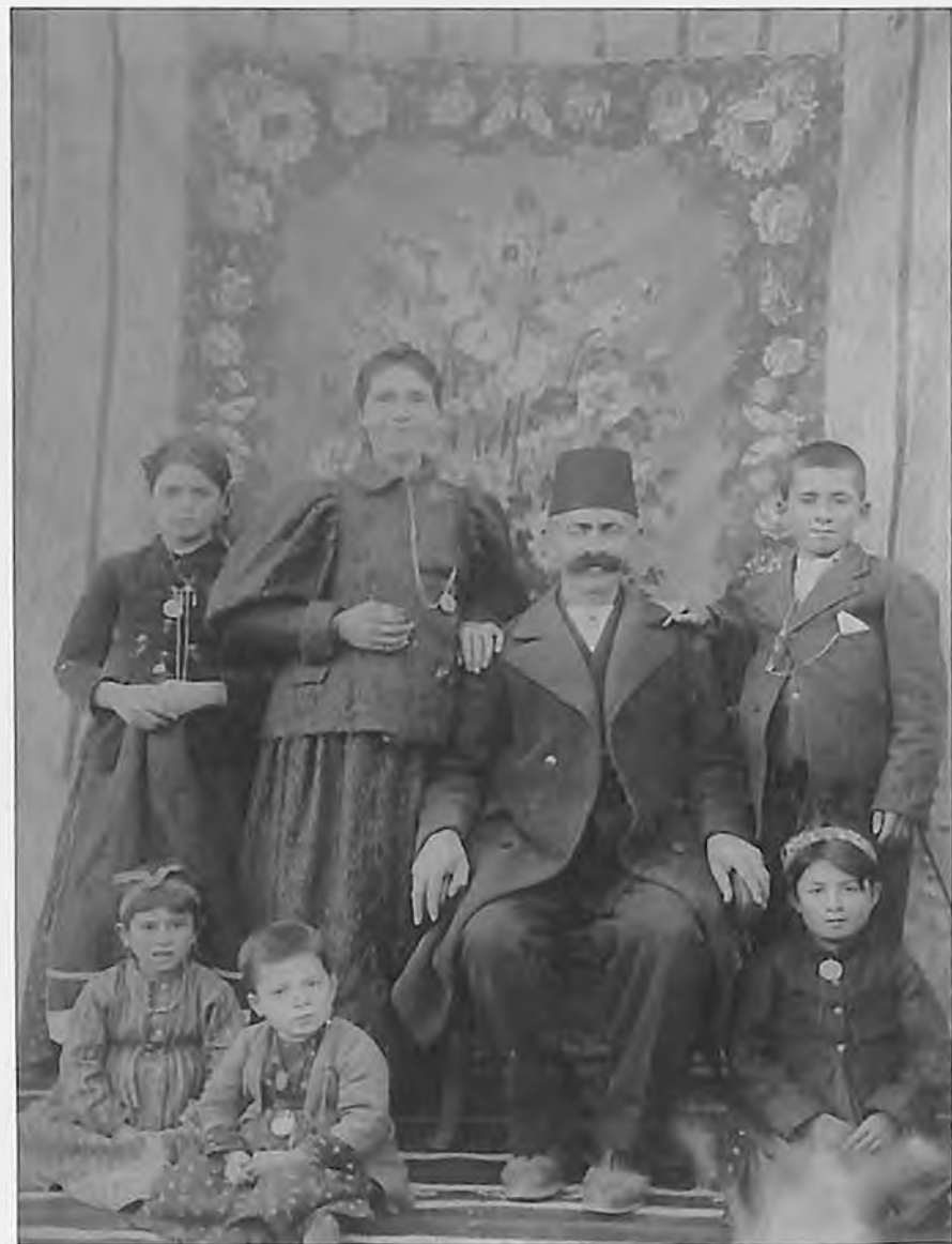
Մարտիրոսյանների ընտանիքը՝ լուսանկարված 1906 թ. Չմշկածագում (Արևմտյան Հայաստան)