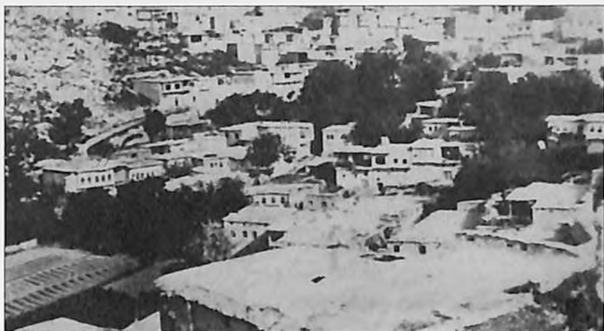
Չմշկածագ գյուղի Չուխտոր թաղը (Արևմտյան Հայաստան)