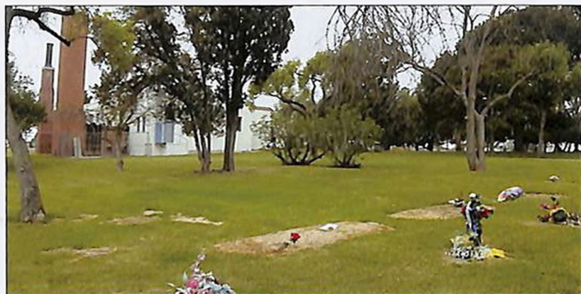
Լոս Անջելեսի «County cemetary» գերեզմանատունը, որտեղ ամփոփված է Ավրորա Մարդիգանյանի աճյունը