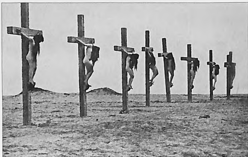
Խաչելության րևսարանը «Հոշորված Հայասրան» ֆիլմից