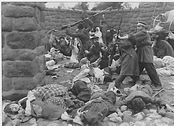
Կորորածի րևսարան «Հոշորված Հայասրան» ֆիլմի անհերացած հարվածից