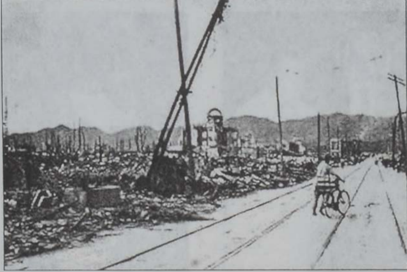
Ճափոնական 66 քաղաքներ ամբողջովին կործանեցան կորիզային առաջին ռումբեր

Հիմա, որ ԱՖղանիստանի մէջ ամերիկեան ուժաւորումներուն գոհ գացած անմեղ քաղաքացիներուն թիւը հաւասարած է Սեպտեմբեր 11ի զոհերուն թիւին, հաւանաբար կրնանք արդէն երկու դէպքերը աւելի լայն, բայց ոչ աւելի նուազ ողբերգական պարունակի մէջ դնել եւ դիմագրաւել նոր հարցում մը. արդեօ՞ք աւելի մեծ չարագործութիւն է կամ աւելի այգանելի է դիտմամբ սպաննելը, քան՝ կանոնաւոր ձեռով կոլորօրէն սպաննելը: (Կանոնաւոր ձեռով կ'ըսեմ, որովհետեւ զինեալ միջամտութիւններ կատարելու ամերիկեան ռազմավարութիւնը սկիզբ առաւ Մոցի պատերազմին): Ես չեմ կրնամ այս հարցին պատասխանը գետնի վրայ, ամերիկեան «Պի - 52»-ներուն արձակած ռումբերուն եւ Մէնհէթընի «Չըրչ Սթրիթ»էն բարձրացող հեղձուցիչ ծուխին միջեւ հաւանաբար բարոյագիտական դատողութիւններ կարելի չէ համեմատել: