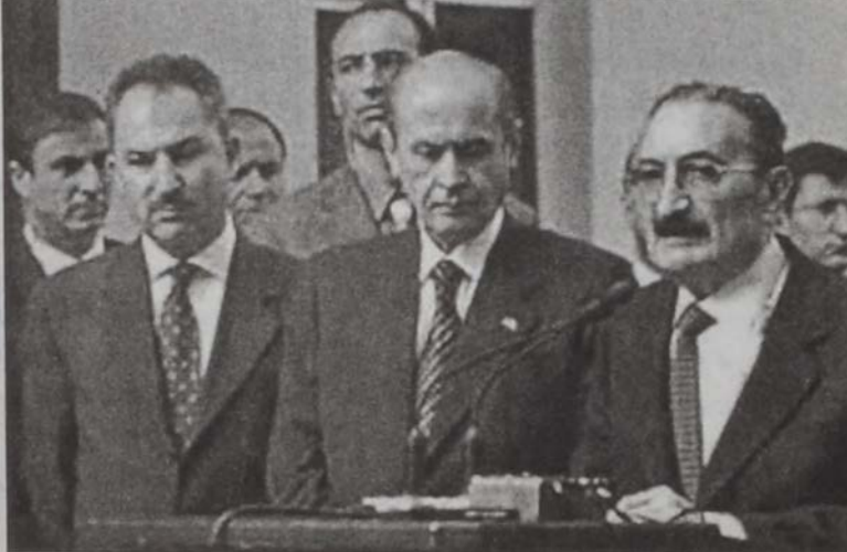
Երկու փոխ վարչապետները՝ Օքթան (ձախից) եւ Պահչելի (կերորոն), վարչապետ Էճելիթի կողքին՝ մամլոյ սաուլիսի պահուց

ԻՐԱՆԵԱՆ ՊԱՏՈՒԻՐԱԿՈՒԹԻՒՆ ՄԸ Կ'ԱՅՅԵԼԵ ՀԱՅԱՍՏԱՆ Եւրոպայ այցելութեան մը համար երէկ Երեւան հասաւ իրանեան պատուիրակութիւն մը, գլխաւորութեամբ Իրանի ուժանիւթի նախարար Հայպի Պիթարաֆի: Այցելութեան ընթացքին իրանեան պատուիրակութիւնը Հայկական կողմին հետ պիտի քննարկէ երկու երկիրներու ուժանիւթի ոլորտներու գործակցութեան խնդիրներն ու հեռանկարները: Իրանի ուժանիւթի նախարարի գլխաւորած պատուիրակութեան այցելութեան նպատակն է առաջին հերթին քննարկել «Ուժանիւթի ոլորտի գործակցութեան» մասին համաձայնագրի իրագործման ընթացքը: Նշեալ համաձայնագիրը ստորագրուած էր անցիկ տարի՝ Հայաստանի նախագահ Ռոպէրթ Քոչարեանի իրան կատարած այցելութեան ընթացքին: Կողմերը նաեւ պիտի քննարկեն նոյն բնագաւառէն ներս հայ - իրանական միացեալ ծրագրերու առնչուող բազմաթիւ հարցեր: