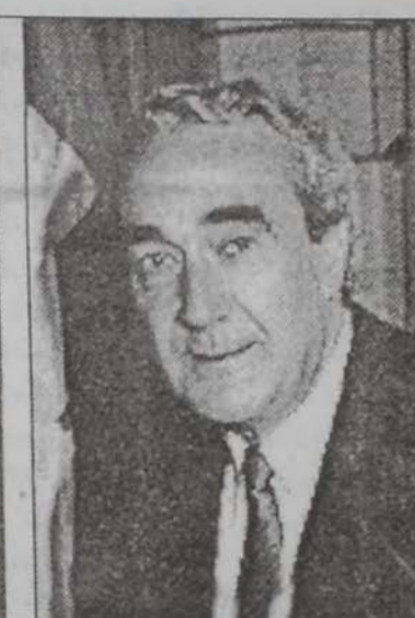
Բանաձեւին յաջողութեան մէջ դերակատար ծերակուտակաճներ՝ Սթլաքուի, Սաիտո, Անտորշաք, Սթանքըն եւ Փրիտոնո

Քանատայի Ծերակոյտին կողմէ Հայկական Ցեղասպանութեան 13 Յունիսի ճանաչումի որոշումը կը շարունակէ իր արձագանքները գտնել մամուլին մէջ: Քանատայի մեր պաշտօնակից «Հորիզոն»-ը իր վերջին թիւին մէջ կ'անդրադարձնայ որոշումին նախապատրաստութեան եւ քուէարկութեան վերջին պահուն կատարուած աշխատանքներուն: «Հորիզոն» կը նշէ, որ բանաձեւին քուէարկութիւնը նախատեսուած էր Ծերակոյտի 11 Յունիսի