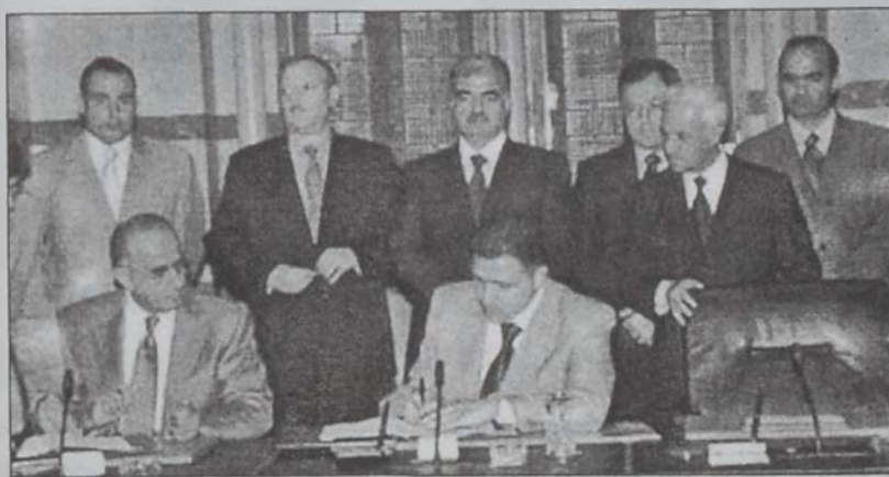
Կը ստորագրուի համաձայնագիրը

Վարչապետ Ռաֆիք Հարիրի երկվ յաջորդաբար ընդունեց ճարտարաբաններու եւ պաշտպանութեան եւ ներքին գործոց նախարարներ Ժորժ Աֆրամը, Խալիլ Հըրաուիին եւ Էլիաս Մըրը, եւ անոնց հետ քննարկեց տուեալ նախարարութիւններուն աշխատանքներն ու հարցերը: