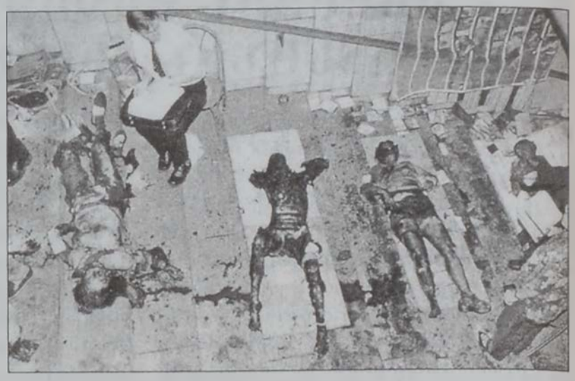
Չեչէն անմեղ զոհեր դիագնոստիկ սր մէջ:

Շարք մը նոր ցուցանիշներ կը ձգեն այն տպաւորութիւնը, թէ ժամանակը հասած է Չեչենիոյ պատերազմին քաղաքական լուծում մը գտնելու: Հանրաքուէներ կատարող ռուսական յարգուած ընկերութեան մը համաձայն, ռուսերուն 62 առ հարիւրը համամիտ է չեչէն յեղափոխականներուն հետ բանկցութիւններ վարելու գաղափարին: Այս մէկը կարելի է կեցուածքի բացայայտ փոփոխութիւն նկատել, տրուած ըլլալով, որ տակաւին 22 տարի առաջ ռուսերուն 22 առ հարիւրը միայն բանակցութիւններու թեր կարծիք յայտնած էր, մինչ 72 առ հարիւրը պատերազմի շարունակութեան գաղափարին կողմէն էր: Մինչ այդ ռուսական օրաթերթ մը կը տեղեկացնէ, թէ Չեչենիոյ համար, ամերիկեան խաղաղութեան յանձնաժողովի հովանաւորութեամբ, անցեալ ամառ Արեւմտեան Եւրոպայի մէջ գաղտնի ժողով մը տեղի ունեցած է ռուսական Տուսլայի անդամներու եւ չեչէն յեղափոխութեան ղեկավարներուն միջեւ: Ժողովին ընթացքին քննարկուած են համարձակութեան լուծման ձեւերը: