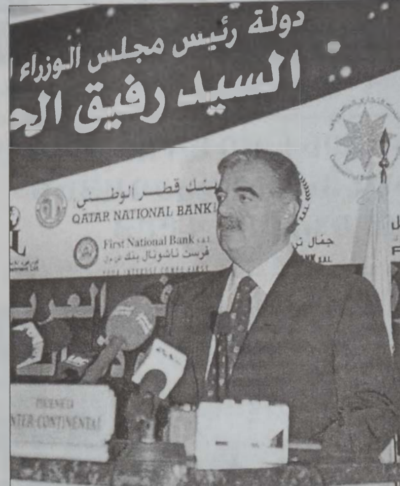
Հարիրի իր խօսքի պահուն

տարեկիք եւ պատասխանատու է բազմաթիւ հարցերու լուծման»: Միւս կողմէ, վարչապետ Ռաֆիք Հարիրի նախագահ Կոր. Էմիլ Լահուտի հետ հեռաձայնային հարցազրուիչութեան մը ընթացքին յայտնեց