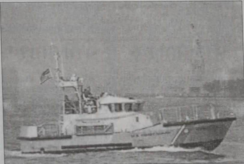
Եզերապահ Գաւ մը կը հսկէ Ազատութեան արձանին դիմաց

Մինչ Մ. Նահանգներ այսօր կը պատրաստուին անկախութեան տօնը նշելու, իշխանութիւնները ապահովական խիստ միջոցառումներու դիմած են՝ կանխարգիլելու համար սիւրբերկանական բնութիւն ունեցող զէպ: