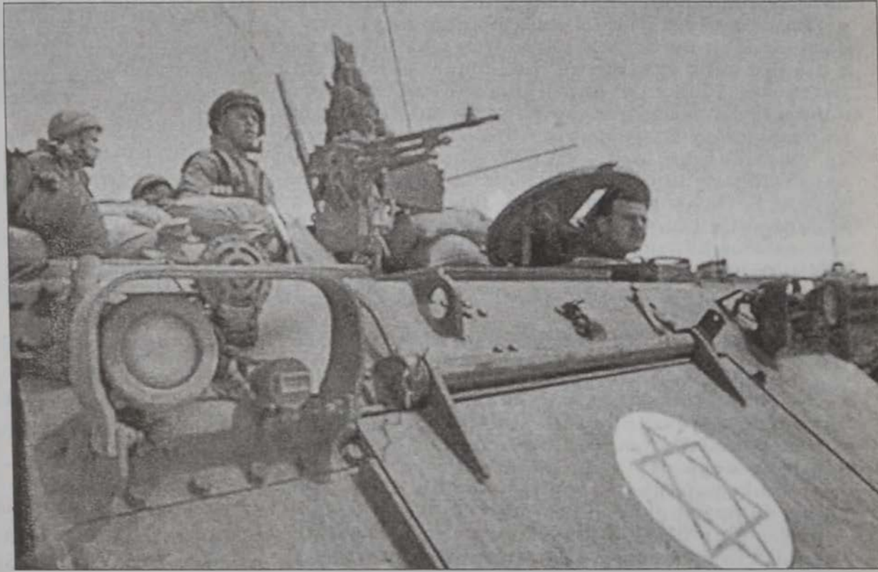
Իսրայէլացի զինուորներ կը հսկեն Եսաէր Արաֆատի կեդրոնատեղիին դիմաց

Արտաքին գործոց նախարար Շիմոն Փերես ըսաւ, որ իսրայէլի կրակամարը կրակամարի վերջնական կարգաւորումը մը: Փերես այս կեցուածքը որդեգրած էր կառավարութեան նիստին, ուր քննարկուեցան պա-