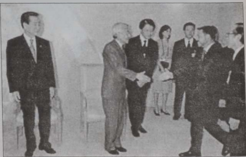
Ճափոնի Աքիհիթօ կայսրը կ'ընդունի Ապտալլա Բ. թագաւորը

Յորդանանի Ապտալլա Բ. թագաւորը յայտնեց, որ Միշին Արեւելքի խաղաղութեան մասին Պուշի իրապարկած ծրագիրը յստակացումի կը կարօտի: Ապտալլա աւելցուց սակայն, որ հաւատք ունի Պուշի յայտարարած յանձնառութեան հանդէպ: