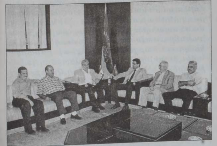
Այցելութեան ընթացքին (Լուսանկարը՝ ՍԹԻՒՏԻՕ «ԱՇԵԱԿ»)՝

Ռապիթա Շաղիւա Կուսակցութեան ղեկավար, նախկին երեսփոխան Զահէր Խաթիպ երկ պատուիրակութեան մը ընկերակցութեամբ այցելեց Հ. Յ. Դ. «Սարդարապատ» ակումբ, ուր ընդունուեցաւ Հ. Յ. Դ. Լիբանանի կեդրոնական կոմիտէի ներկայացուցիչներուն կողմէ: