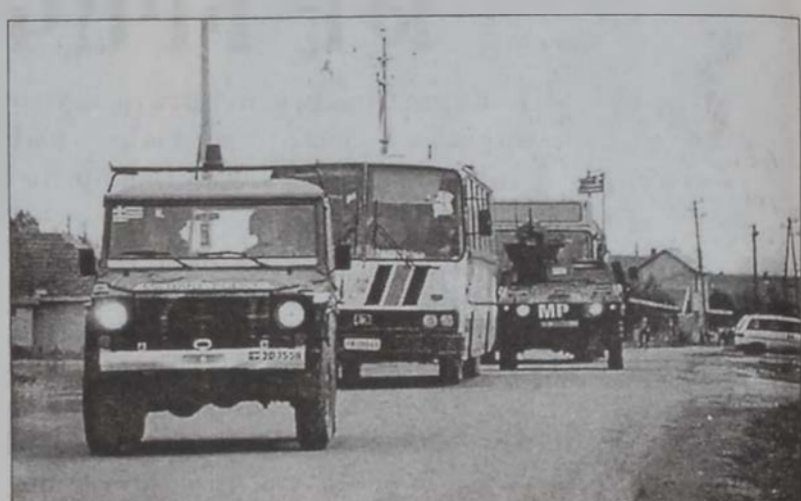
ՕթԱՆի զինուորներ ամեն օր կ'ուղեկցին Փրիշթինայի սերպերու զաւակներուն դպրոց երթելու կին:

Այս համաձայնագրին հիմամբ (ՄԱԿի թիւ 1244 բանաձեւ), Քոսովո տեղադրուող միջազգային ուժերուն մաս պիտի կազմէին նաեւ ՕթԱՆի չանդամակցող ուժեր (յատկապէս ռուս զօրազուններ, որոնք ՕթԱՆի ուժերուն հասնելէն առաջ շտապեցին եւ ձեռք ձգեցին ռազմական կարեւորութիւն ներկայացնող Փրիշթինա օդակայանը), աշխարհը պիտի շարունակէր Քոսովոն եռակողմանակապակցական հողամաս նկատել, ալպանական «Քոսովոյի Ազա-