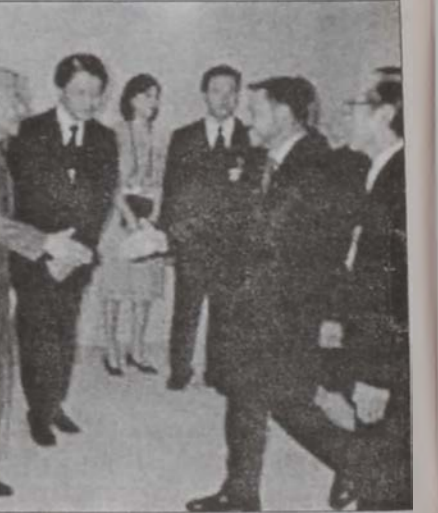
Ճափոնի Աքիհիթօ կայսրը կ'ընդունի Ապտալլա Բ. թագաւորը

ընչեղու խոստում չստացաւ Թոքիոյն: Նախագահ Պուշ անցեալ շաբաթ ձափոնի կոչ