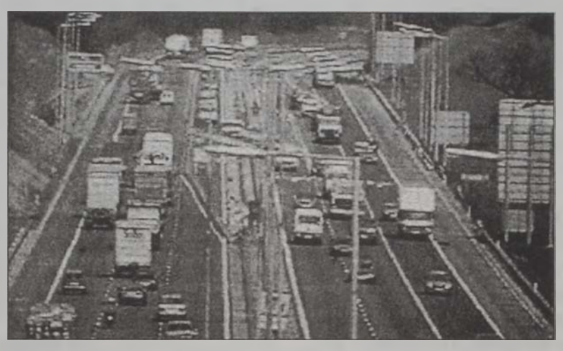
Մարդկային ազդեցութիւնները հետզհետէ աւելի յստակ հետքեր կը ձգեն մեր մոլորակին վրայ:

Այս հետազոտողները պետական տեղեկութիւններ եւ այլազան գնահատումներ գործածած են ճշդելու համար, թէ որքան հող անհրաժեշտ պիտի ըլլայ այդ գործունէութիւններուն համար մարդոց կարիքին գոհացում տալու համար: Օրինակ, մասնագէտները գտած են, որ 1999ին իւրաքանչիւր անձ միջին հաշուով 2,3 հեկտար հող «կը սպառէ»: Ընդհանուր միջինը շատ աւելի ցած էր, քան՝ Մ. Նահանգներու եւ Բրիտանիոյ նման ճարտարապետականութեան երկրներու միջինը, որ յաջորդաբար 9,6 հեկտար եւ 5,3