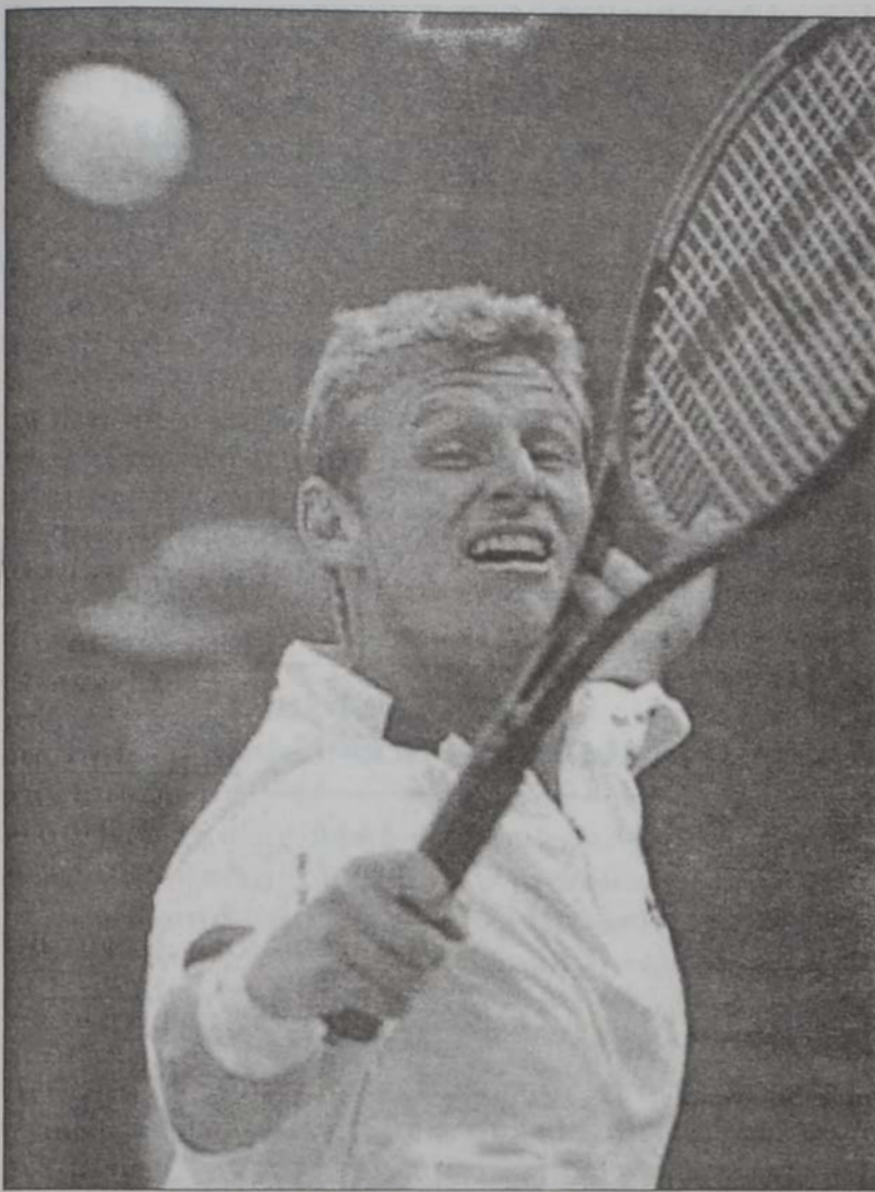
Դաիթ Նալպանտեան ապահովեց քառորդ աւարտակազմի իր տոմարը

Ուիմպլերի մէջ տեղի ունեցող թենիսի միջազգային մրցաշարքին Դ. հանգրուանին իր կատարած մրցումին, արժանութիւնաւ Դաիթ Նալպանտեան (դասուած՝ 28րդ), 6-4, 7-6, 2-6 եւ 7-6 արդիւնքով պարտութեան մատնելէ ետք աւտորալիացի Ուէյն Արթիւրսը, ապահովեց քառորդ աւարտակազմին իր տոմարը: