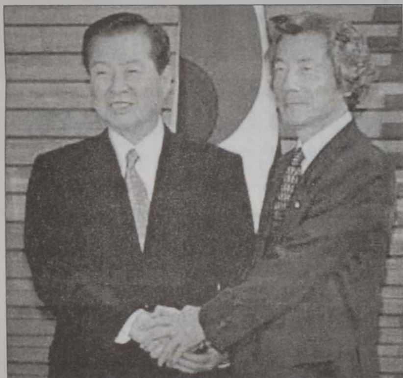
Ճափոնի վարչապետը կ'ընդունի Քիմը

ՍԵՆՈՒ, 1 (ՌՈՅԹԸՐԸ) - Հարաւային Բորեայի նախագահ Քիմ Տայ Տունկ Երկուշաբթի օր յայտարարեց, որ հաստատ պիտի մնայ Հիւսիսային Բորեայի հետ բանակցություններ կատարելու քաղաքականութեան վրայ, հակառակ անոր որ շաբաթավերջին բախում արձանագրուած է երկու երկիրներուն եպրապահ ուժերուն միջեւ: