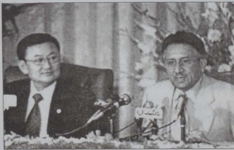
Մուշարրաֆ կը պատասխանէ լրագրողներու հարցումներուն

Ամերիկացիք պետք է տօնախմբեն Յուլիս 4ի անկախութեան օրը, սակայն անոնք աչալուրջ պետք է ըլլան հաւանական յարձակումներու դէմ, յայտնած է Մ. Նահանգներու Սպիտակ Տունը երէկ, մինչ երկրին տարածքին նահանգներ ու քաղաքներ կը պատրաստուէին վայելելու տարուան կարելորագոյն արձակուրդներէն մէկը: