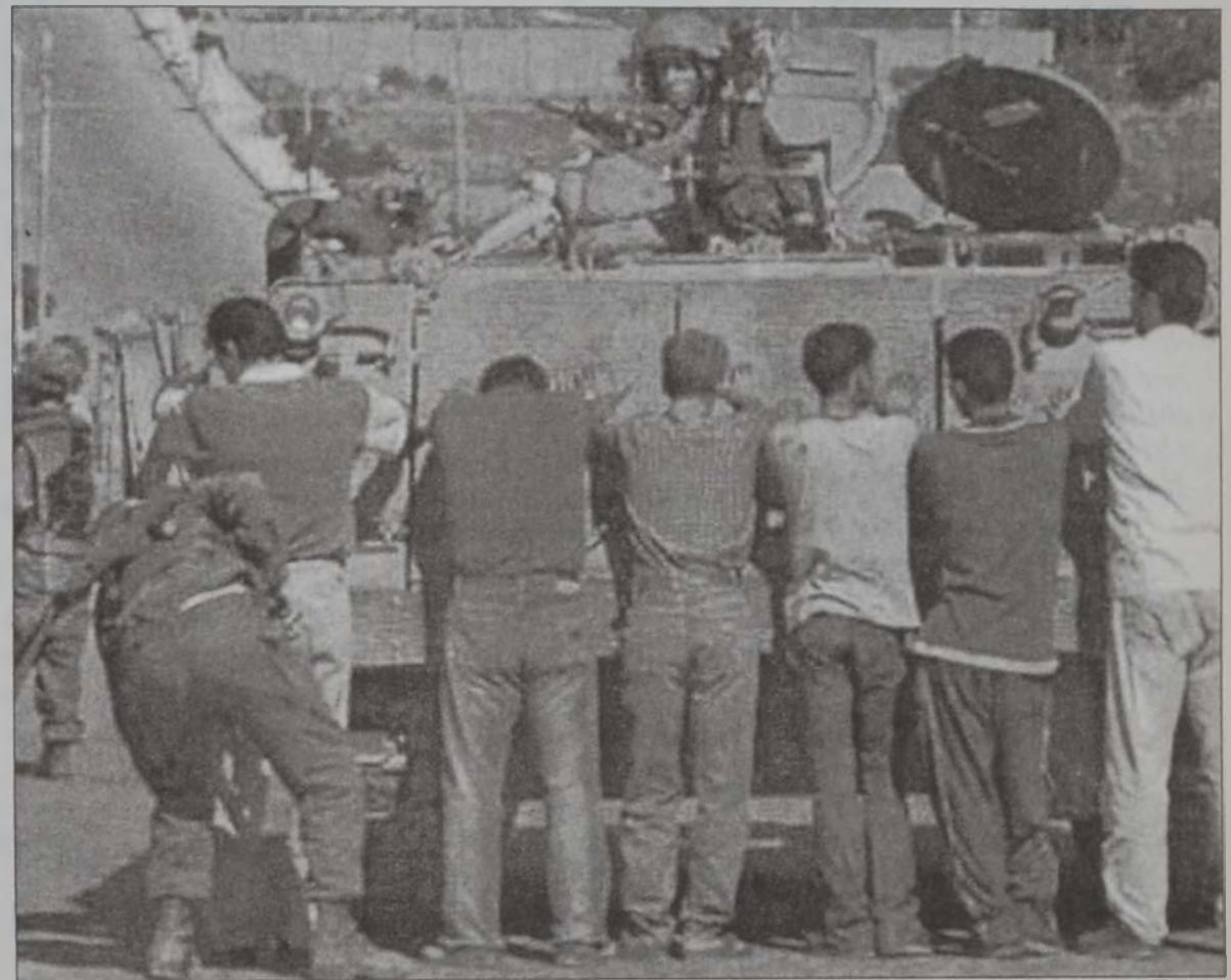
Իսրայէլացի զինուորներ կը խուզարկեն անգղէ պաղեստինցիներ Շեպրոնի մէջ

Իսրայէլի պաշտպանութեան նախարար Պենիամին Պրն Էլիա-