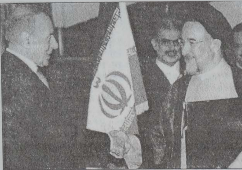
Նախագահ Նաթեմի կ'ընդունի Հայտար Ալիեւը

Այդ պատճառներուն կողքէ միանալու ամերիկեան ընդդիմութիւնը՝ ազերիական քարիւղը Իրանի ճամբով արտածելու եւ, միւս կողմէ, Պաքու-Ճէյհան քարիւղատարին ծանուցումը: Քարիւղատարը մեծ օգուտ կ'ենթադրէ շրջանին մէջ Իրանի մրցակից թուրքերը: Մէկ խօսքով, Ազրպեյձանի ամերիկամէտ եւ Իրանի հակամերիկեան քաղաքականութիւնները «բնական» պատ մը ստեղծած են երկու երկիրներուն միջեւ լայնիմաստ սամագործակցութեան եւ բարեկամական կապերու ստեղծման դէմ: Կասպից ծո-