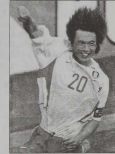
Հոնկ Միուճ Գո

հասած էր աւարտականին (1954, 1966, 1974, 1982, 1986 եւ 1990), որոնց ընթացքին երեք անգամ բարձրագուցած էր բաժակը: