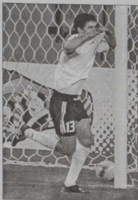
Միքայել Պալաք, որ Գերմանիոյ կողմէն խաղացած էր

սի պարագայի մը, բաւական դժուար պիտի ըլլայ որեւէ մարզիկի մը աւարտական մրցումէն բացակայիլը, մասնաւոր, որ անոր նշանակած կողին շնորհիւ էր, որ Գերմանիա ապահոված էր աւարտականին իր տոմարը: