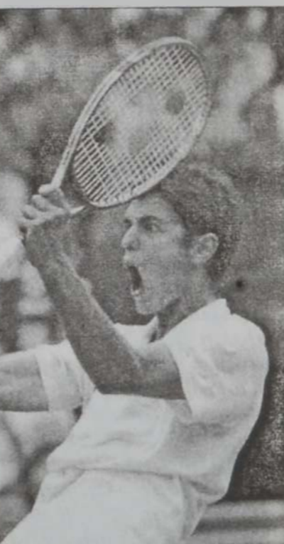
Մարիո Անսիչ կը սօցեց իր յաղթանակը

Մարիո Անսիչ կը սօցեց իր յաղթանակը Մարիո Անսիչ (Մ. Ն.) - Էվա Պէս (Սպանիա) 6-0 եւ 6-0