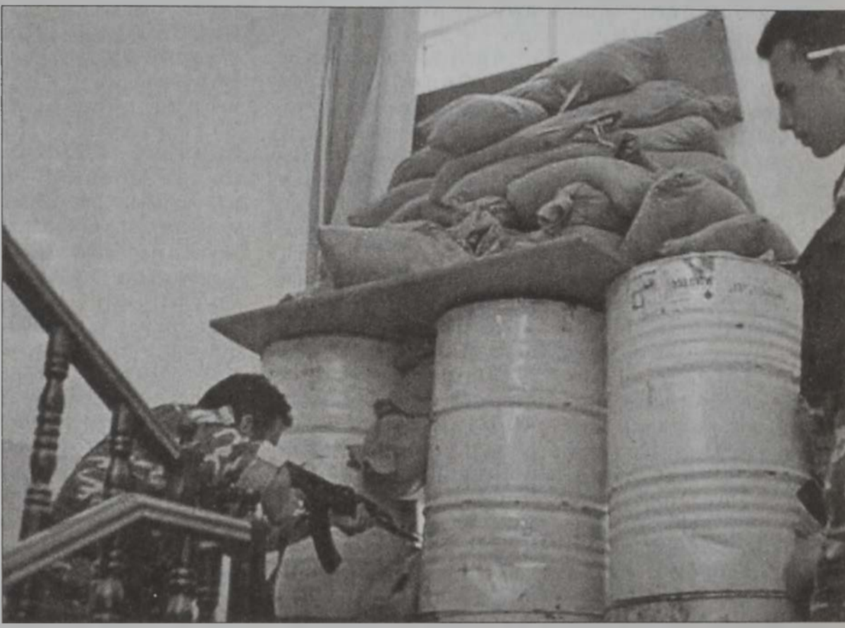
Պաղեստինցի ոստիկան մը՝ դիրք բռնած Արաֆաթի կեդրոնատեղիին մէջ

Միացեալ Նահանգներու նախագահ ձորձ Պուշի յայտարարութիւնը Միչին Արեւելքի խաղաղութեան պատկերացումին մասին դրական ու ժխտական հակադարձութիւններ ունեցաւ շրջանային ու միջազգային գետնի վրայ: