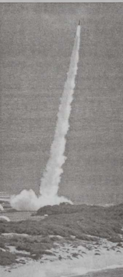
13 Յունիսին ամերիկացիներ Հաուայի մէջ կը փորձարկեն միջցամաքամասային հրթիռ մը

Աճապարանքը, ապահովական հարց ըլլալու կողքին, նաեւ քաղաքական խնդիր է: Եթէ պաշտպանութեան այս դրութեան ծրագիրը իրագործուի կարելի եղած արագութեամբ, եւ այդպէս ալ ըրաւ: «Սեպտեմբեր 11ի դէպքերը յստակ դարձուցին, որ այլեւս չենք կատճառով ապահովական մասնագէտներ հարց կու տան, որ արդեօք Միացեալ Նահանգները չաճապարեցին՝ դաշնագրին զանցնելու: