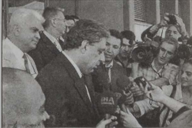
Օսկանեան կը պատասխանէ թուրք լրագրողներուն հարցումներուն

Պոլսոյ մէջ կայացաւ Հայաստանի եւ Թուրքիոյ արտաքին գործոց նախարարներ՝ Վարդան Օսկանեանի եւ Իսմայիլ ձէմի դռնփակ հանդիպումը, որ տեւեց մօտաւորապէս 45 վայրկեան: Հանդիպումին մասին մանրամասնութիւններ չհրատարակուեցան: