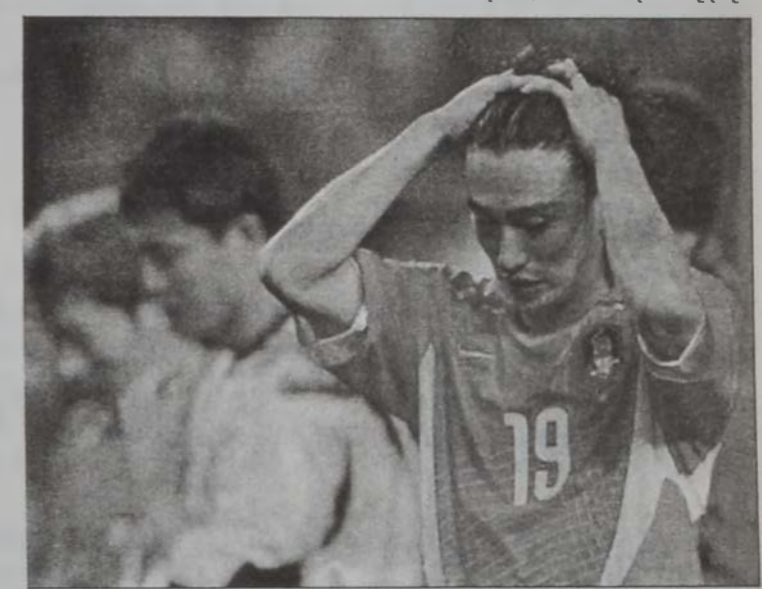
Աճ Եուճ Լուճ (աջից), որ տխուր կը հեռանայ դաշտէն

Պրազիլ - Թուրքիա մրցումը ձեւով մըն ալ յատկանշական է այն իմաստով, որ Մոնտիպոլին ընթացքին հինգերորդ անգամ ըլլալով է, որ երկու խումբեր իրարու դէմ երկու անգամ կը ճակատեն: Նախապէս մրցումը տեղի կ'ունենայ ժամը 14:30ին՝ Պէյ-րուքի ժամով: