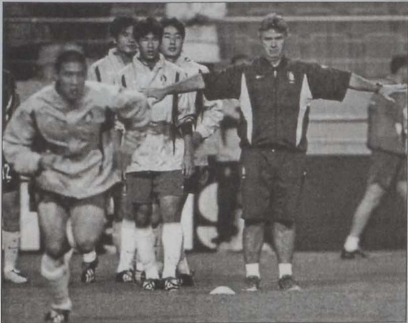
Հարավային Եվրոպայի մարզիչ Կուս Հիտինգը վերջին պատրաստությունները կը տեսնե

Մոնտիալի 72 տարեկան պատմուհի մեջ որեւէ ժամանակ թերեւս Գերմանիա Հարավային Քորեայի դէմ իր կատարելիք մրցումը կրնար կաթմել դիւրին, սակայն այժմ կացութիւնը տարբեր է: