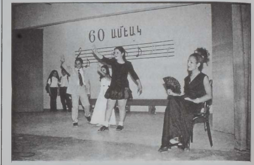
«Կորուած անճառուղի» քառերախաղի տեսարան մը

Կրթական մարզին մէջ լայն աշխատանքներ ծաւալած Այնճարի Հայ Աւետարանական Երկրորդական վարժարանի հիմնադրութեան 60ամեակի առիթով, վարժարանին մէջ սկսաւ ձեռնարկներու շարք մը: Այս հաստատութիւնը, իր գեղեցիկ բաժինով, լծուած է հայ սերունդներու դաստիարակելու առաքելութեան եւ նաեւ կերտելու կ'ընդունի ոչ միայն Այնճարէն, այլ նաեւ՝ Մերձաւոր Արեւելքի զանազան շրջաններէ: Անցեալ շաբաթավերջին դպրոցին աշակերտները հանրութեան ներկայացան երկու ձեռնարկներով՝ իբրեւ արգասիք վարժարանին տարած գործունէութեան: