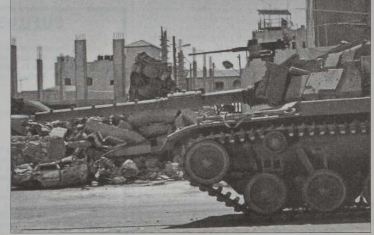
Իսրայէլեան հրասայլ մը՝ Արաֆատի կեղծոնատեղիին շուրջ

Իսրայէլեան ապահովութեան ուժերը Հաստատեցին, որ Կազայի յարձակումը կ'ընթացի Կազայի թեկ զականները Հարուածեալու Իսրայէլի քաղաքականութեան սահմաններէն: