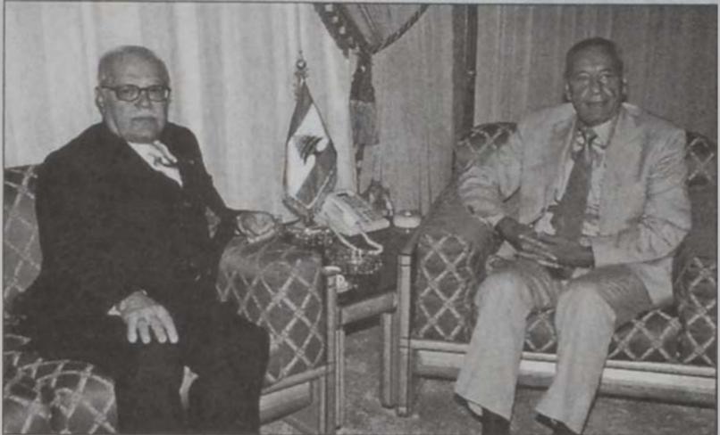
Պրորի եւ Իսամ Ֆարէս

Խորհրդարանի նախագահ Նեպիհ Պրորի երէկ ընդունեց փոխ վարչապետ Իսամ Ֆարէսը եւ անոր հետ քննարկեց քարահատման վարչերու հարցի հետապնդման իր գլխաւորած նախարարական յանձնախումբի աշխատանքները: