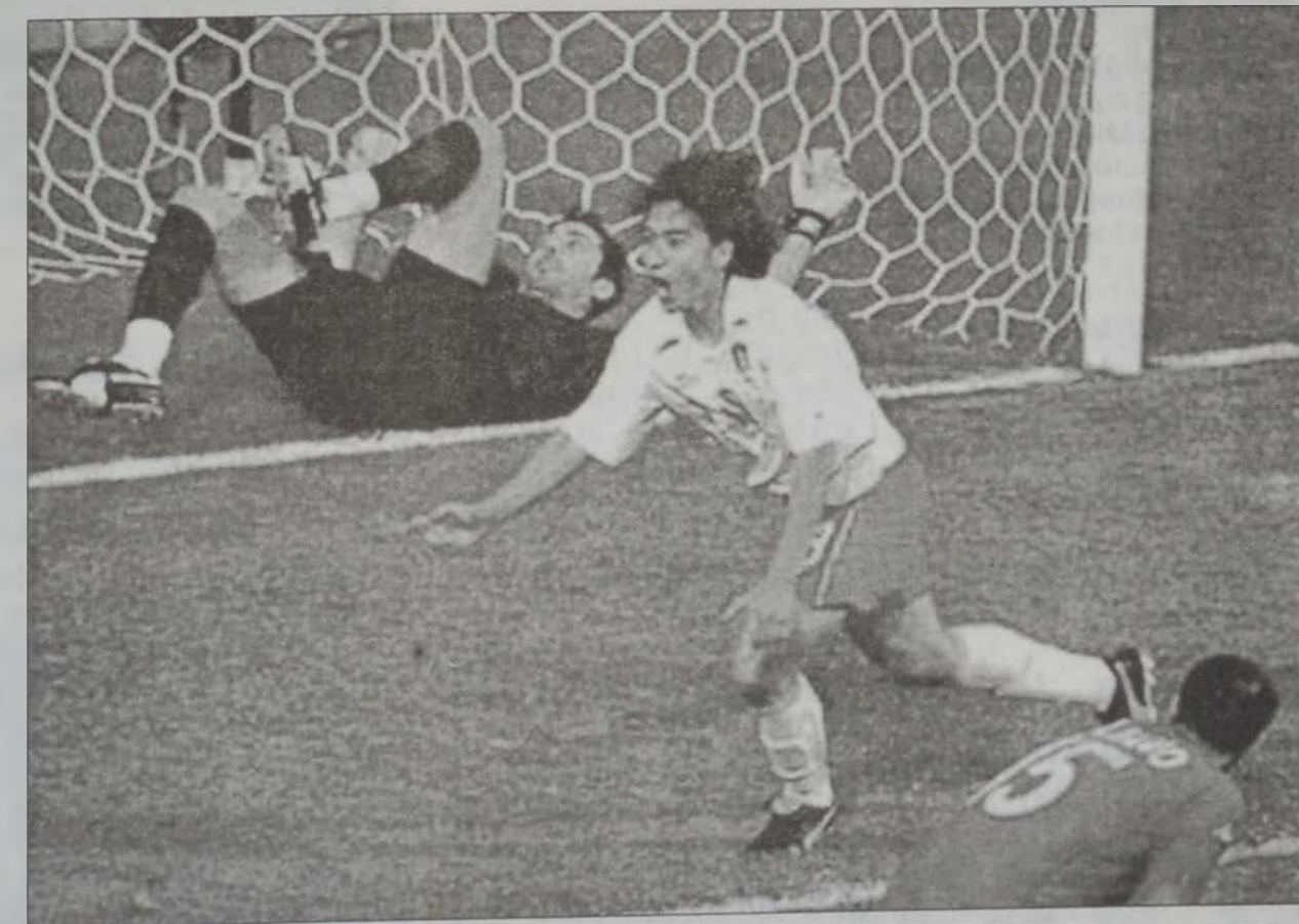
Քորեացիք կը նշանակեն «մահացու կոլտըն կոլ»ը

Մոնտիալի անակըն- կայները կը շարունակ- ւին: Երէկ, կապակեր- պի: Հարաւային Քորեա