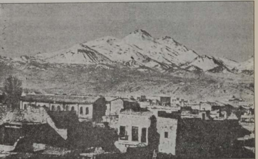
Կեսարիա եւ Արգեսու լեռը

Անոր հեղինակութիւնն ու հարստութիւնը ժառանգեց եղբայրը՝ Խաւաճա Բարթողիմէոս Կեսարացի Կիւլպէնկեան: Ան մօտիկ բարեկամութիւնը պահեց Մոհամմէտ Ալի փաշային հետ, մինչեւ անոր մահը՝ 1848: Բարթողիմէոս Կիւլպէնկեան սերտ բարեկամութիւնը շարունակեց Մոհամմէտ Ալիի յաջորդներուն՝ փոխարքաներ Իպրահիմ (1848ին), Ապպաս Ա. (1848ին 1854), Սալիմի (1854էն 1863) եւ Իսմայիլի հետ: