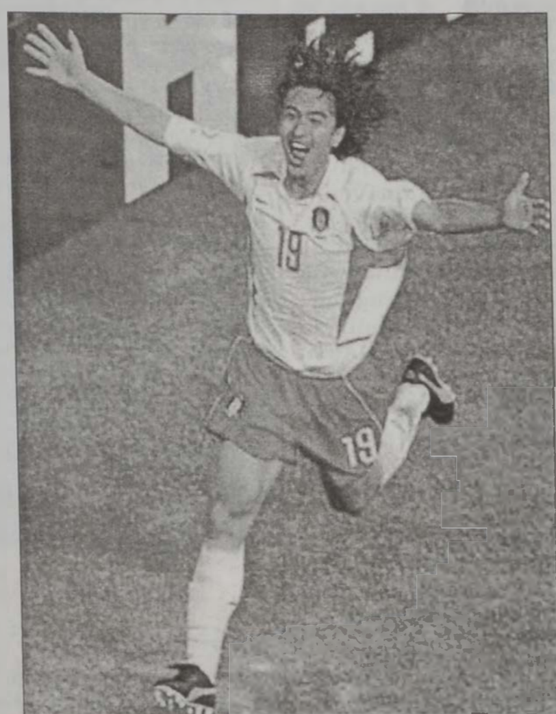
2002ի Մոնտիալից երկրորդ «կոլտըն կոլ»ը Գշանակած Աճ Ժուճկ Հուճ

Մոնտիալի Բ. հանգրուանի երեկ- ուն Երկու մրցումնե- րեն ետք, վերջնակա- նապես յստակացան քառորդ ասարտական հանգրուանին հաս- նող ութ խումբերը: Անոնք են. Անգլիա, Պրագի, Գերմանիա, Միացեալ Նահանգ- ներ, Սպանիա, Հարա- ւային Բորեա, Սենե- կալ եւ Թուրքիա: