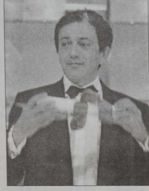
Էլիա Սիւլեյման՝ դատական կազմի մրցանակակիր:

Քաննի Շարժապատկերի փառատունը աւանդաբար ընդունուած է իբրեւ միջազգային շարժապատկերին նուիրուած տօնակատարութիւն մը, ուր լուսարձակի տակ կ'աւանդուին, Հոլիվուտի կողքին, աշխարհի զանազան կեդրոններուն մէջ պատրաստուած ժապաւէնները: 55 տարիներու ընթացքին եւ մա'նական դերը ին տաւանաձեւ կ'աւանդուին գլխաւոր մրցանակով՝ «Ոսկեայ արձակուրդ»-ով պարգևատրուած ժապաւէններուն «ազգութիւններուն» ալիքազանգութիւնը: Վկայութիւն է փառատօնին միջազգային դիմագիծին, որ պահուեցաւ այս տարի եւս, երբ մրցանակները շնորհուեցան զանազան երկրներ ներկայացնող ժապաւէններու: