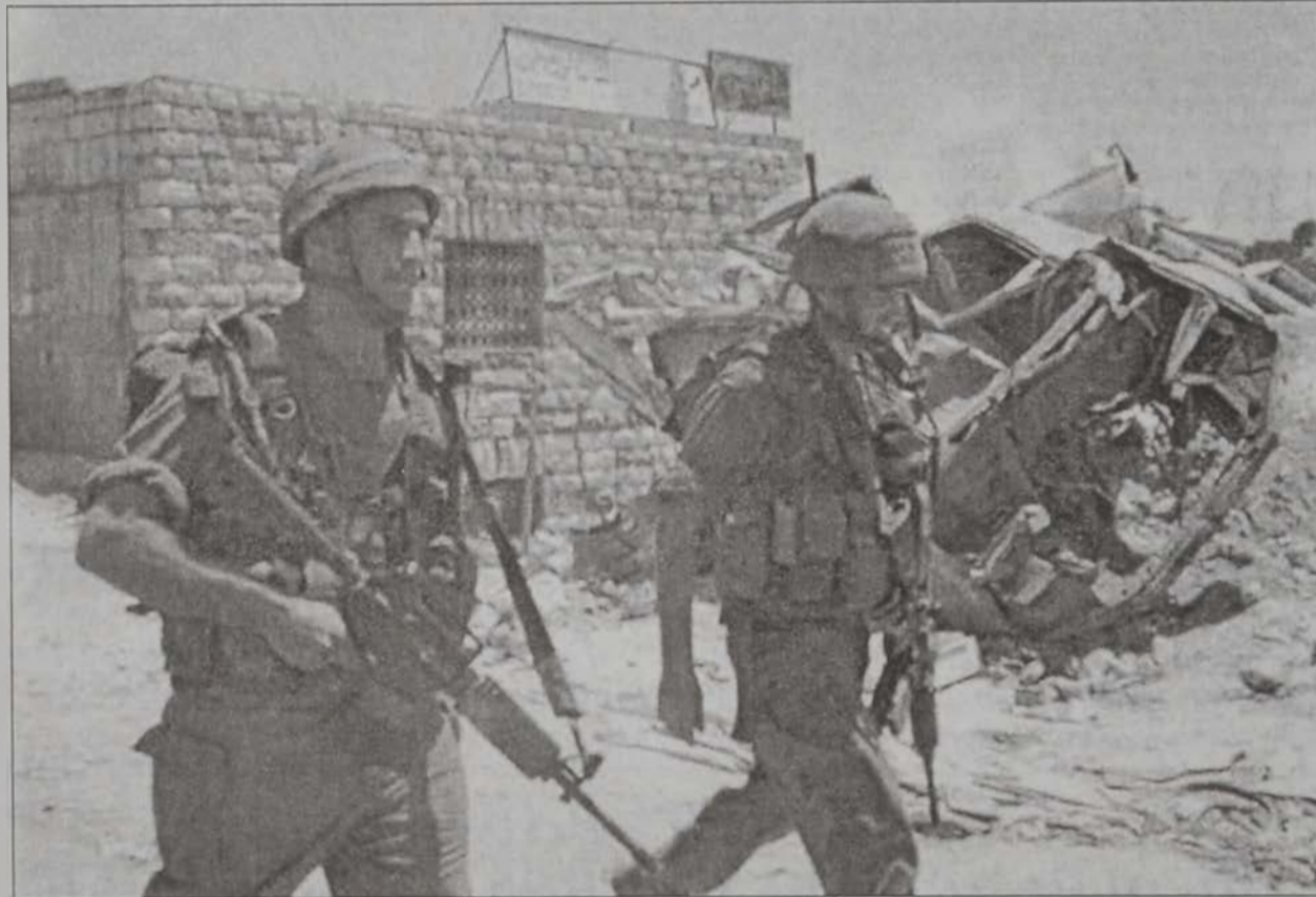
Իսրայէլացի զինուորներ կը հեռացնեն Աճաթա գիղէն, խուզարկութիւններ եւ ձերբակալութիւններ կատարելէ ետք:

Այն պահուն, երբ ամերիկացի ու եւրոպացի պաշտօնատարներ թափ կու տան խաղաղութեան ճիգերուն եւ առաքելութիւններուն, իսրայէլեան բանակը վերստին Հեպրոն կը ներխուժէր