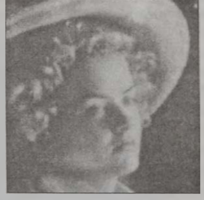
Լիւիս Ռասըլ՝ «Լ'անկլէզ Է լը տիւր»-ի մէջ

Երկար ժամանակէ ի վեր սպասուող «Փէնիք ռուս»-ի ցուցադրութեան կողքին, լիբանանեան շարժապատկերի սրահներուն նորութիւններուն շարքին է «Լ'անկլէզ Է լը տիւր» Ֆրանսական ժապաւէնը, որ տրամաշի ձեւով կը ներկայացնէ Ֆրանսական յեղափոխութեան ժամանակաշրջանը: Մագուստի բրիտանացի կրէյս էլիթը (Լիւիս Ռասըլ) կը ներկայանայ իբրեւ Ֆրանսացի ազնուական: Անոր բարեկամը՝ թագաւորական ընտանիքի անդամ դուքս մը, յեղափոխական է: Այս երկու տիպարներուն աշխարհայեացքը ընդմէջէն է, որ ժապաւէնը կը ներկայացնէ Ֆրանսական յեղափոխութիւնը: «Լ'անկլէզ Է լը տիւր» յատկանշուած է շատ յաջող բեմադրութեամբ, բեմադրութեամբ եւ խաղարկութեամբ: