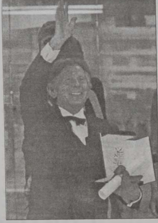
Ռոման Փոլանսկի՝ «Ոսկեայ արձակուրդ»-ին հետ:

կան ժապաւէնին (բեմադրիչ՝ Մայքըլ Մուր): Արարական եւ յատկապէս միջին արեւելեան շարժապատկերի աշխարհը ցնծութեան պահեր ապրեցան, երբ առաջին անգամ ըլլալով մրցակցութեան մասնակցող արարական ժապաւէն մը, այս պարագային՝ պահեստինցի բեմադրիչ էլիա Մուլեյմանի «Նատոն իլա-հիա»-ն արժանացաւ դատական կազմի մրցանակին: Նշենք, որ ժապաւէնը կ'արտացոլացնէ պարզաստիճան գրաւեալ շրջաններու առօրեային պատկերները: Այսուհանդերձ, երկրորդական արժէք ներկայացնող այս մրցանակը անարդար նկատուեցաւ «Նատոն իլա-հիա»-ի համար, որ քննադատներու համաձայն, պէտք է աւելի մեծ մրցանակ արժանանար իր իւրայատկութեան համար: