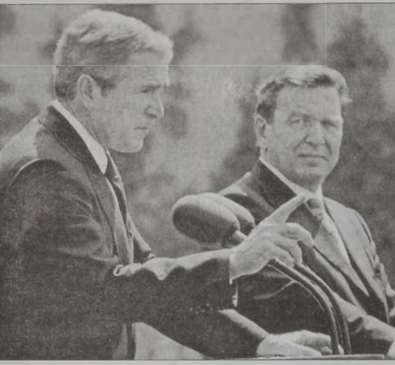
Պուշ եւ Շրէօտըր՝ մամլոյ միացեալ ասուլիսի ընթացքին:

Ան իրաքի նախագահ Մատամ Հիւսէյնը քաղաքակրթութեան ղէմ սպառնալիք մը նկատած է, յայտնեցով, որ անոր պէտք է ընդդիմանալ կարելի բոլոր միջոցներով, սակայն ան նախագահ Գերմանիոյ վարչապետ Կերհարտ Շրէօտըրի