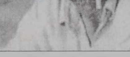
Բեմադրիչ Ռոպերթ Կետիկեան

Շարժապատկերի միջազգային աշխարհին ուշադրութիւնը 1998ին «Մարիուս Ե ձիւլիէթ» ժապաւէնով իր վրայ հրաւիրած Ռոպերթ Կետիկեան կը սերի գերմանացի մօրմէ եւ հայ հօրմէ: Ան ծնած է 1953ին, Մարսէյի մէջ: Փարիզի մէջ ընկերաբանութիւն ուսանելու ընթացքին ան կը գտնէ իր իսկական կողմը՝ շարժապատկերի աշխարհը, որ մեծերու ներս իր 20-ը: