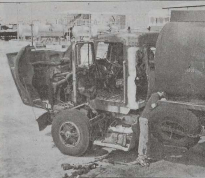
Սիթերը, գործարարական ոստիկանութիւնը յայտնաբերեց՝ նախքան պայթումը:

Թէլ Աւիւի շրջանին պայթումէն քանի մը ժամ առաջ, Չորեքշաբթի գիշեր անձնասպանական