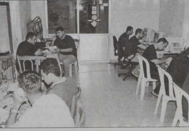
«Աղբալեան» ակումբի մէջ

«Աղբալեան»ի մեր թղթա- կիցները եւ լուսանկա- րելիները երէկ այցելեցին «Աղբալեան» ակումբը, ուր կարծէք ցոյց կար: Համակիրներ, ընկերներ, երիտասարդներ, պատա- նիներ, ԼՕՊականներ, բո- լորը ներկայ էին ու ամէն մէկը գործ մը ունէր ըն- լիք, պարտականութիւն մը ունէր կատարելիք: Մեր հարցումներով չու- զեցինք խանգարել գա- նոնք եւ դիմեցինք շրջա- նի երթապահ ընկերով եւ ընտրական պատասխա- նատունին: Անշուշտ անոնք մեր ակնկալածն տարբեր բան չըսին եւ