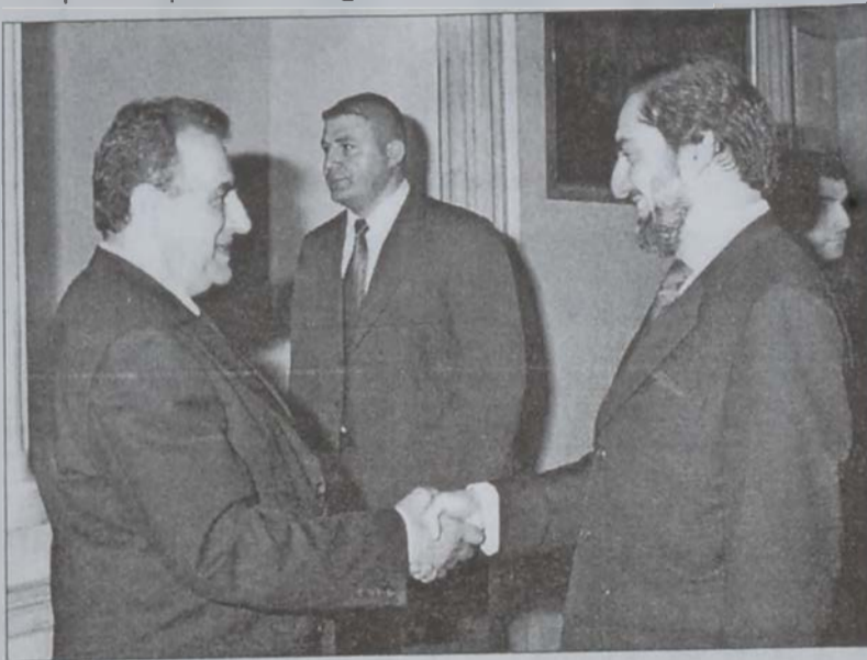
Նախարար Համուտ Կ'ընդունի իր աֆղան պաշտօնակիցը

Վարչապետ Հարիրիի հետ տեսակցելէ ետք ան ըսաւ, որ Աֆղանիստանի ղեկավարութիւնը կը փափաքէ օգտուիլ երկարամեայ պատերազմներէ