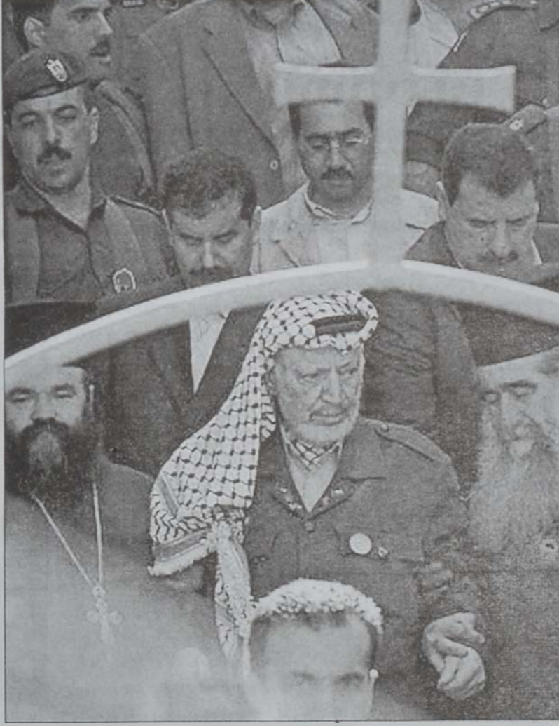
Արաֆատ մուտք կը գործէ Ս. ՕԳՈՂԵԱՆ ԵԿԵՂԵԳԻ:

պայման ուրախութեամբ չէ, որ կը սպասէին: Գաղթականութիւնը քակիչներէն մէկը ըսաւ, որ Արաֆատ կը վախնայ, որ ժողովուրդը բարկութեամբ պիտի ընդունի Կիւբ, որովհետեւ ցարդ ան բարեկարգումներ չէ իրագործած: