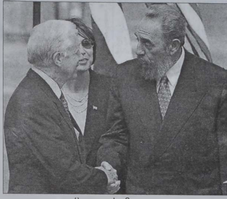
Քասթրո եւ Զարթըր

Քարթըր Կիրակի օր Հաւանայի մէջ ջերմ ընդունելութեան արժանացած էր Քասթրոյի կողմէ: Ամերիկացի զբօսաշրջը՝ Քիկերս գովասանքով արտայայտուած էին անոր ճիգերուն մասին՝ միայն 140 քմ. հեռաւորութեան գտնուող երկու երկիրներուն միջեւ քաղաքական վիճել կամ ընդունելու գծով: