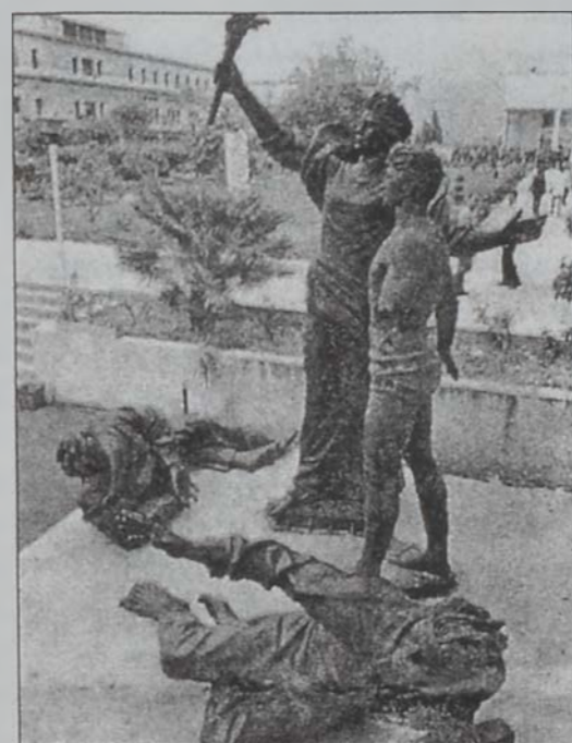
Նախատակաւ յուշակոթողը Զաւիթի մէջ

Նահատակաց հրապարակը այլեւս չի փաստարկեր իր անուկներ, որովհետեւ անիւկ վերածուած է դատարկ, ամալի եւ չորս կողմերէն բաց տարածութեան մը: Նահատակները, որոնց յիշատակը յարգելու եւ յաւերժացնելու համար լիբանանցիները անոնց իսկ գոհուած վայրին մէջ երկու մեծ կոթողները գետեղած էին, կը սպառնան ինչա՛յ մոռացութեան գիրկը՝ անոնց խորհրդանիշը հանդիսացող կոթողներու բացառականութեան պատճառով: