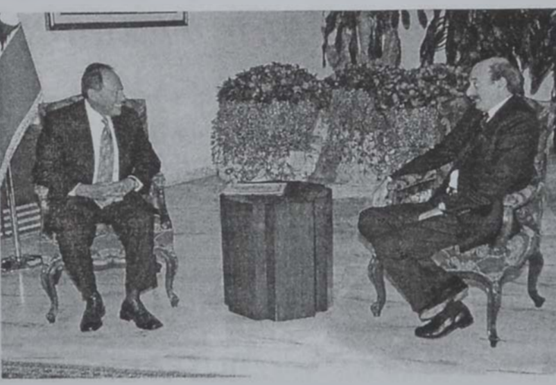
... եւ Ժոմայլաթ այցելեցին Գախագահ Լահուտին:

Հանջը ներկայացուցած խօսուեցաւ պետական էր վարչապետ Ռաֆիք վարչաժեքենային վերաբերելու: Հանդիպումին նաեւ