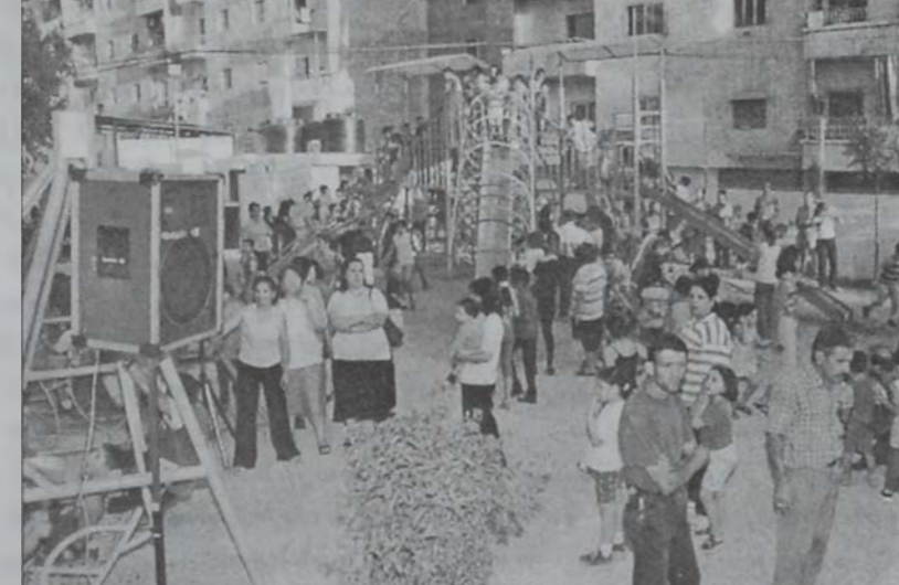
Պուրճ Համուտի մանուկներու խաղավայրը:

Խաղավայրի բացման հանդիսութեան ընթացքին, Պուրճ