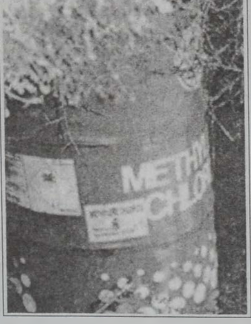
Վտանգէ գոյութեան ազդեր՝ տակառի մը վրայ

Վերջերս, «Կրինփիս» յայտարարեց, թէ փորձագիտական դիտարկումէ մը ետք իրեն յայտնի դարձած է գոյութիւնը աւելի քան 7 տակառներու, որոնք կը կրեն վտանգի եւ թունաւոր ըլլալու նշանները: Ծակառները նետուած են Ժիպէլի շրջանի Պլուզի գիւղին ձորերէն մէկուն մէջ: