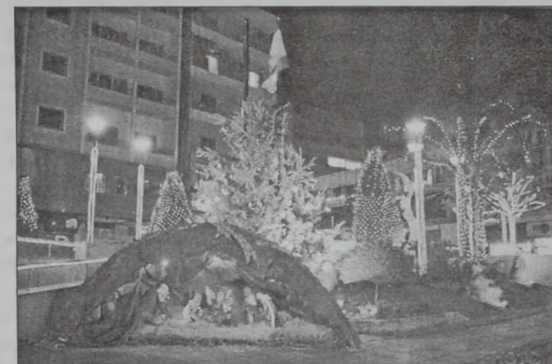
Պուրճ Համուտի հրապարակը՝ Նոր Տարուան ընթացքին:

Պուրճ Համուտի փոխ քաղաքապետ Րաֆֆի Դեօֆոլյանեանի համաձայն, Թրիփոլիի, Սայտայի, Ջահլիի եւ Պէյրութի քաղաքապետարաններէն ետք Պուրճ Համուտի Քաղաքապետարանը թէ՛ իրրեւ ծաւալ եւ թէ՛ իրեն տնտեսական ուժ ու կշիռը մտնելու մեծ Քաղաքապետարանն է: