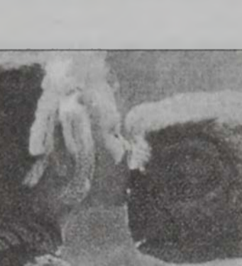
«Ռէք»-էն տեսարան մը:

«Սփայտը-Մէն»ի կողքին, լիբանանեան շարժապատկերի սրահներէն ներս այս շարժուան նորութիւններու շարքին են հանրածանօթ «Մըսթր Պի»ի (Ռոուլըն Էթթինսըն) նորագոյն ժապաւէնը՝ «Ռէք Ռէյս»: