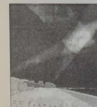
Քանի 55րդ փառատոնին որմազը

Յառաջիկայ 15-26 Մայիսին Ֆրանսայի Քանն քաղաքին մէջ տեղի պիտի ունենայ շարժապատկերի միջազգային համանուն 55րդ փառատոնը, որուն ընթացքին պիտի ներկայացուին 33 երկիրներ ներկայացնող 55 ժապաւէններ: Անոնցմէ քսաներկուքը պիտի մրցին տիրանալու համար «Ոսկեայ Արմաւենի» («Փալմ տ'Օր») մրցանակին: