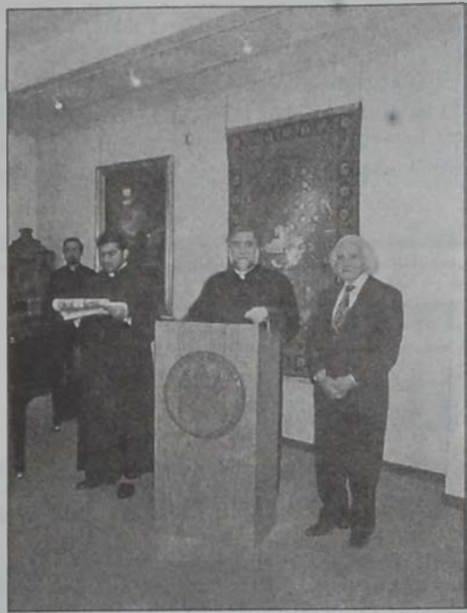
Արամ Վեհափառ իր խօսքի պահուց. Ճախիճ՝ բաճախող Ժ. Ս. Յակոբեան:

Մեծի Տանն Կիլիկիոյ կաթողիկոսութեան «Կիլիկիա» թանգարանի տնօրէնութիւնը երէկ, Հինգշաբթի, 2 Մայիսին կազմակերպած էր գրական իրարարարական երեկոյ մը, որուն ընթացքին համարժեք մեծաթիւ ներկաները առիթ ունեցան ունկնդրելու բանաստեղծի մը կողմէ այլ բանաստեղծի մը ներկայացումը եւ քննարկումը: