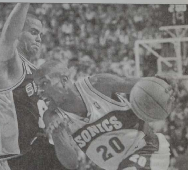
Կերի Փէյթըն (աջից) որ կը փորձէ գերազանցել մրցակից կազմին մէկ մարզիկը:

Սիքսըրը իր դաշտին վրայ 83-81 արդիւնքով պարտութեան մատնելէ ետք Պոսթըն Սէլթիքսը, պարտադրեց ինչգերորդ եւ վերջին մրցում մը, արդիւնքը 2-2 հաւասարեցնելէ ետք: