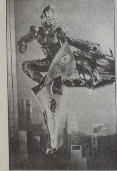
«Սփայտը-Մէն»ի բընամին՝ Կրիս Կոպլինը:

2000 թուականին Սփայտը-Մէն գրեթէ մեռած կը նկատուէր, սակայն համանուն ժապաւէնով քոմիքսի այս տիպարին առիթ մը կը հանդիսանան սփիւտիոներուն համար՝ օգտագործելու իրենց թուային նոր ազդեցութիւնները: Օրինակի համար, «Պլէյտ 2» ժապաւէնին պատրաստութեան համար օգտագործուած են 600 յատուկ ազդեցութիւններու նկարահանումներ, մինչ այլ ժապաւէններու միջինը 50 յատուկ ազդեցութիւններ է: Սփիւտիոներ այս նպատակով յաճախ փոփոխութիւններու կ'ենթարկեն պատմութիւնները՝ աւելցնելու համար ժապաւէնին յատուկ ազդեցութիւնը: Հոգիովուտի եւ քոմիքսի աշխարհին միջեւ այս գործակցութիւնը փոխադարձ շահեր կ'ապահովէ երկուքին: Վերջին տարիներուն, մինչ համակարգչային նորօրինակ խաղեր եկած էին գրաւետական նորութիւններով հարուստ ժապաւէնները աւելի եւս կը հրահրեն քոմիքսի գիրքերէն ներշնչուած ժապաւէնները: