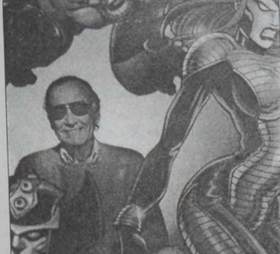
Սթեն Լիի հերոսներուն ցմաքերարներ մեծ պատան բարձրանալով կը փրկեն մէկ աւելի ճարտարարուեստներ:

միջեւ յաւիտենական պայքարը մեծ թափով սկսած է վերստին երեւիլ մեծ պատաններու վրայ: Անգամ մը եւս նիւթերու, տիպարներու եւ մեծագուշակ շահերու համար շուկայում կը դիմէ քոմիքսի գիրքերու աշխարհին: Հակառակ 1989ի «Պէթմէն»ի եւ 1997ի «Պէթմէն Եւ Եւրո Ռոպին»ի արձանագրած նիւթական մեծ յաջողութիւններուն, հազարէկ երեւոյթ են քոմիքսի գիրքերէն յաջող յարմարեցումները, ինչպէս՝ «Մէն ին պլէք» (1997), «Պլէյտ» (1998), «Տը Եքս-Մէն» (2000):