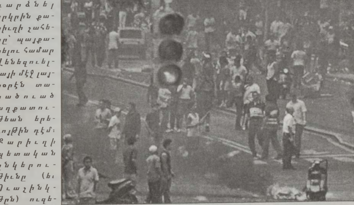
Չաւէսի զօրակցներ քարաքասի մէջ անիւներ կը հրկիզեն:

- Չաւէս մօտիկ բարեկամ է Ֆիտէլ Քասթրոյի եւ աճող գիներով քարիւղ կը ծախէ Քուպայի: - Անոր պաշտպանութեան նախարարը Վենեզուելլայի մէջ ամերիկեան մնայուն զօրքերէն պահանջեց հեռանալ Քարաքասի գիներական խարխիւներէն, յայտարարելով, որ անոնց ներկայութիւնը կ'արդարանար Պաղ պատերազմի