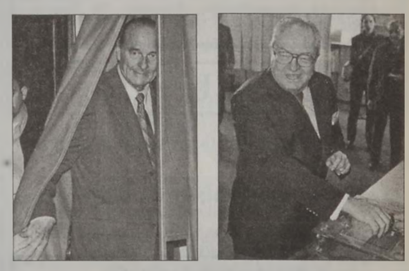
Շիրաք ԼՐ ՓՔՆ

Ցրանսայի նախագահական ընտրութիւններուն երէկ նախագահ Ժաք Շիրաք, ըստ նախնական արդիւնքներուն, շահած է ջուհներուն 20 առ հարիւրը, ծայրայեղ աջ ժան-Մարի Լը Փէն՝ 17,9 առ հարիւրը: Իսկ վարչապետ Լիոնէլ Ժոսփէն ստացած է ջուհներուն 16,1 առ հարիւրը: Երկրորդ հանգրուանին, որ պիտի կայանայ 5 Մայիսին, Շիրաք եւ Լը Փէն կ'ըլլան երկու թեկնածուներ: Գլխաւոր թեկնածուներուն՝ ներկայ նախագահ Ժաք Շիրաքի եւ վարչապետ Լիոնէլ Ժոսփէնի հանդէպ ժողովուրդին յուսախաբութեան պատճառով ջուհարկողներուն թիւը մը քանիչ կոտորող ցած համեմատութիւն մը արձանագրած է: Հակառակ երկրին գրեթէ ամբողջ տարածքին տիրող պայծառ օդին, ջուհարկողներու համեմատութիւնը հազիւ 30 առ հարիւր արձանագրած է: