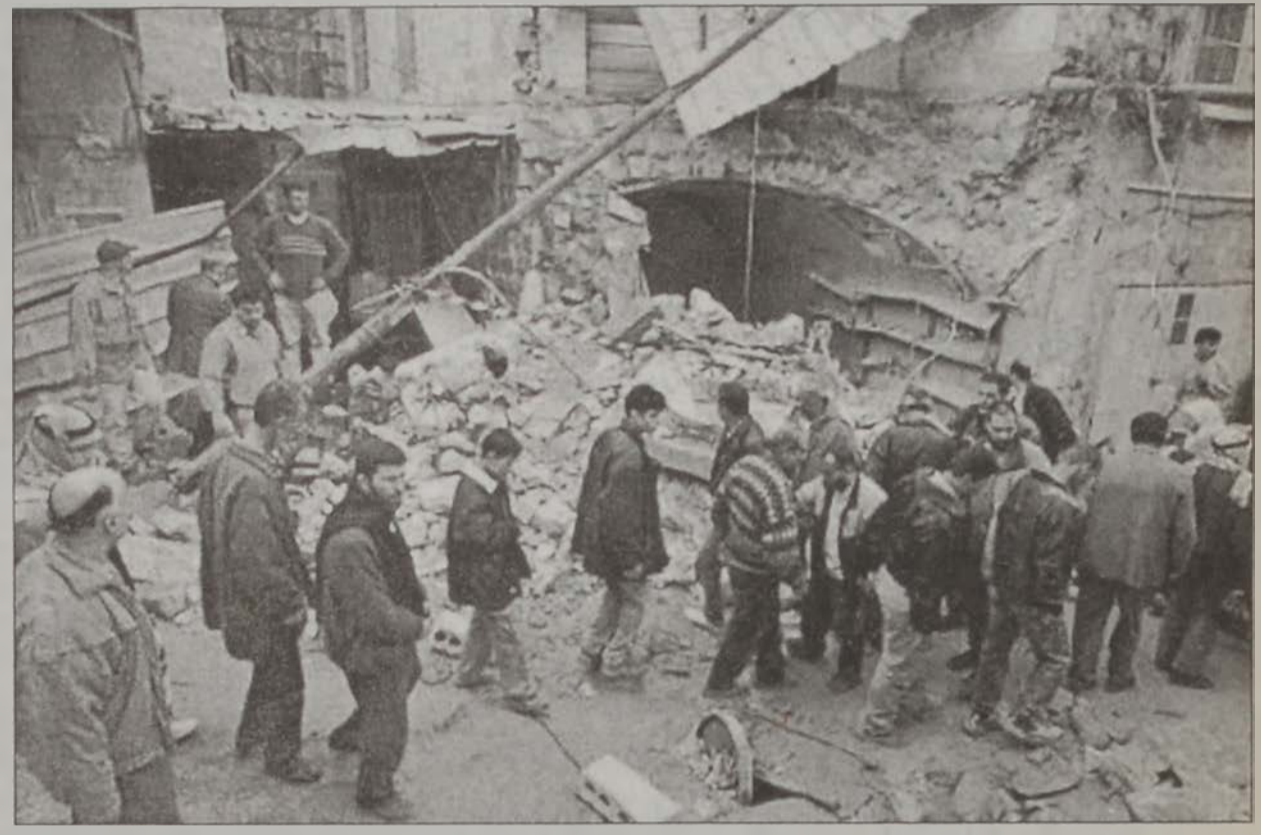
Պաղեստինցիներ՝ Ժենիհի փլատակներու մէջ հարազատներ կը փնտռեն:

Իսրայէլեան բանակին զինուորներն ու հրասայլերը երէկ պարպեցին Այսրոյրդանանի երկու մեծ քաղաքներ, ուր երեք շաբաթ առաջ ներխուժած էին: Բանակը յայտնեց, որ հեռացած է Ռամալլայէն պաշարման օդակի մը մէջ պահելով միայն Արաֆատի կեդրոնատեղին, ուր ըստ բանակին՝ ապաստանած են «ահաբեկիչներ»: Բանակը