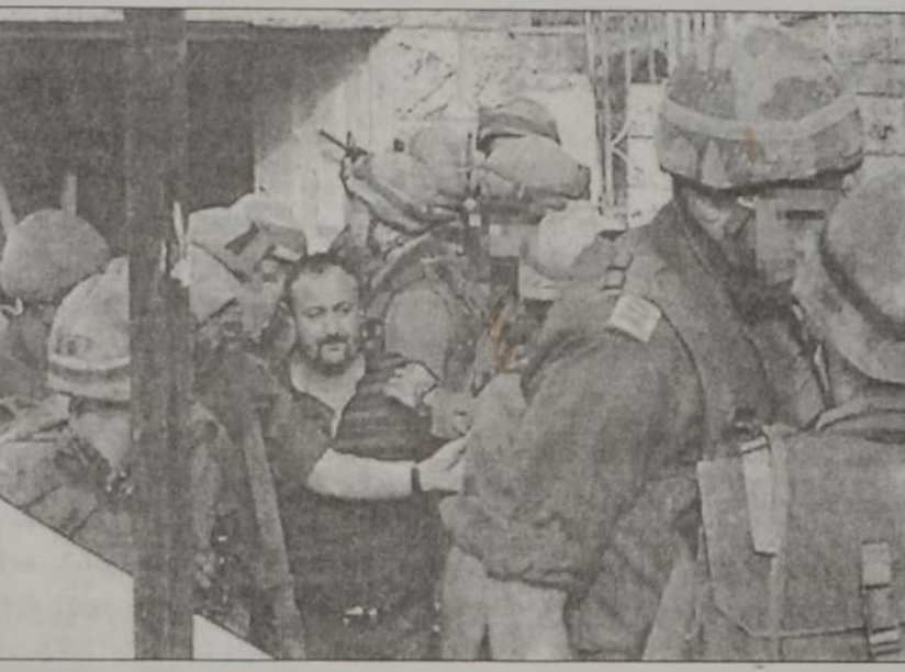
ԶՈՒՄԻՐՈՒ ՄԻՋՈՅԱՌՈՒՄ, ԹԵ ԵՐԿՐՈՒՄ

«Լայֆ» թերթին խմբագիրները 1943ին պաշտպանած են հրատարակութիւնը սարսափազդու լուսանկարի մը, որ կը պատկերէր ճափոնցի մը աղաղակող դանկը՝ հրկիցուած հրատարակի մը վրայ: «Պատերազմը տհաճ է, վայրագ ու անմարդկային: Եւ ասիկա մոռնալը աւելի վտանգաւոր է, քան՝ յիշեցումներուն առեւթած ցնցումը», գրած է թերթը: Որոշումը յանդուգն էր իր ժամանակներուն, որովհետեւ լուսանկարը ցոյց կու տար ոչ թէ ճափոնցիներուն, այլ նաեւ դաշնակիցներուն վայրագութիւնը եւ ամբողջ պատերազմին վայրագութիւնը: Նոյն զգացողութեան մղուած էր 1991ին Մոցի պատերազմին ընթացքին դաշնակից ուժերու ռմբակոծումներուն պատճառով