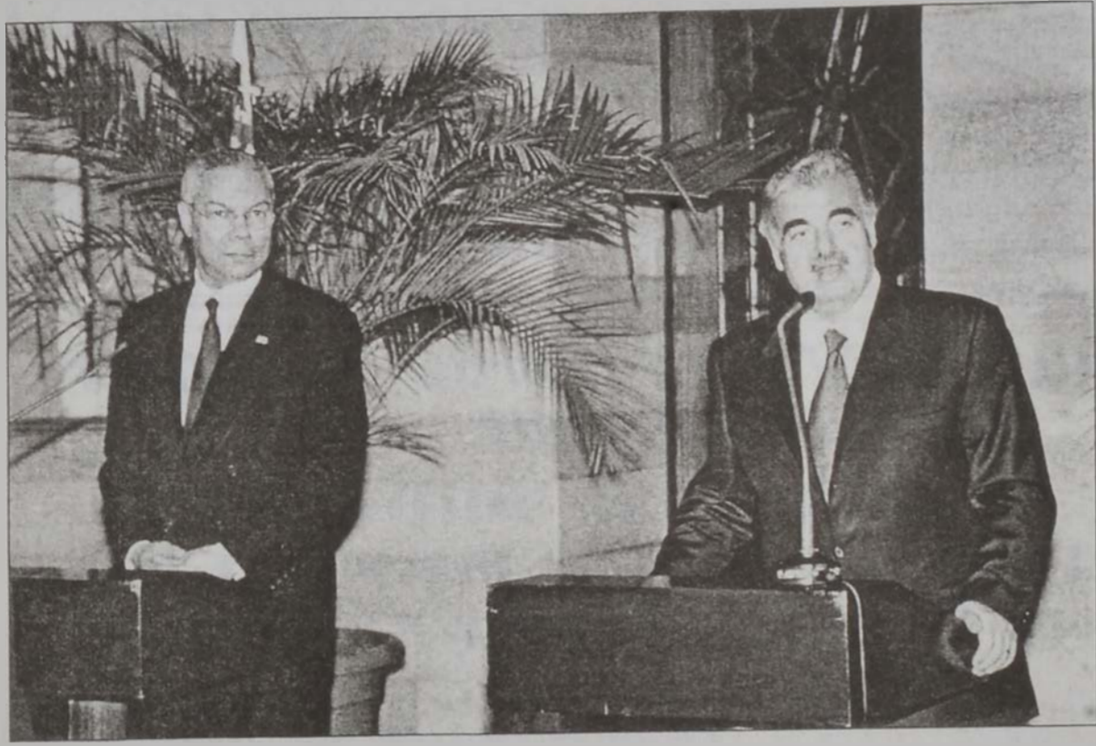
Փաուլը և Հարիրի՝ մամլոյ միացեալ ասուլիսին ընթացքին