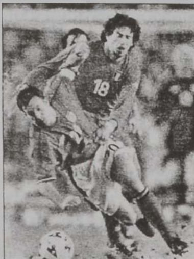
Տեմիթրիօ Ալպերթիի (աջից)

Իտալիոյ ֆուտպոլի ազգային խումբին միջինապահ Տեմիթրիօ Ալպերթիին, որ անցեալ կիրակի օր իր կազմին՝ Ա. Սէ. Միլանի հետ իր կատարած մրցումին ընթացքին վերաւորութեամբ (Եւրոֆուտբոլի դէմ), 2002ի Մոնտիալէն պիտի բացակայի, յայտնեցին անոր ակումբին պատասխանատուները: 30 տարեկան Ալպերթիին, որ 79 անգամ կրած է Իտալիոյ ֆուտպոլի ազգային խումբին շապիկը երկուսէն երեք ամիս պիտի բացակայի դաշտերէն: