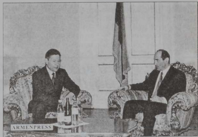
Քոչարեան - Ռէյման

Հայաստանի նախագահ Ռոպիք Քոչարեան երէկ ընդունեց Ռուսիոյ հաղորդակցութեան եւ տեղեկատուութեան նախարար Լիոնիտ Ռէյմանը, որ Հայաստան կը գտնուի մասնակցելու համար տեղեկատուական արհեստագիտութիւններու զարգացման նուիրուած խորհրդաժողովին, որուն հովանաւորն է Եւրոպական Միութիւնը: