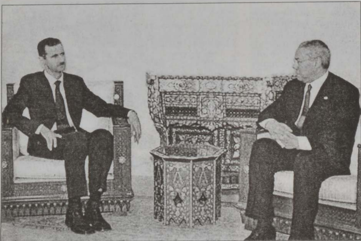
Փաուլը և Ասատ

Ֆուտա Սինիորա, պաշտպանութեան նախարար Սալի Հըրաուի, ներքին գործոց նախարար Էլիաս Մըր, մշակութի նախարար Ղասսան Սալամէ, իսկ ամերիկեան կողմէն՝ ամերիկեան դեսպանատան գործավար Քարոլ Քալին, արտաքին գործոց նախարարի Միշին Արեւելքի օգնական Ուիլիամ Պըրնս, արտաքին գործոց նախարարի Ռիչըրտ Պաուլը, Կինուրական հարցերու խորհրդատու Կորալար Ուոլթըր Տորան և արտաքին գործոց նախարարութեան տնօրէն Քրիշ Բելի: