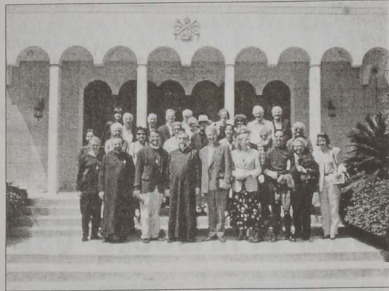
Հիրերը Վեհափառից հետ:

Ուրբաթ, 12 Ապրիլին 30 հոգիներ է բաղկացած խումբ մը միջեկեղեցական պատասխանատուներ և աստուածաբաններ՝ Անգլիայի, Ֆրանսիայի, Չուիցերիայի, այցելեցին Անթիլիասի մայրավանքը: Անոնք նախ այցելեցին Մայր տաճար, «Կիլիկիա» թանգարան, մատենադարան և կաթողիկոսարանի այլ բաժանմունքներ: Կաթողիկոսության միջեկեղեցական յարաբերությունը գրասենեակի վարիչ Նարեկ Ծ. վրդ. Ալեքսեյան ընդհանուր գիծերով պատմական ըրա հայ եկեղեցու ու Մեծի Տանն Կիլիկիոյ կաթողիկոսության: