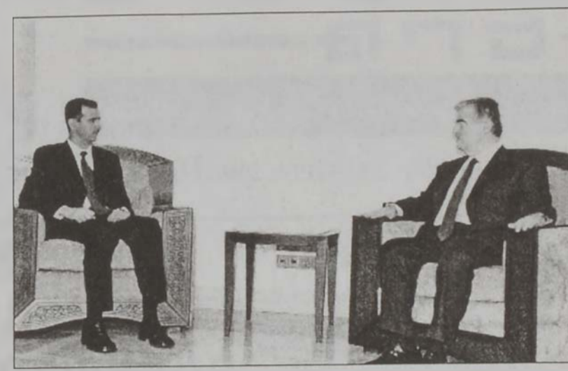
Վարչապետ Ռաֆիք Հարիրի (ձախ) և Պաշար Ասատի (աջ) հարկադրեալ խօսակցութեան ընթացքին:

Քննարկուեցան շրջաններէն ներս կացութիւնը և վայնտնտեսական, առևտրական և մշակութային ոլորտներէն ներս պարագանելու միջոցները: