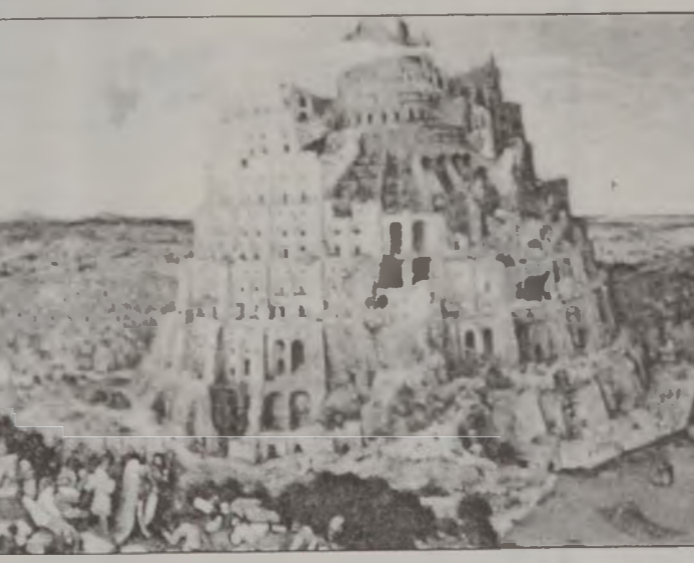
«Բաբելոնի Աշտարակը» - Պրիկէլ Երէջ։

Պրիկէլ Երէջ կը պատկանէր Ֆլանտերի մէջ ծնունդ առնող գեղանկարիչներու նոր սերունդի մը, որ կը հեռանար ռեալիստիզմի մանրանկարչութեան եւ ձեւի կատարելութեան հասնելու իտալական ձգտումէն՝ իրապաշտութեան մէջ կերտելու համար իր սեփական արուեստը, ոճի եւ նիւթի ուրոյն պատկերումով։