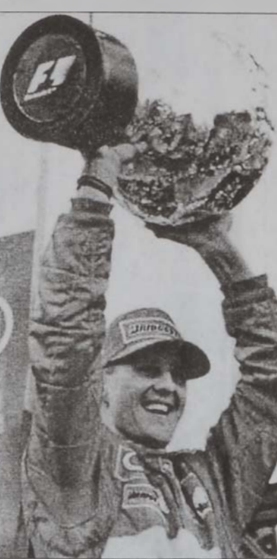
Միքայէլ Շումախըրը, որ շահեցաւ Իմոլայի կրան փրին

Այսպիսով, Շումախըրը, Պարիքելլոյի հետ յաջողեցաւ տուալի մը իրագործել, սնցեալ տարի տեղի ունեցած Հունգարիայի մրցումին, որտեղ իր կարգին շահեցաւ միջազգային իր առաջին տիտղոսը: 23 տարեկան Սեռնայ իր այս յաղթանակը արժանագրեց մէկ ժամ 12 վայրկեանի ընթացքին: