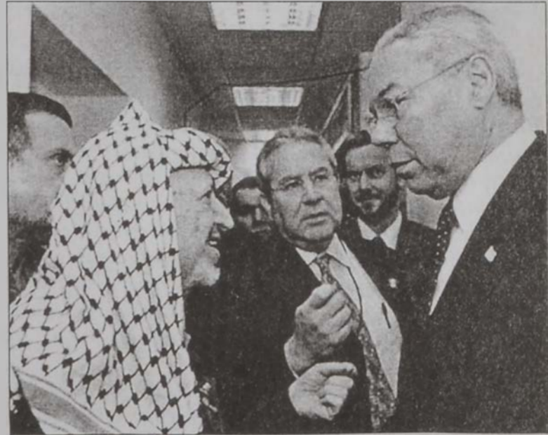
Փաուլը կը տեսակցի Արաֆաթի հետ:

Փաուլը որոշած էր Արաֆաթի հետ հանդիպում ունենալ Շաբաթ օր, սակայն Ուրբաթ օրուան անձնասպանական գործողութեան պատճառով, հանդիպումը յետաձգուեցաւ: Արաֆաթի խորհրդատու Նապիլ Ապու Ռուտայնա ըսաւ, որ պաղեստինցի ղեկավարը պատրաստ է ամբողջական գործակցութիւն ցուցաբերելու Փաուլի առաքելութեան, այնքան ատեն, որ Միացեալ Նահանգներ ճնշում կը բանեցընեն Իսրայէլի վրայ, որպէսզի ուժերը անմիջապէս հետացնեն պաղեստինեան շրջաններէն: Խօսելով զինադուլի մը հաւանականութեան մասին, Ապու Ռուտայնա մը հաստատել, եթէ իսրայէլեան ուժերը սկսին հեռանալու: Ապու Ռուտայնա պնդեց, որ առաջին քայլը ուժերուն անյապաղ հեռացումն է: