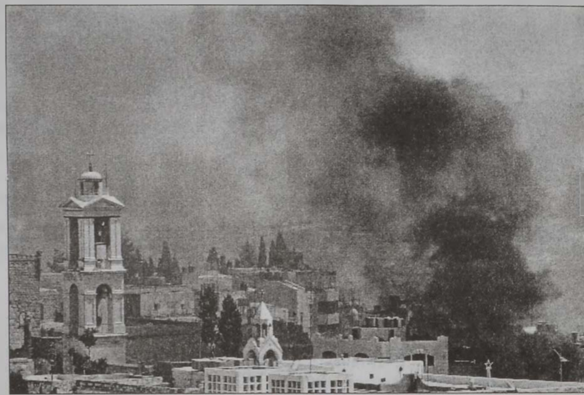
Հայոց Ս. Յակոբայ վանքի շրջակայքը՝ Ծուխերու մէջ:

Իսրայէլեան բանակը, որ ամերիկեան ճնշումներու կ'ենթարկուի վերջ տալու համար պաղեստինեան շրջաններուն դէմ յարձակողականին, երէկ նոր յարձակումներու ձեռնարկեց Այսրյորդանանի մէջ: Սակայն բանակը յայտնեց, որ 24 զիւղերէ ալ քաշուած է: Պաղեստինցի պաշտօնատարներ ըսին, որ քանի մը զիւղերէ հեռանալով՝ Իսրայէլ քարոզչական աշխատանք կը տանի Միացեալ Նահանգներու արտաքին գործոց նախարար Քոլին Փաուըլի Երուսաղէմ ժամանելու նախօրեակին: Պաղեստինցիները կ'ըսեն նաեւ, թէ ինչ իմաստ ունի քանի մը զիւղերէ հեռացումը, երբ Այսրյորդանանի մեծագոյն քաղաքները կը