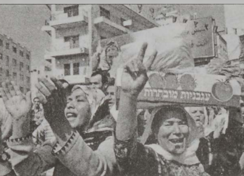
Օգտուելով քանի մը ժամուան արտոնութենէն՝ պաղեստինցի կիներ Արաֆատի գորակազմէն ցոյց կը կատարեն Ռամալլայի մէջ:

Իսրայէլի արտաքին գործոց նախարար Շիմոն Փերէս երէկ ըսաւ, որ իսրայէլեան ուժերը երեք շաբթուան մէջ կրնան հեռանալ պաղեստինեան շրջաններէն, աւարտելէ ետք իրենց առաքելութիւնը: Սակայն Փերէս