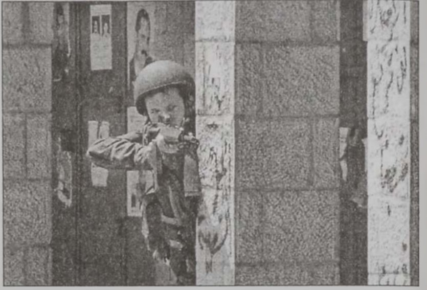
Իսրայէլացի զինուոր մը իր գնդապետը կ'ուղղէ անգէն պաղեստինցիներու վրայ:

ՕԹԱՆԻ ընդհանուր քարտուղար Ճորճ Ռոպորթսըն յայտնեց, որ ՕԹԱՆ չի քննարկել Միջին Արեւելքի տազնապին մէջ խաղաղարար դերակատարութեան մը ծրագրերը: Ռոպորթսըն աւելցուց, որ խաղաղութեան