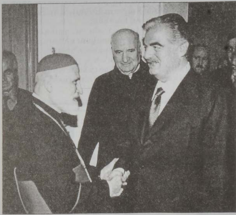
Սֆեյր պատրիարք կը դիմաորէ վարչապետը:

Վարչապետ Ռաֆիք Հարիրի երէկ այցելեց Պքերքէ, ուր Նասրալլա Սֆեյր պատրիարքին հետ ունեցաւ աւելի քան ժամ մը տեւած հանդիպում մը: