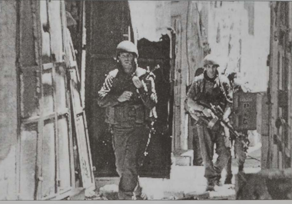
Իսրայէլացի զինուորներ կը հսկեն Բեթղեհէմի մէջ:

Բեթղեհէմի եկեղեցիին վրայ, դիտել տալով, որ Իսրայէլ բարբարոսու- թիւն կը կատարէ: Կաթո- ղիկէ կրօնաւոր մը ըսաւ, որ Իսրայէլ զրօժած է եկե- ղեցիին դէմ յարձակում չգործելու խոստումը: Պաղեստինեան աղ- ըիւրներ քննադատեցին Շարոնի ճառը՝ խորհրդ- դարանին մէջ, ուր իս- ռայէլացի վարչապետը յայտարարեց, որ բանա- կը պիտի շարունակէ Այսրյորդանանի դէմ զին- ւորական գործողու- թիւնը մինչեւ որ նուաճէ իր բոլոր թիրախները, որոնց կարգին է պաղես- տինցիներու ձեռքակա- լութիւնը: Շարոն խոս- տացաւ սակայն շուտով աւարտել գործողու- թիւնը: Ան պատրաստա- կամութիւն յայտնեց նա-