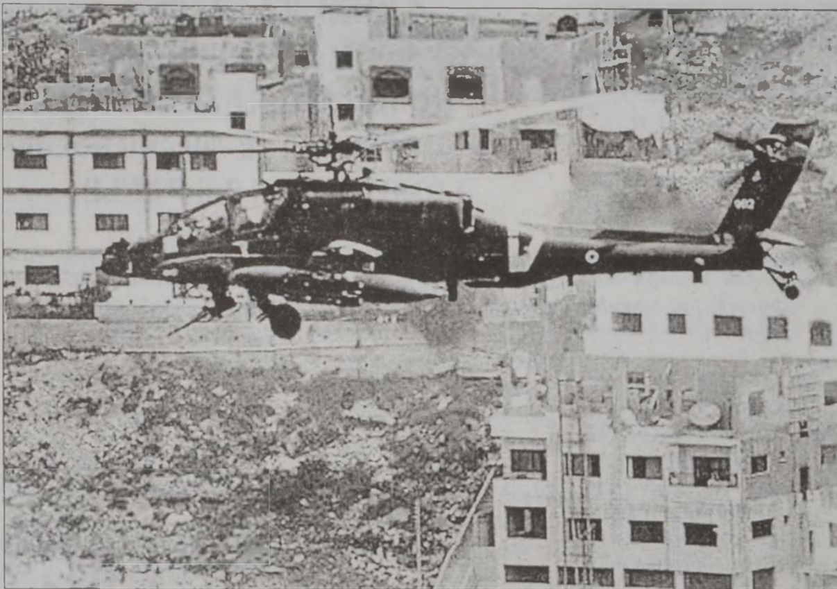
Իսրայէլեան «Ափաշի» մը՝ Նապոլուսի վերեւ

Այն պահուն, երբ Միացեալ Նահանգներու նախագահ Ջորժ Պուշ եւ Բրիտանիոյ վարչապետ Թոնի Դլէր ճնշում կը բանեցնէին իսրայէլի վրայ, պահանջելով, որ անյապաղ հետացնէ ուժերը պաղեստինեան շրջաններէն, Արիէլ Շարոն անդրդուելի կը մնար, հրահանգելով շարունակել պաղեստինեան շրջաններուն դէմ զինուորական գործողութիւնը՝ արժատահան ընելու համար «հարեկչական» ցանցերն ու անոնց