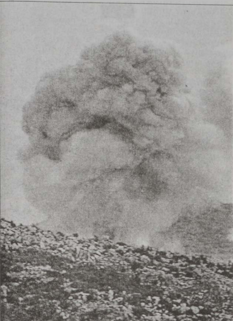
Զֆարշուպայի մէջ լիբանանեան դիրք մը կը մխայ՝ իսրայէլեան օդանաւային յարձակումէ մը ետք

Մագարէ՛՛ Շրպայի մէջ երէկ յետմիջօրէին սաստիկ բախումներ տեղի ունեցան իսրայէլեան դիրքերուն հիմադրութեան ուժերուն միջեւ. փոխադարձ ուժեղացումներու ու հրթիռարձակումները շարունակուեցան մինչեւ գիշեր: Երեկոյեան իսրայէլեան ուղղակիութիւններ կրակ բացին Ռամթայի, Ռուսասթ Արամի եւ Սըմաբայի դիրքերու շրջակայ բլուրներուն վրայ, մինչ սաստիկ ուժեղացումի կ'ենթարկուէր Մագարէ՛՛ Շրպայի մէջ իսրայէլեան «Ռատար»-ի դիրքը: Իսրայէլեան բանակը հաղորդեց նաեւ, որ լիբանանեան հողերէն ուժերը արձակուած են նաեւ դէպի հիւսիսային իսրայէլ, իսկ Շրպայի կողմէն ընթացքին ծանրորէն վիրաւորուած են երկու զինուորներ: