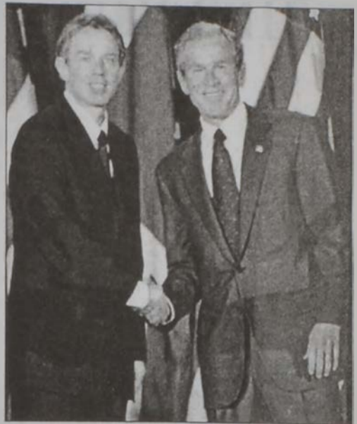
Պուլ Եւ Պլեր

Շրջանին մէջ վրացի խաղաղարարներու հրահանատար Քլեմէնթի թեւզածէ հաստատած է, թէ ռուսերը Շարաթ գիշեր յարձակումի ենթարկուած են, սակայն ան հարցականի տակ առած է անոնց տեղեկութիւններուն ճշգրտութիւնը: