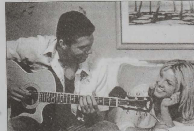
Մեծի Մուրի՝ «Է ուղը թու ռիմեյքը»ի մէջ

«Հարժապատկերի դէմ ոճի» չլուսահատեցուց փոփ աստղերուն ժողովրդականութեան միջոցով մեծ շահեր ապահովելու ձգտող արտադրիչները: Չլուսահատեցուցաւ նաեւ երգչուհին, որ իր դերասանական փորձերը պիտի շարունակէ «Ուայզ կըրըզ» եւ «Սուրիթ սայընս» ժապաւէտներով: