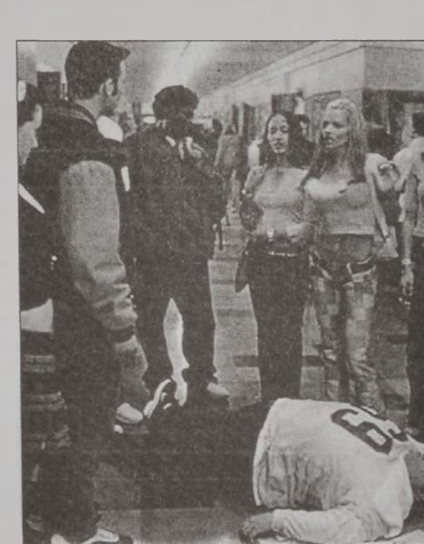
Տեսարան մը «Նաթ ընտորը թիւն մուլի»էն

Երկրորդական վարժարանի գեղեցկուհի ընտրապայքար, գեղեցիկ եւ հպարտ աշակերտներ, գեղեցիկ եւ շարժապատկերներու կողմէ լուսանցքի վրայ ձգուած կեղծ տգեղութեամբ խելացի աշակերտուհիներ, ամէն գնով հակառակ սեռին ուշադրութիւնը գրաւել փորձող պատանիներ, ուսուցչուհիներու հետ հարցեր... Անշուշտ ձեր միտքէն անցան պատանիներու յատուկ հոլովուտեան վիպային գանազան կատակերգութիւններ: Այս եւ տակաւին ամերիկացի պատանիներու բազմաթիւ այլ կերպարներ միացած են այս ձեւի տարբեր ժապաւէտներէ ներշնչուած տեսարաններով՝ պատրաստելու համար «Մեթ ընտորը թիւն մուլի» ժապաւէտը (բեմադրիչ՝ Ճոէլ Կալէն), զոր աւելի ճիշդ պիտի ըլլար անուանել «Լաք Էլրի տորը թիւն մուլի»: