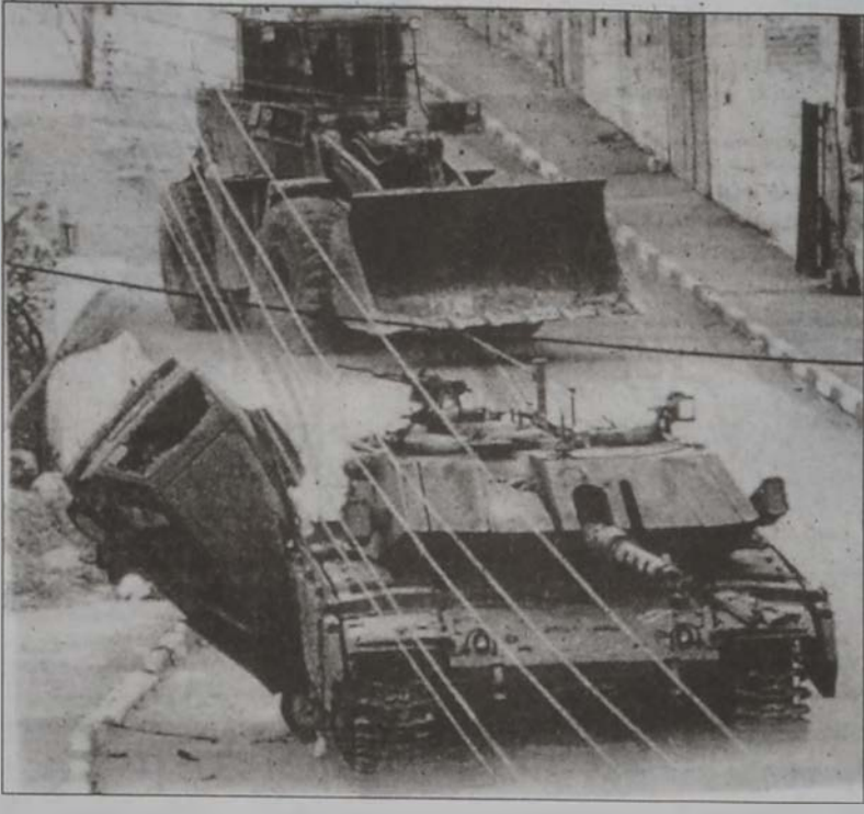
Իսրայէլեան հրասայլ մը Բեթղեեմի մէջ կը ձգնէ պաղեստինցիի մը ինքնաշարժը:

Յամենայնդէպս, իսրայէլեան պատերազմական ոճիրներու Շարոնի պատասխանատուութեան մը եւ բռնազր-