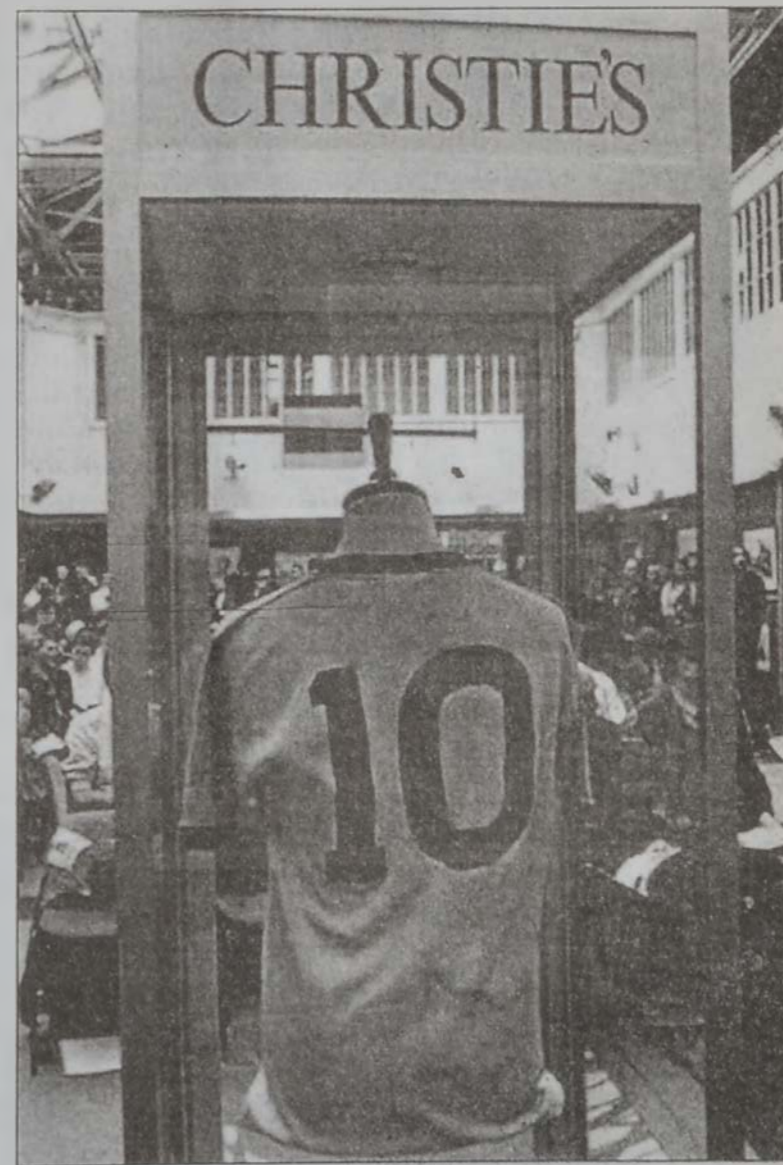
Փելէի շապիկը՝ «Էրիսթիզ»ի տան մէջ:

Անցեալ շաբաթավերջին «Էրիսթիզ» աճուրդի փան մէջ (Լոնկոն) վաճառուեցաւ որագիւցի ֆուտպոլի ասպղ Փելէի թիւ 10 շապիկը՝ 220 հազար փոլարի: Եւրոպայի վաճառքը ակնկալուածէն երեք անգամ ատելի սուղ վաճառուեցաւ: Փելէի զայն հազար էր 1970ի Մոնտիալի արարականին: Երբ հարց արուած է անոր, թէ արդեօք ի՞նչ մեկնաբանութիւն ունի կապարակիլ այս գծով, ան ժողիպով մը դասախոսեցաւ, թէ ինք չէր այդ գիւրը որոշողը, հետեւաբար անիկա այդքան ալ կ'արժէ: