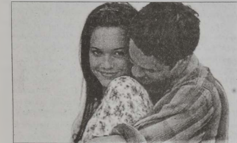
Պրիթնի Սփիրզ՝ «Քրոստոս»ի մէջ

առանձինն պատասխանատու չէ տոմսակներու վաճառքի ցուցակին մէջ ժապաւէտին արձանագրած դիրքին: «Այդ չինչանակեք, թէ անոնք տաղանդ չունին կամ սխալ քայլի դիմած են», կ'աւելցնէ ան: Դերասանական ասպարէզը երգիչներուն համար դարձած է ապագային անգործութենէ խուսափելու միջոց, իսկ փոփ աստղերով ժապաւէտներու արտադրիչներուն համար՝ բախտաւար: Անոնցմէ ոմանք սկսած են անդրադառնալ, թէ մարզի մը մէջ արդէ իսկ հոշակաւոր աստղեր, երբ այլ մարզ մը «փոխադրուին», պայման չէ որ անոնց երկընկրտները մեծ գանգըլածներով հետեւին իրենց: