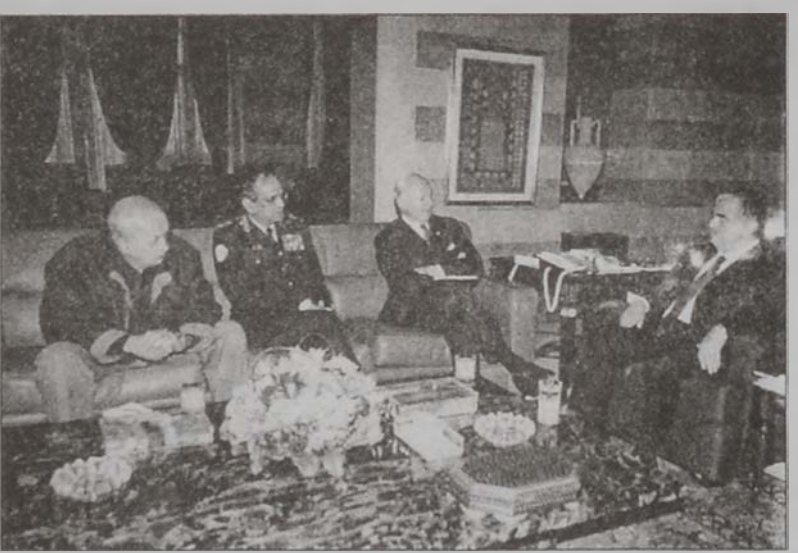
Տը Միսթուրա եւ Ֆինիլի պատասխանատուները՝ վարչապետ Հարիրիի գրասենեակին մէջ:

Հարաւային Լիբանանի մէջ ՄԱԿի ընդհանուր քարտուղարի յատուկ ներկայացուցիչ Սթեֆան Տը Միսթուրա երէկ երկու անգամ այցելեց վարչապետ Ռաֆիք Հարիրիի անոր կ'ընկերակցէին Ֆինիլի հրամանատար զօր. Լալիթ Թեուարի եւ բանրբեր թիւրք Կէօքսէլ: