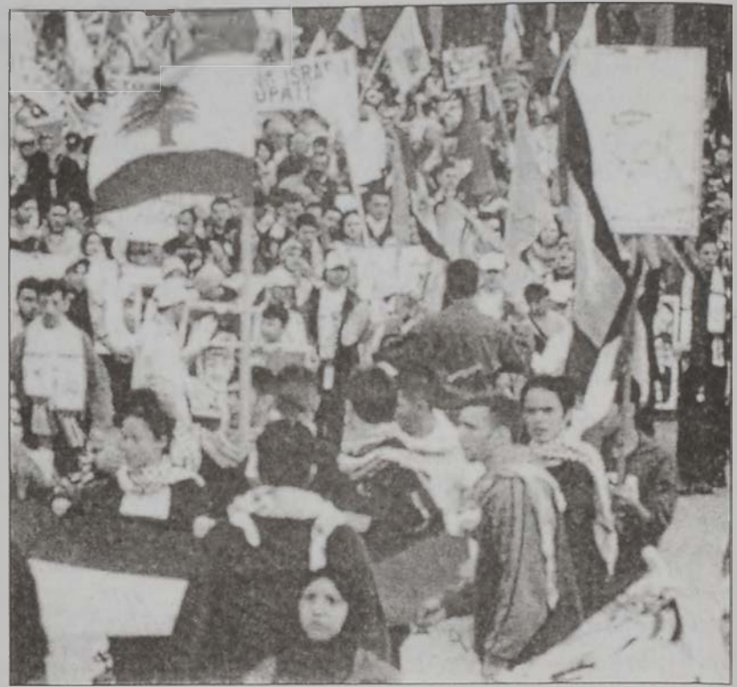
Յուցարարներու խումբ մը՝ Պարպիրի շրջանին մէջ (1 Ապրիլ):