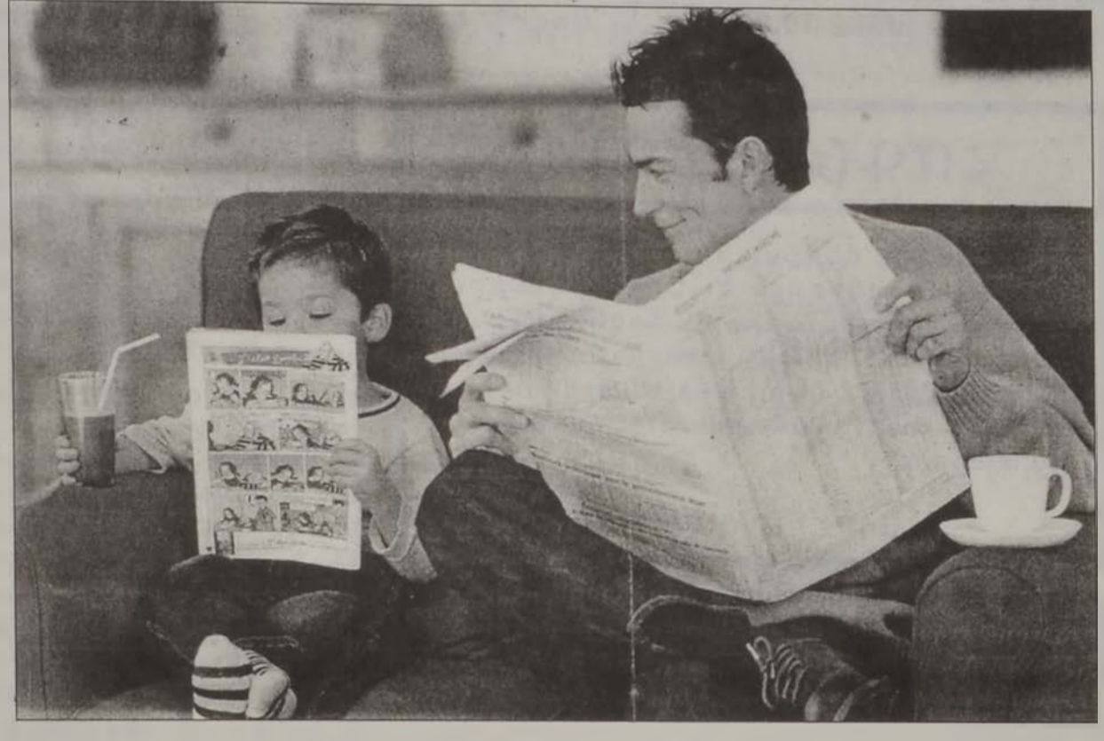
Ամէն իրիկուն կարդալ երեխային:

ՄԱՆԿԱՎԱՐժԱԿԱՆ ՄՕՏԵՑՈՒՄՆԵՐ - Շատ կանուխէն եւ յաճախ երեխային պէտք է գիրք կարդալ: - Ամէն իրիկուն եւ նոյնիսկ արձակուրդի օրերուն երեխային գիրք կարդալ: - Երեխային բարի օրինակ ծառայել եւ յաճախ անոր ներկայութեան գիրք կարդալ եւ կարդացածին մասին բարձրաձայն արտայայտուիլ: - Գիրքերը այլազանել (նիւթի իմաստով): - Այլուրեքի որմագ մը կախել սենեակին պատէն: - Պատիկ հաւաքող մը կազմակերպել երբ 10 գիրք կարդայ, իսկ աւելի ուշ՝ երբ 100 գիրք կարդայ: - Գովել երեխան իր ընթերցասիրութեան համար եւ յաճախ յիշեցնել գիրք կարդալու բարիքները (բառամրթերքի ճոխութիւն, գիտելիքներու ամբարում, դպրոցէն ներս փայլուն արդիւնքներ, եւ այլն):