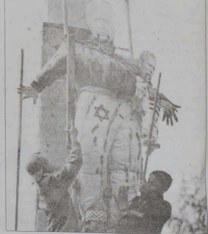
Երեխաներ կը քանակոծեն Ծարոնը եւ Պուշը ներկայացնող երկվախանի խրտուիլակ մը: