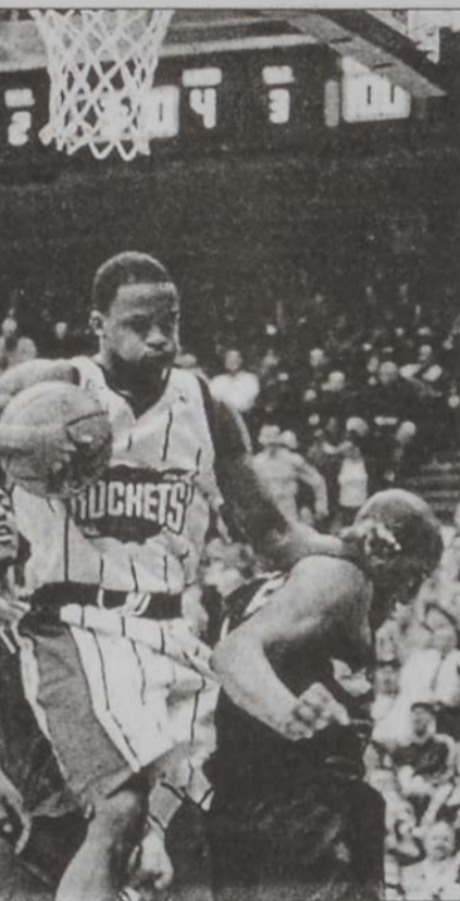
Սթի Գրեմսիս (կեդրոնը)

Ստորեւ՝ մրցումներուն արդիւնքները՝ Քիլիվէնտ Քաւալիքս - Ֆեօնիքս Սանգ Պոսթըն Սեյթիքս - Ինտիկան փեյքըրզ Լոս Աճճելըս Լէյքըրզ - Ուաշինգթըն Ուիզարտ 113-93 Արլանդա Հոքս - Միլուոքի Պաքս 100-92 Տիթրոյիթ Փիսթրնչ - Մայսին Հիթ 90-87 Սաքրամենթո Քիսկիզ - Մեմփիս Կիսկիզ 107-83 Նիւ Եորք Նիքս - Շարլոթ Հոնթըք 91-85 Հիուսթըն Ռոքէթը - Սիեթլ Սուփըրսոնիքս 100-98 Տեքսըս Նակթըք - Եուրա Ճէգ 98-90 Կոլորադո Սթըյք Ուորիքըրզ - Փորթլենտ Թրէյլ Պլէյքըրզ 107-91