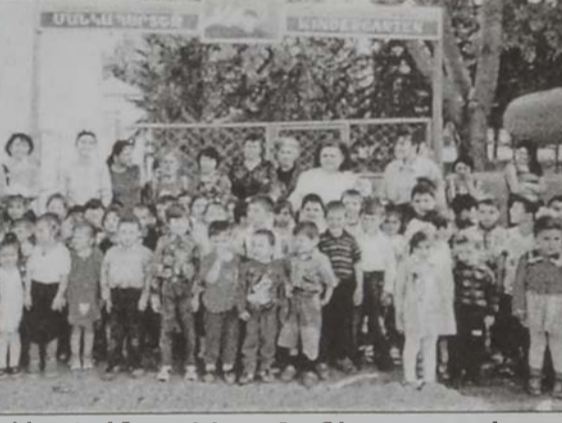
Արցախի «Սօւտ Մայրիկ» մանկապարտէզ

Լիբանանի պատուիրակութիւնը ժողովին ընթացքին ներկայացուցած է շրջանի կրթական հաստատութիւններուն եւ հայ վարժարաններուն իրավիճակը, ուսուցիչներուն ամսականներու վճարման դժուարութիւններուն, երիտասարդութեան դպրոցէ դուրս մնալուն եւ աշխատելու ստիպողութեան իրողու-