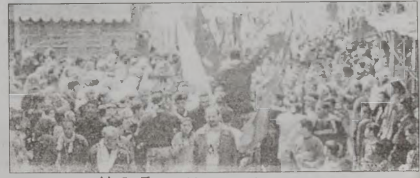
Այն Հոլուրի պաղեստինեան գաղթականացի մէջ (1 Ապրիլ):