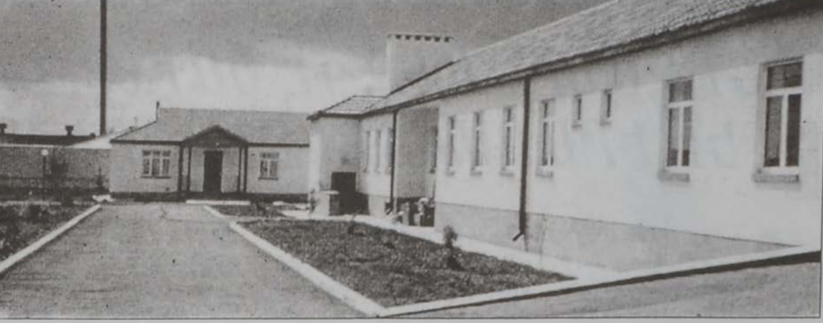
«Մօր եւ Մանկան Առողջապահութեան Կեդրոն»

Դիլիջանի մէջ ՀՕՄի նուիրուած է հող մը, ուր պիտի կազմակերպուին ամառնային ճամբարներ եւ առիթ պիտի տրուի երիտասարդներուն հայրենիք այցելելու: Երեւանի, Թալինի եւ Վայոց Ձորին մէջ կան ակնարկներ եւ ատամնաբուժական կեդրոններ: Ակնարկով կ'ընդունեն բաւական զարգացած է եւ հոն արհիւրէն ակնոցներ կը տրամադրուին աղքատներուն, իսկ յարմար