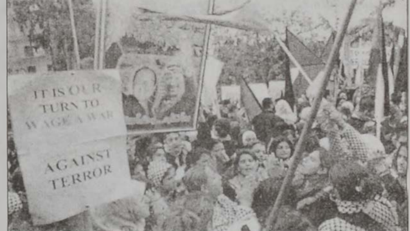
Աուքարի Ամերիկեան դեսպանատան առջև (1 Ապրիլ):