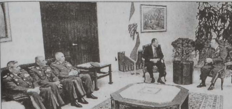
Սուրիական պատուիրակութիւնը՝ Գախազահից մօտ:

Թաէֆի Համաձայնագրի գործադրութեան ծիրէն ներս, Լիբանանի մէջ սուրիական ուժերու վերադասարում պիտի կատարուի մէկ շաբաթէն: