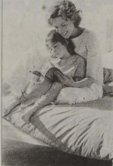
Բարի օրինակ ծառայել երեխային:

- Երեխային ձեռքը հետաքրքրական գիրք մը տալ ճամբորդութիւններու ընթացքին: - Նոյնիսկ երբ երեխան առանձին սկսի կարդալու, երբեմն անոր կարդալ յօդուածներ կամ նիւթեր, որոնք առանձին կարդալու պարագային դժուարութիւն պիտի ունենայ հասկնալու: - Քաջակրկնել, որ երեխան կարդայ զանազան բնոյթի գրութիւններ, ինչպէս՝ գինք շրջապատող որմագները, երթեւեկի ցուցանակները, օրաթերթ, նամակ, բացիկ, եւ այլն: - Քաջակրկնել երեխան, որ ձեռք օրինակին հետեւելով ինք ալ իր կրտսեր քրոջ կամ եղբոր համար կարդայ: - Երբեմն երեխայէն խնդրել, որ ինք ալ ձեռք համար բան մը կարդայ եւ այդ առիթով սրբագրել անոր հնչարանական կամ առողջանութեան հիմնական սխալները (ոչ բոլորը, որպէսզի չյուսալքուի): - Տեւարար ընտրել իր տարիքին եւ մակարդակին համապատասխան գիրքեր: - Հետաքրքրութիւն ցուցաբերել երեխային կարդացած գիրքերուն հանդէպ, հարց տալ, թէ ան բարոյական ի՞նչ դաս քաղեց այդ պատմութենէն եւ այլն: - Շաբաթական եւ ամսական դրուութեամբ անոր մատակարարել իր տարիքին յարմար շաբաթաթերթեր եւ ամսաթերթեր: