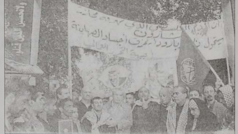
Սապրայի եւ Ծափլայի գոհերուն հաւաքական գերեզմանատան մէջ: