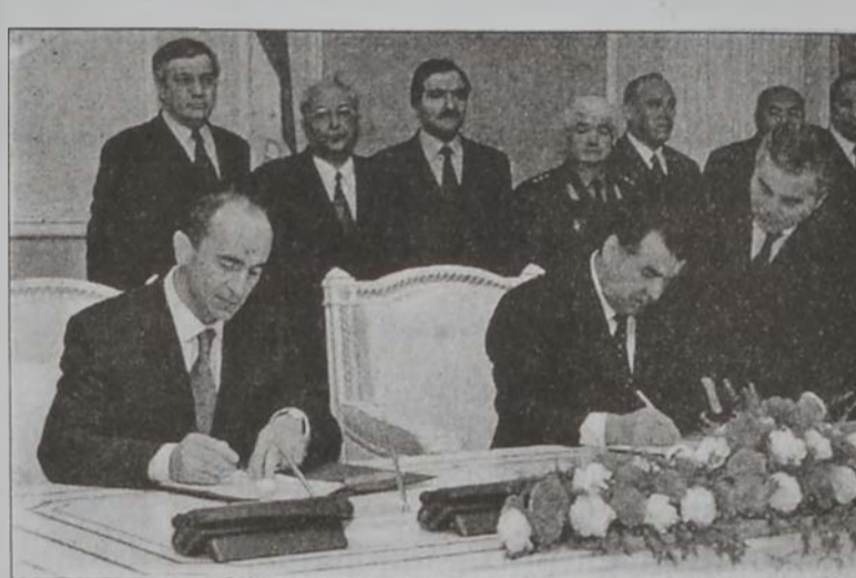
Քոչարեան եւ Ռախմանով կը ստորագրեն բարեկամութեան եւ համագործակցութեան պայմանագիրը:

Հայաստանի նախագահ Ռոպէրթ Քոչարեան, որ պաշտօնական այցելութեան մը համար Տաճիկիստան կը գտնուի, երէկ մայրաքաղաք Տուշանայի մէջ հանդիպումներ ունեցաւ Տաճիկիստանի վարչապետ Աբլի Աբլիովի եւ խորհրդարանի նախագահ Մահմուտ Սալի Ուպալուրաբի հետ: Այնուհետեւ նախագահը այցելեց Տաճիկիստանի հնագիտութեան ազգային թանգարան: Ռոպէրթ Քոչարեանի գլխաւորած պատուիրակութիւնը նաեւ այցելեց Կեդրոնական Ասիոյ քաղաքակրթութեան, գիտութեան եւ կրթութեան հնագոյն կեդրոններէն՝ խուճանդ քաղաքի պատմական վայրերը: