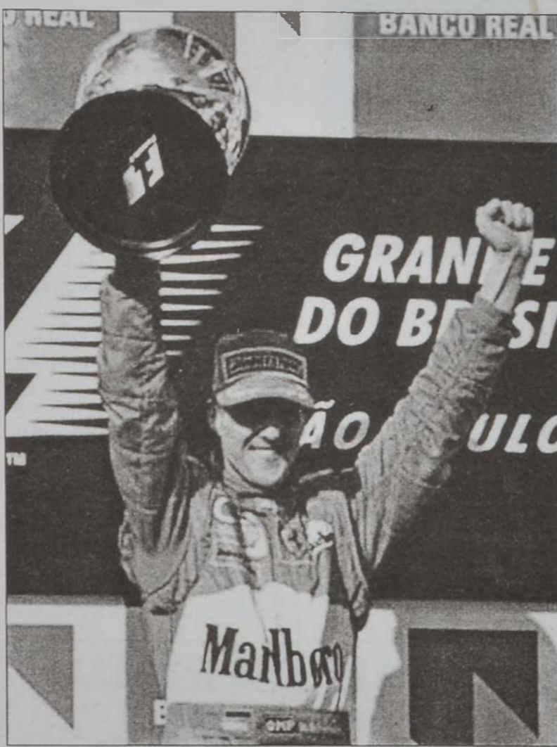
Միքայել Շումախըր՝ դարձեալ առաջին

Ֆորմիլա 1ի 2002ի աշխարհի ախոյեանութեան երրորդ կրան փրիկ, որ տեղի ունեցաւ անցեալ կիրակի օր, Պրայիլի մէջ, վերջ գտաւ գերմանացի Միքայել Շումախըրի (Ֆեռարի) յաղթանակով, որ այս եղանակին առաջին անգամ ըլլալով կը մասնակցէր իր նոր ինքնաշարժով: Նախորդ երկու կրան փրիկներուն ան մասնակցած էր անցեալ տարուան ինքնաշարժով: