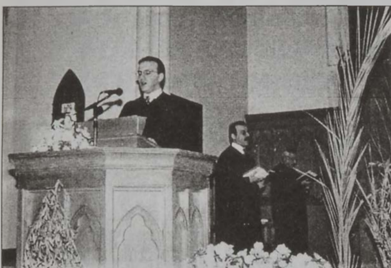
Ս. Զատիկը՝ Հայ Աւետարանական Առաջին եկեղեցւոյ խորանէն

Ս. Զատկուան հայրապետական իր պատգամին մէջ Արամ Ա. կաթողիկոս հինգ մտածումներով զարգացուց աստուածապարգե կեանքի գաղափարը, կեանքը տեսնելով իրրե Աստուծոյ պարգեւը, իրրե տիեզերական իրականութիւն մը, իրրե միջոց եւ ո՛չ նպատակ, անոր վերանորոգիչ իրրե ուժ Քրիստոսը ներկայացուց եւ ի վերջոյ, հինգերորդ կէտով երկրաւոր կեանքէն անդին՝ յաւիտեանական կեանքին վերադարձը բացատրեց իրրե Քրիստոսի պատկերացուցած «առաւել կեանք»ին վերադարձ մը: Ան ըսաւ. «Յարութեան յղթանակով շահուած կեանքը առաւել կեանք է, Աստուծոյ շնորհքով ու ճշմարտութիւններով օժտուած կեանք, որ կոչուած է մարդը Աստուծոյ Տաճարը դարձնելու», շեշտեց վեհափառ հայրապետը: