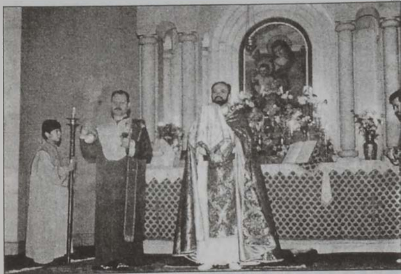
Առաջնորդ Սրբազանը Զատկուան պատարագը կը մատուցէ Ս. Նշան Մայր եկեղեցւոյ մէջ