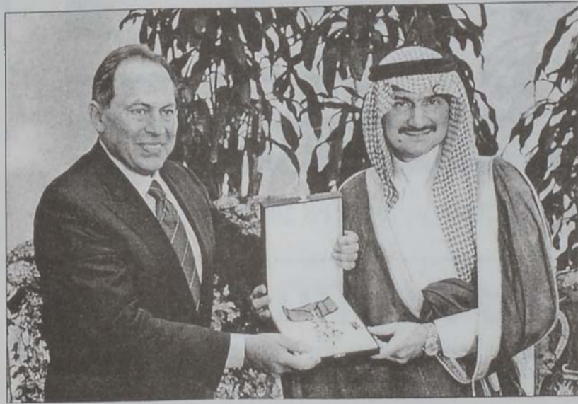
Լահուտ կը պարգևատրէ Ուալիտ Պըն Թալալը:

Նախագահ Լահուտի կ'ընկերակցէին կազմակերպիչ յանձնախումբի նախագահը՝ նախարար Դաս-