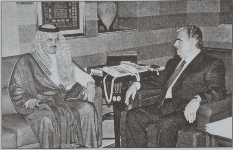
Սենտակի պաշտոնատարը այցելեց վարչապետ Հարիրիի:

Սենտակի Արաքիոյ արտաքին գործոց նախարար Սենտ Ֆայսալ իշխանը երէկ յետմիջօրեին ժամանեց Պէյրութ, իրանացի պետական պաշտօնատարներուն ներկայացնելու Միջին Արեւելքի խաղաղութեան համար Սենտակի Արաքիոյ գահաժառանգ իշխան Ապտալայի նախաձեռնութեան մասին ցարդ կատարուած խորհրդակցութիւններուն արդիւնքները, ինչպէս նաեւ խորհրդակցութիւններ ունենալու շրջանալիկ վարչապետներուն ու Պէյրութի մէջ գումարուելիք արաքական վեհաժողովին վերաբերեալ հարցերուն շուրջ: