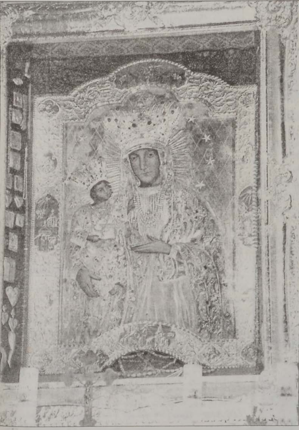
Հայկական սրբանկար Կտանցի մատրան մը մէջ:

Դատաստանագիրքը 1528ին թարգմանուեցաւ հայատառ դիւանագրէնի եւ լեհերէնի: Մինչեւ ԺԸ. դար անիկա օգտագործուեցաւ իրենց դատական ինքնավարութիւնը պահպանած լեհահայ ըլլող գաղութներուն մէջ: