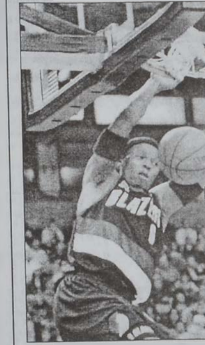
Պոնգի Ուելզ՝ կողով մը Գշտակած պահուց:

Մտորեա՝ այսօրուան մրցումներուն յայտագիրը: Նիւ Ճըրքի Նէթց - Բլիթթըն Քաւաիթց Ֆիլադելֆիա Սիթթըրզ - Մայնի Հիթ Նիւ Եորք Նիքս - Մէմֆիս Կրիպիդ Թորոնթօ Ռեփթըրզ - Միլուոքս Կոլտըն Սթըյթ Պաքս - Օրլանտօ Մէճիք Արլանտօ Հոքս - Շիքաքօ Պուլզ Լոս Անձելըս Լէյքըրզ - Տալաս Մալթրիքս Տիքսոնիք Փիսթընզ - Եուրա Ճէյ Կոլտըն Սթըյթ Ուորիոր - Սիթթըլ Մուլթրոնիքս Հիուսթըն Ռոքեթց - Սաքրամենթօ Քինկզ