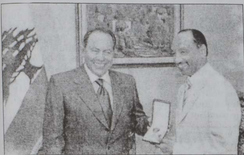
Նախագահ զոր. Էմիլ Լահուտ Մայրիներու շքանշանը կը յանձնէ Մոհամէտ Պըն Համամ Ապտալլայի:

Լիբանանի ֆուտբոլի ֆետերասիոնը իր հերթական ժողովին շնորհակալութիւն յայտնեց նախագահ զոր. Էմիլ Լահուտի, որ Մայրիներու սպայից կարգի շքանշանով պատուեց Ասիոյ ֆուտբոլի ֆետերասիոնի նախագահ Մոհամէտ Պըն Համամ Ապտալլային: