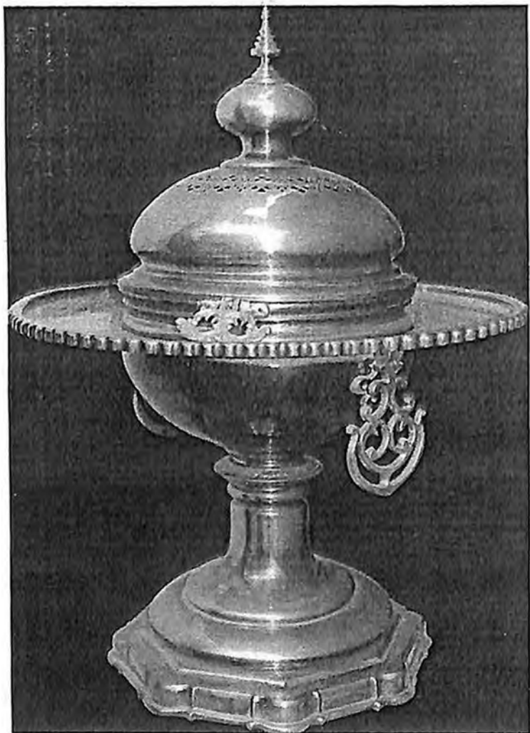
Նկար 2. Կրակարան, գործ՝ Մելքոն Ուստայի