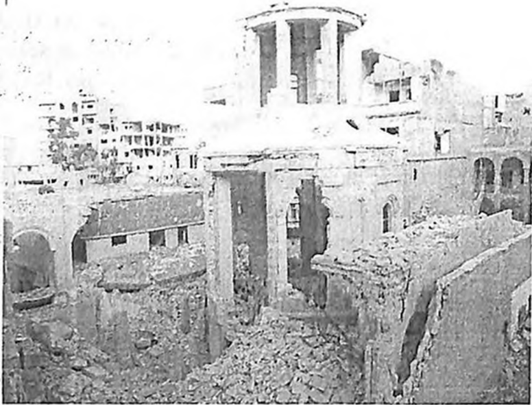
Դեր Ջորի Սրբոց նահատակաց հայկական եկեղեցին պայթեցված իսլամիստ ահաբեկիչների կողմից (2014 թ., սեպտեմբերի 21-ին ամսաթիվը պատահական չէ ընտրված, Հայաստանի երրորդ Հանրապետության անկախության հռչակման օրը)

changing, rapidly globalizing geopolitical conditions, ceaselessly facing new challenges.