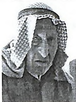
Բաշիր էլ Սաադի