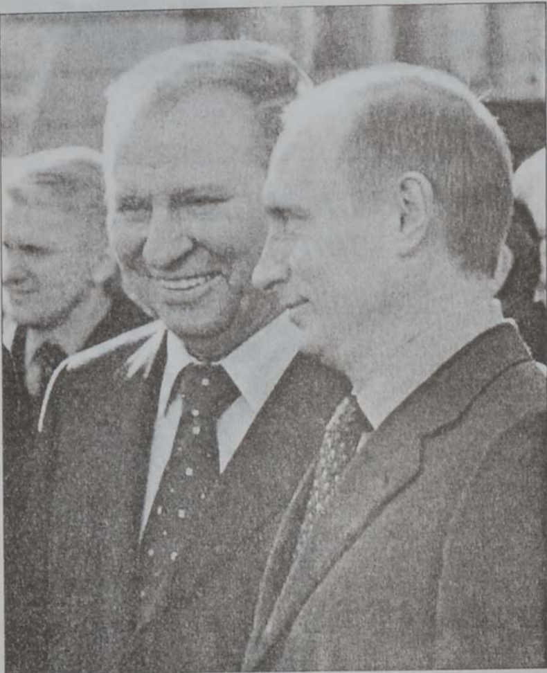
Վլադիմիր Փուտին և Լեոնիդ Զուլցմա