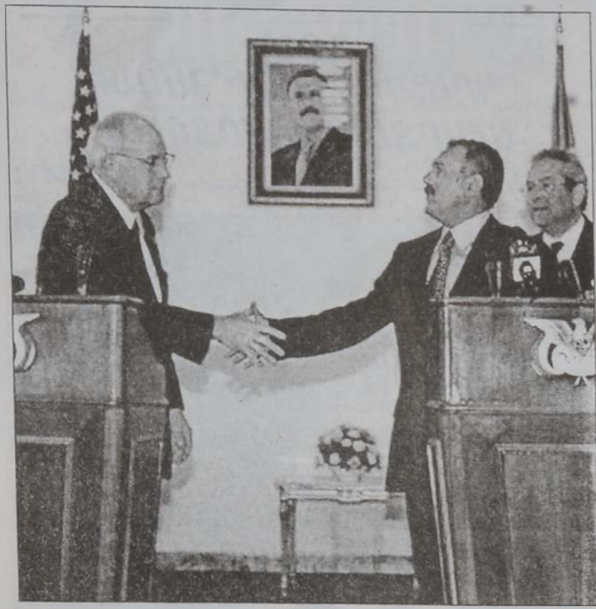
ՉԷՅՆԻ ԵՒ ՍԱԼԷՆ

Միացեալ Նահանգներու փոխ նախագահ Տիք Չէյնի երէկ Եմէնի պորակցութիւնը ապահովեց ահաբեկչութեան դէմ Ուաշինկթընի կեցածքին, սակայն չյաջողեցաւ նոյն պորակցութիւնը ապահովել Իրաքի դէմ ամերիկեան պիւտրական գործողութեան մը: