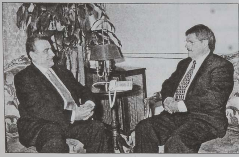
Նախարար Համսուտ կ'ընդունի Պեթըլը:

Միացեալ Նահանգներու դեսպան Վինսթըն Պեթըլը երէկ այցելեց արտաքին գործոց նախարար Մամսուտ Համսուտի, ապա յայտարարեց, որ անոր հետ քննարկած է Պէյրուսի մէջ գումարուելիք արաբական վեճաժողովի նախապատրաստութիւնները: Պէթըլը ըսաւ, որ Համսուտ իրեն ներկայացուցած է արաբ արտաքին գործոց նախարարներու Գահիրէի ժողովի արդիւնքներն ու այս ամիս Պէյրուսի մէջ գումարուելիք արաբական վեճաժողովի կազմակերպման հարցերը: