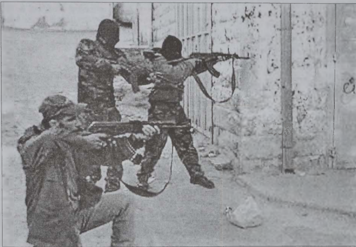
Պաղեստինցիներ կը դիմադրեն իսրայէլացի զինուորներու ներխուժումներուն:

Իսրայէլի վարչապետ Արիէլ Շարոն երէկ հրահանգեց բանակին հանգրուանային հեռացումը Ռամալլայէն: Բարձրաստիճանի պաշտօնատար մը ըսաւ, որ իսրայէլեան ուժերը ամբողջութեամբ պիտի հեռանան Ռամալլայէն, սակայն պաշտօնական օղակ մը պահելով քաղաքին շուրջ: Ան աւելցուց, որ բանակը աստիճանական կերպով պիտի հեռանայ: Պաշտօնատարը չըսաւ, սակայն, թէ բանակը ե՞րբ պիտի սկսի հեռանալու պաղեստինեան քաղաքէն: Անոր յայտարարութեան կարճ ժամանակ մը ետք, ակնատեսներ յայտնեցին, որ իսրայէլեան հրասայլերը իրենց դիրքերուն վրայ կը մնան՝ փակած պահելով ճամբաները, որոնք Ռամալլայի կեդրոնական բաժինները կը տանին: