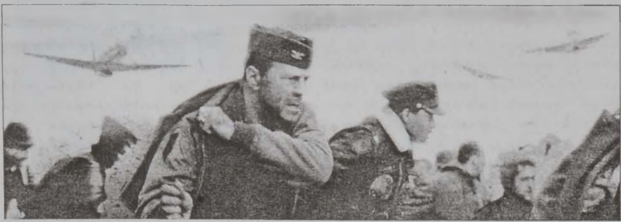
Տեսարան մը՝ «Հարթ ուր» ժապաւնէն:

Վիեթնամի պատերազմին եւ անոր յաջորդող տասնամեակներուն, պատերազմական եւ յատկապէս Վիեթնամի անհնչող ժապաւններ արտադրելու Հոյակապ տրամադրուած թիւնները նուազած կը թուէին ըլլալ 1990ականներուն: