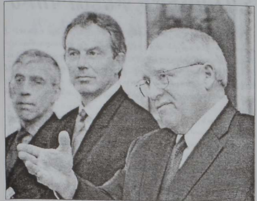
Չէյնի կը պատասխանէ լրագրողներու հարցումներուն:

Միացեալ Նահանգներու փոխ նախագահ Տիք Չէյնի, որ եւրոպական ու միջինարեւելեան շրջապատում մը ձեռնարկած է, երէկ Լոնտոնի մէջ հանդիպում ունեցաւ Բրիտանիոյ վարչապետ Թոնի Բլէյրի հետ: Ուշիկներէն կ'ուզէ Լոնտոնի գորակցութիւնը ապահովել ահաբեկչութեան դէմ պատերազմը դէպի Իրաք ընդարձակելու ծրագիրին, որ կը քննադատուի շատ մը երկիրներու կողմէ: