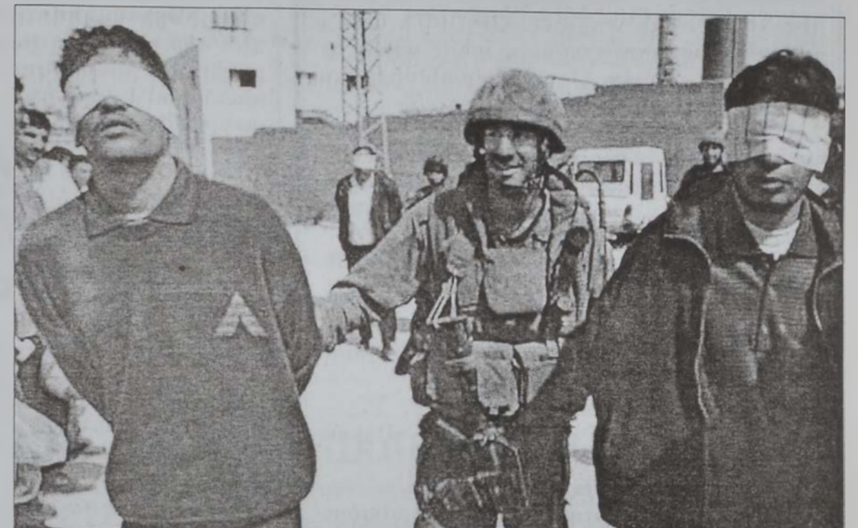
Իսրայէլացի զինուոր մը ձերբակալուած երկու պաղեստինցի երիտասարդներ, որոնց աչքերը կապուած են, կ'առաջնորդէ դէպի գրահապատ մը:

Պաղեստինեան իշխանութեան մէկ աղբիւրը, սակայն յայտնեց, որ Իսրայէլ փոխանցած է, որ Արաֆատ թէեւ կրնայ Ռամալլային դուրս գալ, բայց եւս այսպէս չի կրնար արտասահման մեկնիլ: Շարոնի գրասենեակին կողմէ հրատարակուած յայտարարութիւնը կը յայտնէր, որ վարչապետը որոշած է չկաշկանդել Արաֆատի ապատութիւնը պաղեստինեան իշխանութեան հակազինուորի տակ Չայիիին սպանութեան մեղսակցած էր: