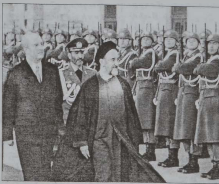
Աւստրիոյ Նախագահը կը դիմաւորէ Թաթեմին:

ԹԵՐԱՆ, 11 (ՌՈՅԹԸՐԸ).- Իրանի նախագահ Մոհամէտ Սաթեմի Երկուշաբթի օր Աւստրիա ժամանեց պաշտօնական այցելութեան մը համար, որուն նպատակն է ամրապնդել Թեհրանի կապերը Արեւմուտքի հետ, հակառակ անոր որ Միացեալ Նահանգներու նախագահ Ճորձ Պուշ յայտարարած էր, որ Իրան մաս կը կազմէ «չարութեան առանցքի մը»: